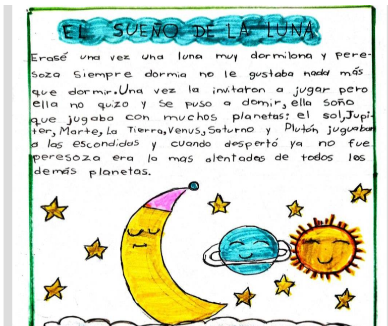
Ilustración 3 Erica Maca