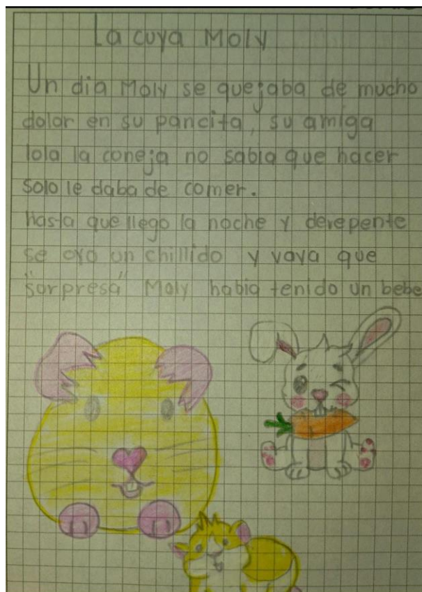
Ilustración 2. Ana Fuentes