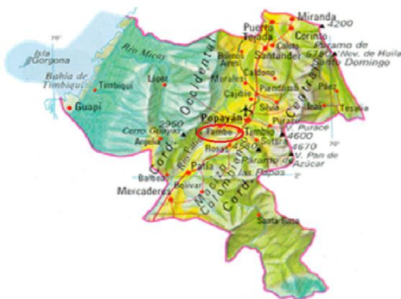
1: Mapa físico del Departamento del Cauca y ubicación del Municipio de El Tambo. http://www.todacolombia.com/departamentos-de-colombia/cauca.html Mapa Físico del Departamento del Cauca. 2015

En la siguiente imagen del Departamento del Cauca, se señala la ubicación del Municipio de El Tambo.