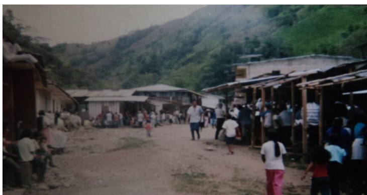
Imagen 13: Mercado corregimiento de Playa Rica, El Tambo Cauca. Playa Rica 2015.

La incursión de personas transformó el paisaje del lugar, iniciando el proceso con el desmonte y la demarcación de caminos de herradura, que por las condiciones quebradizas del terreno y la falta de presupuesto para realizar una carretera, llevaron a que los únicos medios de transporte fueron largas caminatas y algunas mulas de carga, lo cual dificultaba el ingreso de algunos alimentos, tanto así que se vieron forzados a realizar algunos de ellos de manera artesanal. En dicho entonces, se cobraba un impuesto de 1 peso a los dueños de mulas o a quienes ingresaban ganado, dinero que era invertido en el arreglo de los caminos, pero las difíciles condiciones para conseguir dinero en el lugar, llevaron a que se organizaran mingas en pro de su mantenimiento “se nos daba trayectos para organizar por cuadras o kilómetros”, al incursionar los grupos guerrilleros y al presenciar las fuertes rivalidades entre veredas- constituidas paulatinamente alrededor del caserío- se les ordenó que todas debían colaborar por igual, ya que transitaban los caminos para ingresar o salir.