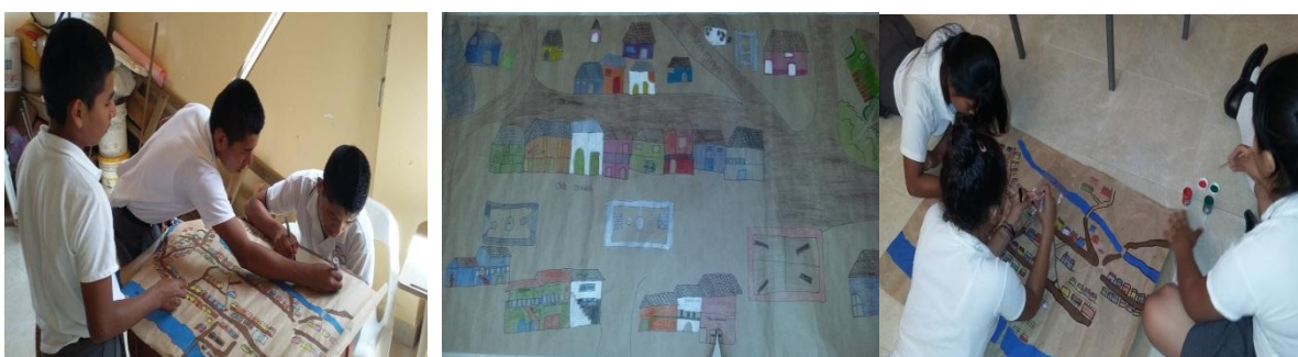
Imagen 2: Secuencia de cartografía social de Playa Rica. Elaborado por S.I. 2015.

plantear los espacios que ocupó y ocupa la Institución, pero por problemas climáticos (fuerte lluvia) se realizó en la sede de secundaria de la Institución, se adecuó el salón de grado sexto ya que este contaba con mejor iluminación y mayor espacio. El entrevistado llegó 20 minutos antes de lo esperado, motivo por el cual algunos integrantes del S.I. entablaron un diálogo informal mientras llegaban el resto de compañeros. Algunos de los integrantes no se presentaron a la entrevista, debido al partido de futbol entre el Real Madrid y el Barcelona. Se hicieron las pruebas de sonido y se tomaron algunas fotografías para determinar cuál sería el mejor lugar para ubicar al entrevistado.