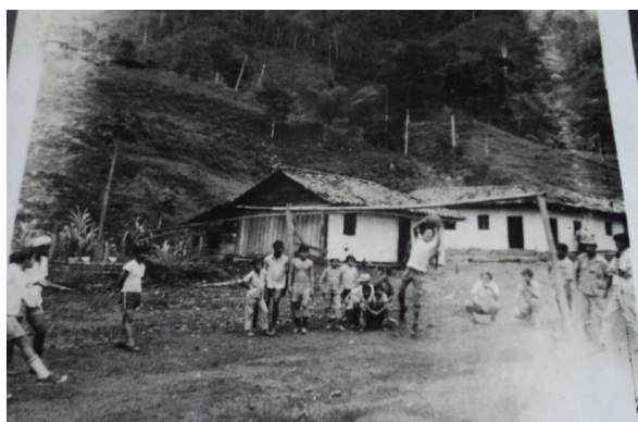
Imagen 12: Partido de Fútbol en el corregimiento de Playa Rica El Tambo Cauca. Playa Rica, 2015.