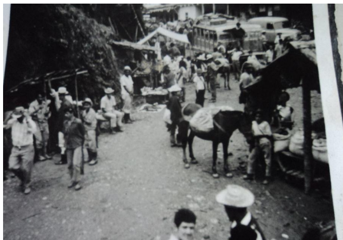
Imagen 14: Caserío El Veinte de Julio, El Tambo Cauca. Playa Rica 2015.

En los primeros años el carro llegó hasta el sitio denominado como “El Asomadero”, desde donde se debía emprender largos caminos, don Ezequiel bosquejó el recorrido que debía hacer para ingresar, “los caminos saliendo son subidas así que poco rendía y como la gente bajaba cargada en la espalda tampoco rendía... con lo que se trajera, bajaba uno por las Américas, cogía por Tinto Frio, y de allí se llegaba a un punto llamado Casesin, de ahí bajaba por Filo Seco, hasta llegar a la Playa”. Después de varios años la carretera se fue construyendo por tramos, y del Asomadero bajó hasta la Cabaña, luego hasta la Peña del Perro “camino que presentaba tanto deslizamiento que tocaba pasar a pie” (Ruiz), para el año de 1971, en plena celebración del 20 de Julio la carretera llegó hasta el caserío que llevó dicho nombre, convirtiéndose este lugar en centro de acopio de los corregimientos de Huisitó y Playa Rica.