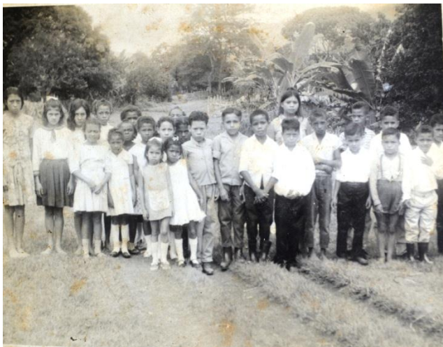
Imagen 18: Estudiantes y Docente ERM Playa Rica, Archivo Fotográfico Familia Perdomo Vergara. Popayán, 2015

Organizaban para los estudiantes las primeras comuniones, celebraban festividades como: fiesta de la madre, del padre y de la familia, entre otras; al finalizar los años lectivos organizaban las clausuras con sainetes, que eran ensayados por los padres quienes se lucían con las presentaciones, “no éramos maestros de tiza y clase... y se fue... éramos comunidad”, gracias al respeto y la colaboración de los padres de familia y la comunidad el proyecto de la escuela pudo surgir como una realidad.