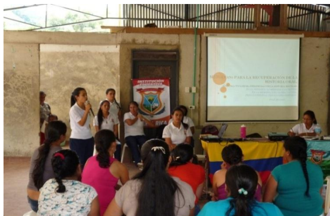
Imagen 1: Socialización de Proyecto con comunidad Playa Rica. 11-03-2015

Antes de emprender el proceso de socialización del proyecto de investigación con la comunidad educativa, se hizo una presentación inicial con los integrantes de la Junta Directiva de la Acción Comunal 12 –JAC-, a quienes se les dio a conocer los objetivos de la investigación, la manera como se llevaría a cabo y los compromisos que se adquirirían frente a la comunidad al finalizar la investigación, pese a ser aprobado el proyecto por los líderes, solicitaron se socializara con toda la comunidad para ser avalado por la asamblea, conformada por los habitantes del corregimiento mayores de 14 años y que estuvieran inscritos en el libro de socios de la JAC. Finalizada la reunión se firmó como constancia de aprobación del proyecto de investigación el acta y la carta de aval de la JAC 13 . Se aprovechó el momento para firmar los formatos de consentimiento de los padres y madres de familia de quienes participarían en el S.I. quienes permitían se hiciera uso de fotografías, material recolectado y producción académica de los estudiantes 14 .