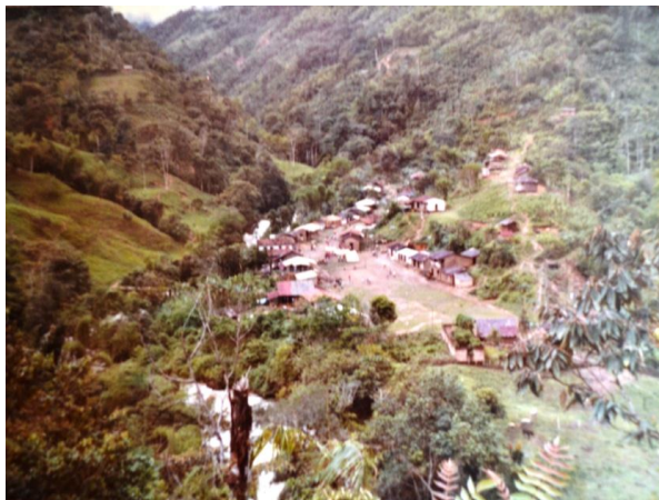
Imagen 16: Corregimiento de Playa Rica. Popayán, 2015

La problemática agraria que azotó a Colombia desde los años 30 y el constante choque entre las élites partidistas (Conservador- Liberal), ocasionaron grandes movilizaciones de población al interior del país, trayendo consigo la formación de nuevos núcleos poblacionales en terrenos baldíos y selvas vírgenes; es así como a lo largo de la década del 40 se empezaron a dar las primeras exploraciones al interior de lo que hoy se reconoce como el corregimiento de Playa Rica en el Municipio de El Tambo- Cauca, lugar al cual arribaron migrantes de diversos sectores del país, como: Putumayo, Caquetá, Antioquia, Valle del Cauca, Nariño y norte caucanos, principalmente de Corinto, quienes huían de la persecución y el desarraigo, cargados tan solo, con la esperanza latente de encontrar mejores condiciones de vida para sus familias.