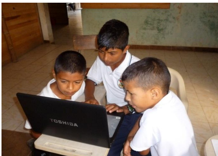
Imagen 7: Sistematización.