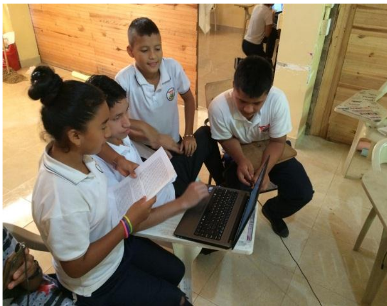
Imagen 8: Elaboración línea de tiempo. Archivo S.I. 2015.

que invitemos a los abuelos sería chévere poder mostrar lo que nos enseñaron”. [Bitácora 8 S.I. I.E.P.R. 2015].