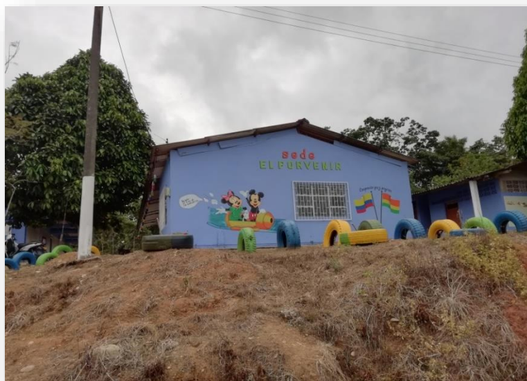
Fachada de la sede Porvenir San Pedro, Institución Educativa Maracaibo