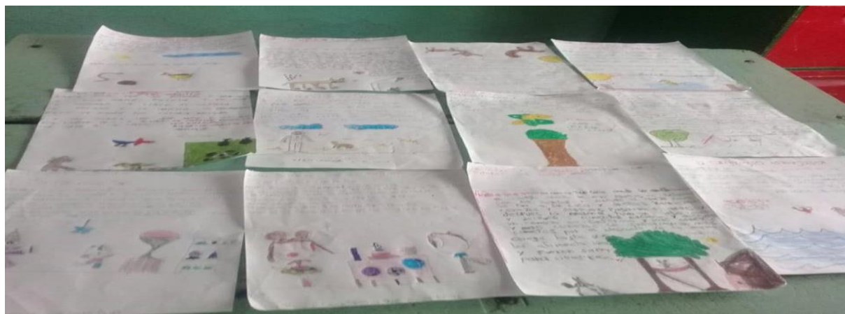
Figura2. Fabulas creadas por los estudiantes.

que ellos pudieran optimizar sus trabajos y realizar la decoración del mismo. Se pudo observar que todavía les falta por mejorar en la escritura, pero lo que mas se apreció fue la intención que cada grupo tuvo para ser partícipe y trabajar con entusiasmo en la actividad.