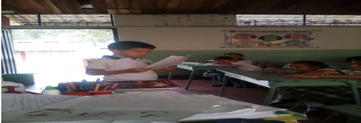
Figura3. Estudiante leyendo fabulada creada por el.