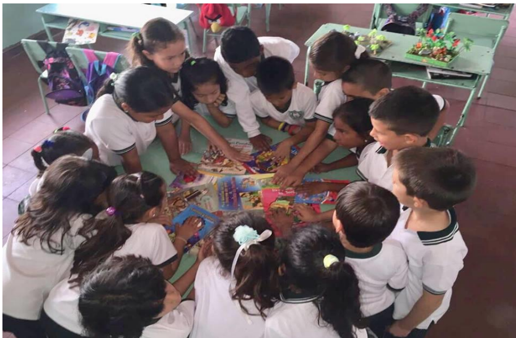
Lectura de Fábulas de Rafael Pombo