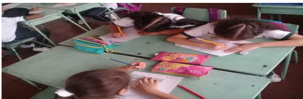
Figura6. Estudiantes creando fabulas.