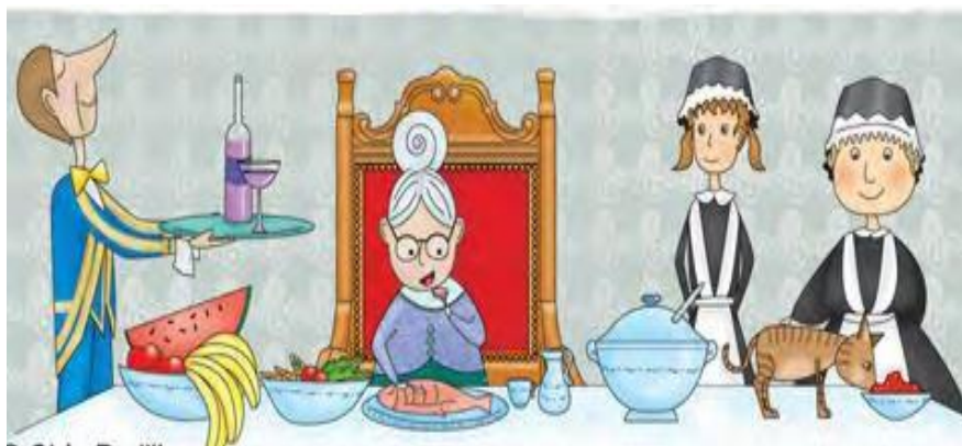
Figura 1. La pobre viejecita

Preguntas finales. Finalmente se pregunta: ¿qué enseñanza les dejó? Y qué otro final le darían a la historia. Con esta Fábula se trabaja varios encuentros.