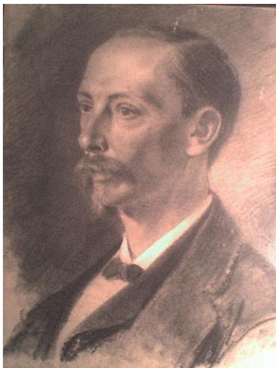
Figura1. Rafael Pombo.