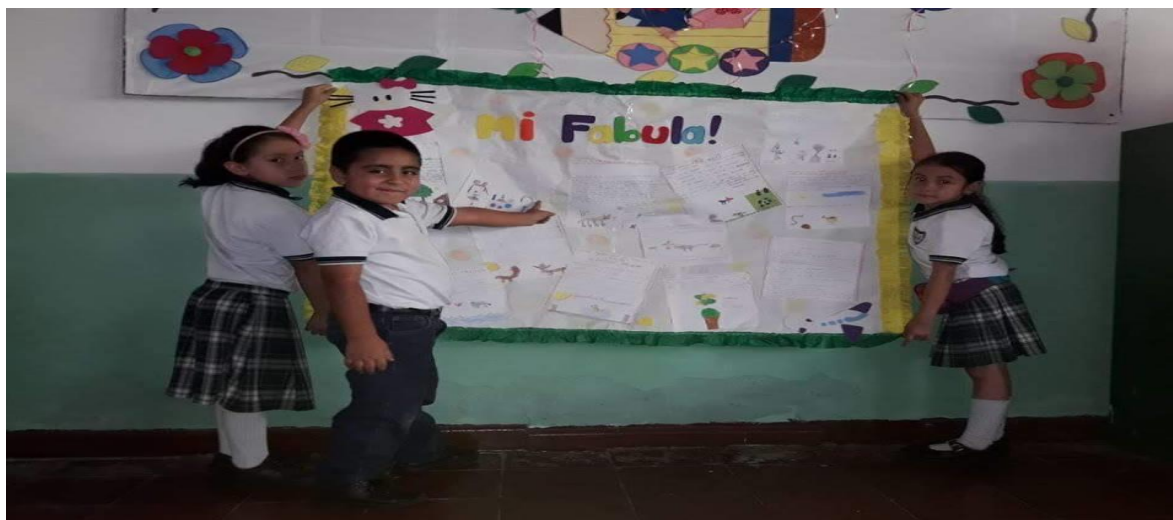
Figura4. Exhibición de fabulas creadas por niños.