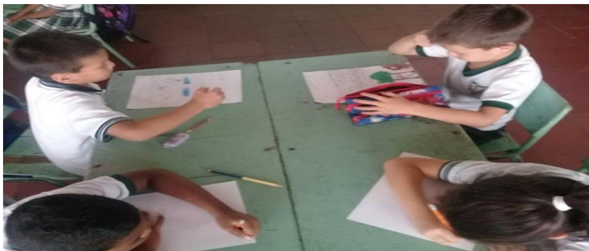
Figura5. Estudiantes creando fabulas.