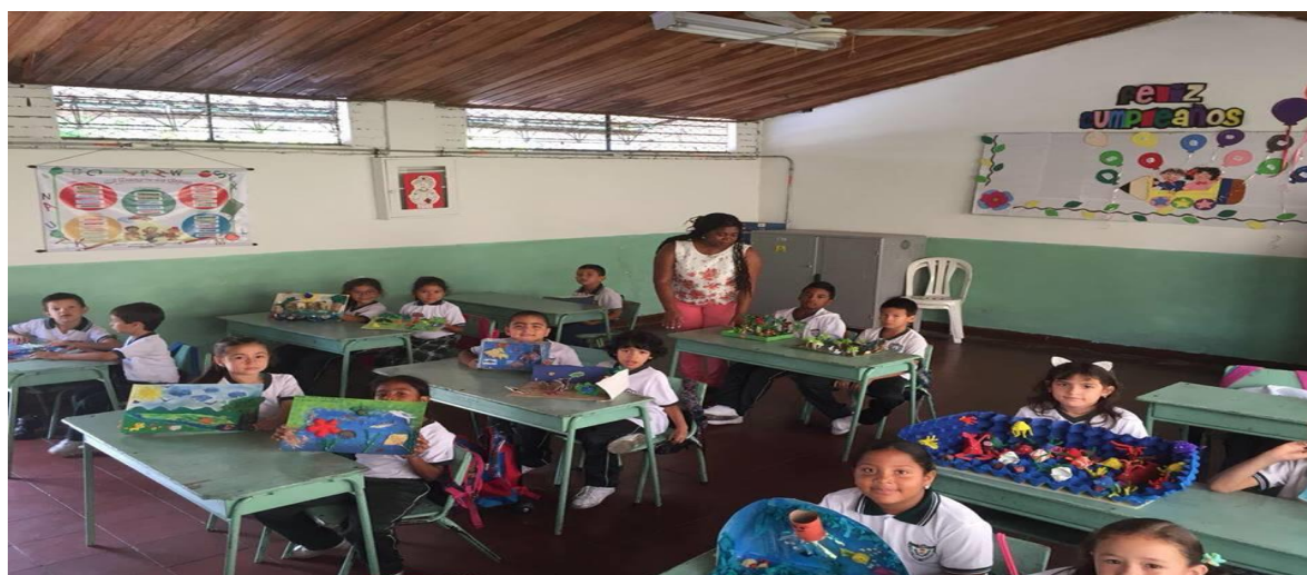
Figura7. Estudiantes creando fabulas.

El producto final de esta secuencia didáctica es inventar Fábulas para luego ser plasmadas en una Maqueta; generando así la comprensión lectora en el estudiante.