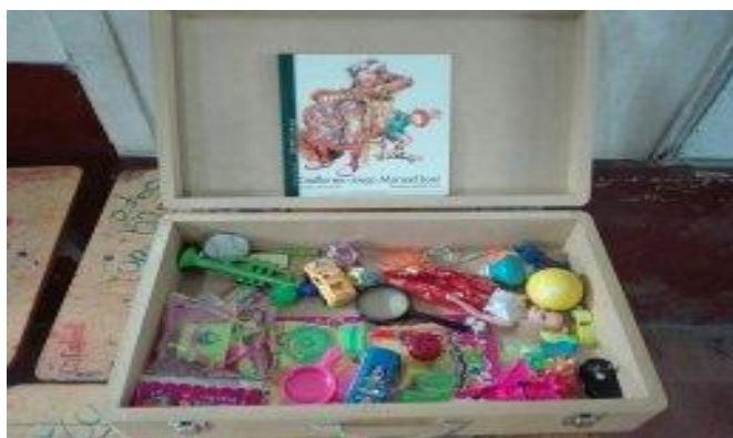
Imagen 3. Momento. 1 Maleta que despierta memoria . Autoría propia.

Esta sesión permitió a los estudiantes divertirse, luego de los relatos se permitió que ellos jugaran en grupo, a medida que la actividad se llevaba a cabo charlaron entre ellos y se contaban diferentes anécdotas que no fueron narradas en el conversatorio.