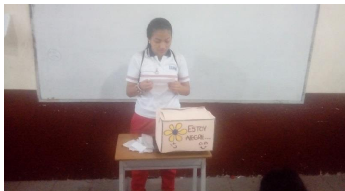
Imagen 6. Momento. 4. Cajas de mediación. Autoría propia

Sesión 12: elección de los mediadores y taller de formación de mediación: Se inicia la actividad con un conversatorio sobre las cualidades de un mediador. Entre todos se estableció unas características particulares y generales, posteriormente de manera democrática se estableció la elección de cuatro mediadores de conflictos. Algunos se propusieron y otros fueron propuestos, entre la lista de 10 estudiantes en lista para ser mediadores se estableció la elección de manera democrática. Los cuatro estudiantes elegidos asistieron a talleres de formación en mediación dirigido por la Orientadora de convivencia de la I.E. Los talleres se direccionaron en los siguientes aspectos.