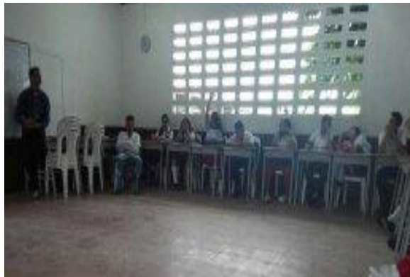
Imagen 2. Momento. 1 ¿qué es la memoria?

La memoria es aquella que nos permite a los seres humanos devolvemos al pasado.