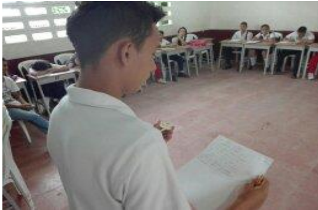
Imagen 4. Momento. 1 La otredad . Autoría propia.

A través de los relatos se identificó que varios niños desconocen a su padre biológico, la mayoría son hijos de madres cabeza de hogar, otros estudiantes relataron que sus madres los entregaron a los abuelos desde muy pequeños. El inicio de sus escritos evidencian que expresan con alegría sus primeros años de vida, sin embargo dejan entrever que a medida que fueron creciendo sus vidas se fueron ligando a situaciones violencia intrafamiliar, a desapego, a abandono, falta de reglas, problemas de drogadicción y alcoholismo en las familias, deserción escolar etc..