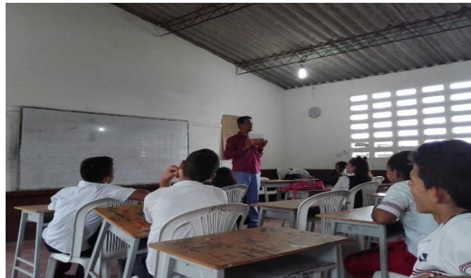
Imagen 5. Momento. 2. ¿cómo surgen los conflictos? . Autoría propia

La sesión inició con el análisis de la portada a partir de la pregunta ¿ De qué creen que trate el texto? , algunas respuestas fueron: de seis viejos tristes, seis soldados, seis cavernícolas,