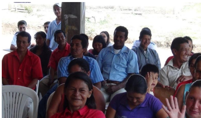
Fotografía 3 Minga pensamiento en la escuela El Caimito.

elemental en la toma de decisiones, en el fortalecimiento de valores comunitarios y en la construcción de los planes de vida comunitarios.