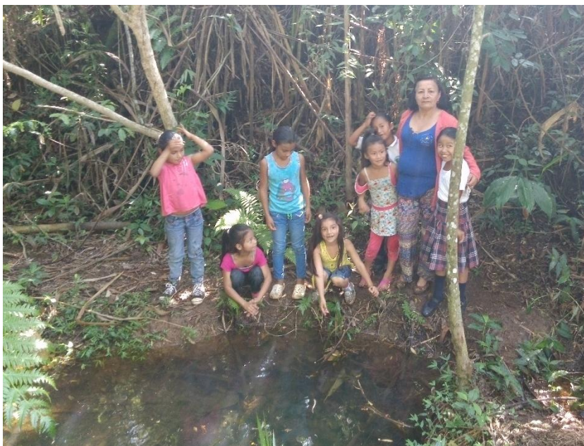
Fotografía 8 La maestra con los estudiantes en el sendero ecológico de la finca El Chontaduro.

En el año 2015 fue posible la formación técnica en producción agrícola con el SENA, donde hubo formación a estudiantes, estudiantes egresados, maestros y padres de familia. Fue un proceso de formación muy importante ya que aportó grandes conocimientos vitales en el proceso de enseñanza aprendizaje en relación al énfasis del colegio y en la producción más tecnificada y amigable con el medio ambiente.