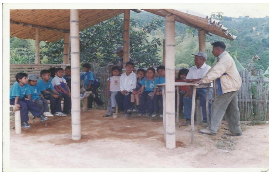
Fotografía 1 Educación Comunitaria.

La escuela bilingüe nació con el esfuerzo de la misma comunidad, de recuperar nuestra cultura. En el año 1980 el 18 de febrero, en la escuela habían niños que no podían ir almorzar a la casa, unos porque vivían muy lejos y otros porque a medio día no encontraban a nadie en su casa, los papás están trabajando en la roza. Además en la escuela estaban muy contentos y preferían quedarse en la escuela así tuvieran hambre. Discutimos esta situación en varias reuniones y decidimos crear el restaurante escolar, cada niño debía traer revuelto y una compañera de la comunidad nos colaboraba a cocinar así defendíamos el hambre. (Chepe, s.e, p. 22)