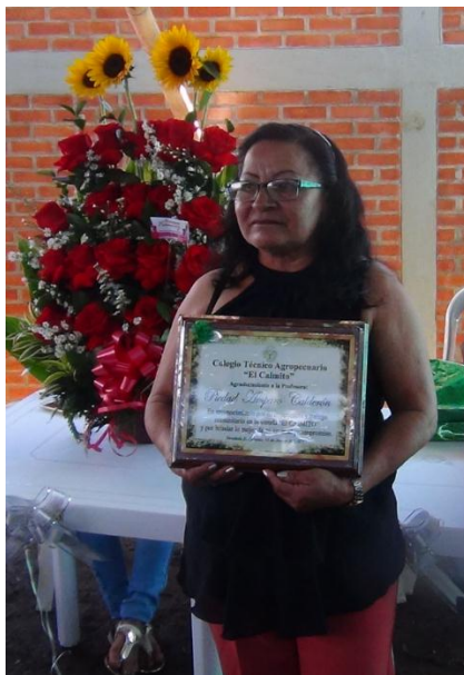
Fotografía 9 Evento de reconocimiento a la maestra por su trabajo popular y comunitario. Fuente: Juan Manuel Diago. 2017

A ella se le reconoció por tres décadas de entrega total a la misión tan importante de educar teniendo en cuenta las realidades de sus estudiantes y de la comunidad, por tener esa capacidad de dialogar y de democratizar la toma de decisiones con el objetivo de fortalecer la unidad y el trabajo comunitario, por promover el empoderamiento de la comunidad en situaciones difíciles y de gran tensión social pero que al final logran transformar a beneficio común y por sus aportes en la construcción de los planes de vida individuales y comunitarios siempre apuntando hacia la armonía y el equilibrio con la madre tierra,