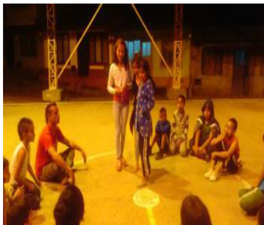
Imagen 1. Representación Teatral