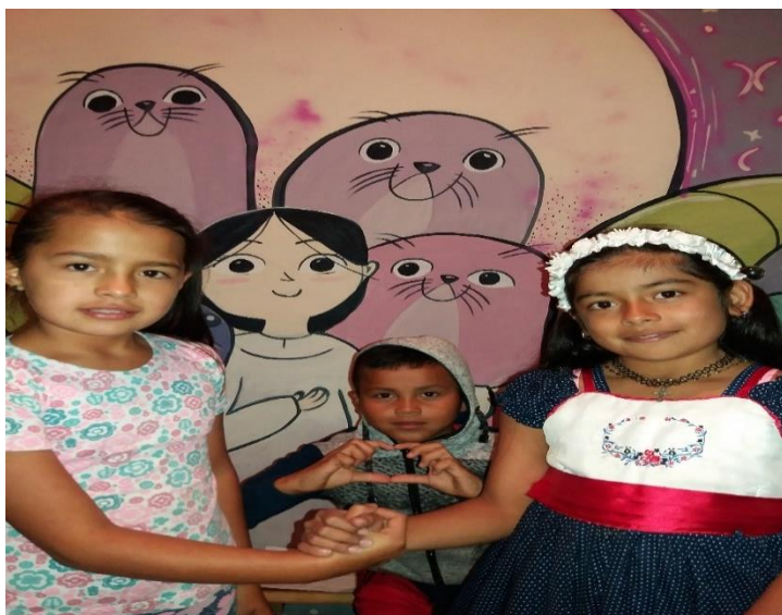
Imagen 13. Mensaje Teatro Imagen Grupo 2