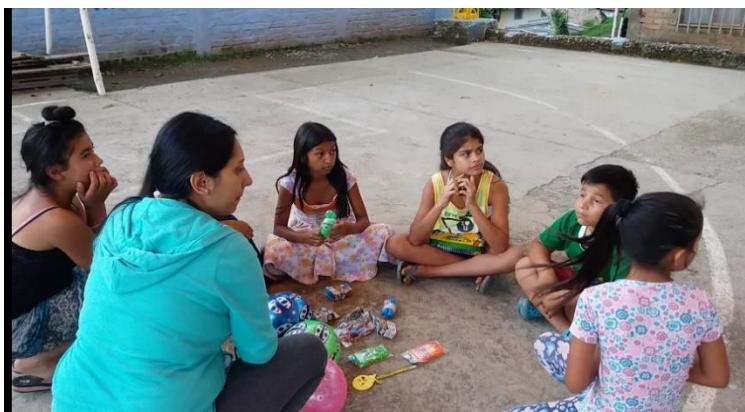
Imagen 11. Los Juguetes no tienen género

Otra adolescente manifiesta que no está bien escoger juguetes de niños porque le dicen que es una “marimacha” como a una niña de su colegio que juega con carros, motos y superhéroes. “Ella es brusca, fuerte, se parece a un hombre y juega con ellos”. Por esta razón manifiesta, que no desea ser como ella, porque las mujeres tienen juguetes muy distintos que los hombres.