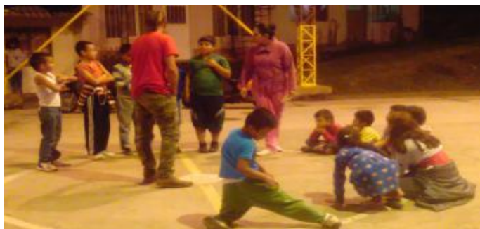
Imagen 3. Adolescentes Practicando Técnicas de movimiento corporal

Cada participante debe caminar durante 15 minutos por el espacio de la cancha primero de manera rápida, luego a una velocidad media y finalmente llegan a una velocidad cero. Mientras estén caminando deben hacer el sonido de un animal que desee. Luego debe realizar simultáneamente el sonido del animal y moverse como lo hace el animal que han elegido.