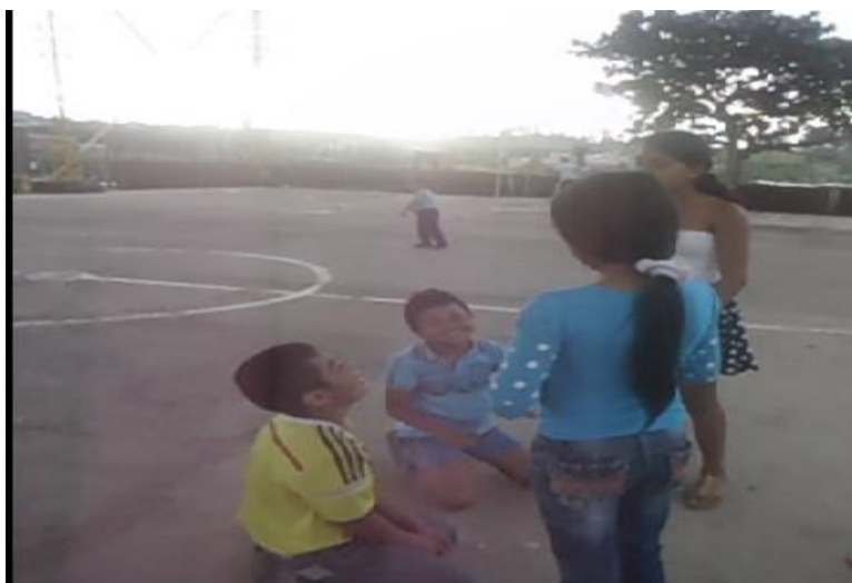
Imagen 8. Grupo 1 de Adolescentes Representando Acciones de Prevención

Los adolescentes se organizaron en cuatro grupos en donde empezaban a dramatizar una escena que desearan de manera grupal en donde se partía de las preguntas orientadoras: ¿Cómo dicen los demás que debo ser como mujer u hombre? ¿cómo deseo ser como mujer u hombre?