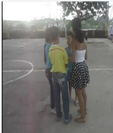
Imagen 9. Grupo 1 de Adolescentes Representando Acciones de Prevención