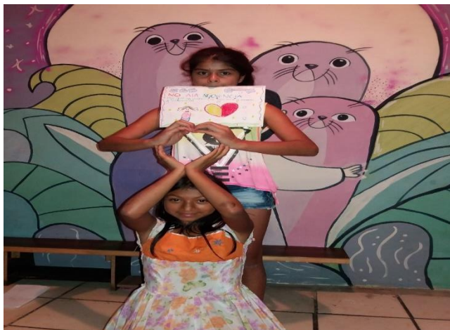
Imagen 12. Mensaje Teatro Imagen Grupo 1

Escoger alguno de ellos para nuestros juegos no significa que los niños seamos gays o las mujeres marimachas.