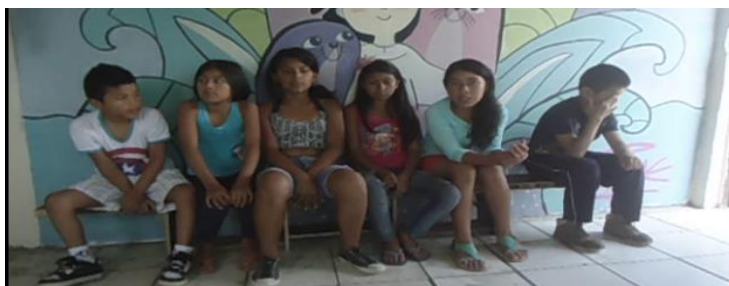
Imagen 5. Adolescentes Relatando sus Historias

Según los relatos de los y las adolescentes acerca de la violencia de género durante la actividad se hace evidente que detectan con gran facilidad este tipo de violencia, ya sea en las relaciones de pareja que han experimentado sus amistades, en los hogares en donde viven algunos de estos adolescentes, en su colegio o barrio. En algunos se hace notoria la inconformidad que sienten frente a las situaciones de violencia de las que han sido testigos o víctimas; dejando ver evidentemente, que existen según sus criterios, otras maneras de abordar dichos conflictos. Algunos de los relatos de los adolescentes son: