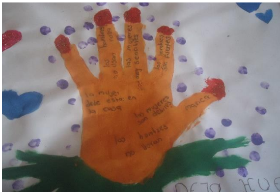
Imagen 7. Mensaje la Violencia Deja Huella