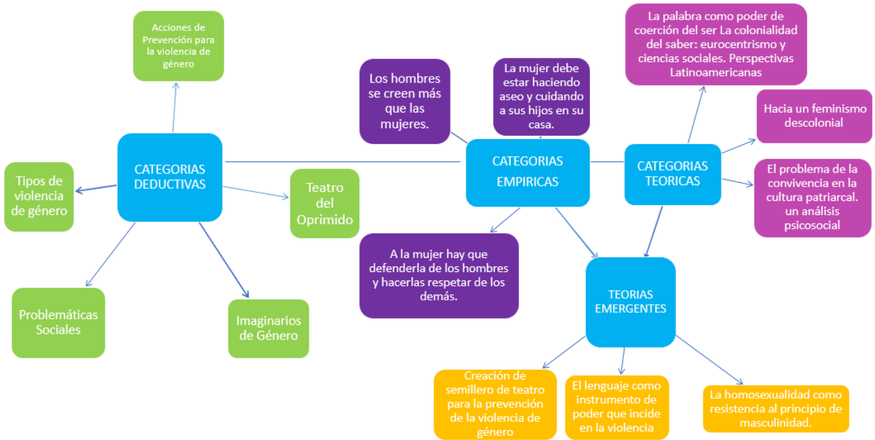
Figura 1. Mapa Categorial