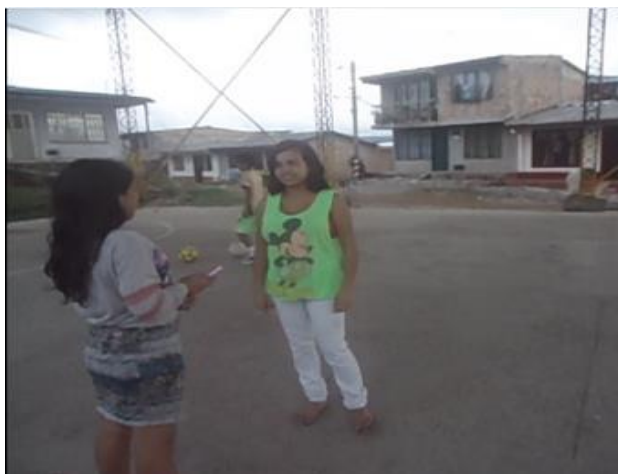
Imagen 10. Grupo 2 de Adolescentes Representando Acciones de Prevención

En la segunda escena queremos mostrar cómo nos vemos como mujeres: barriendo, trapeando, haciendo la comida, mandando a los hijos; y en la parte de los hombres, ellos jugando fútbol. En esta escena hay violencia física porque nosotros como mamás, los cogemos a los hijos de las orejas para que hagan caso.