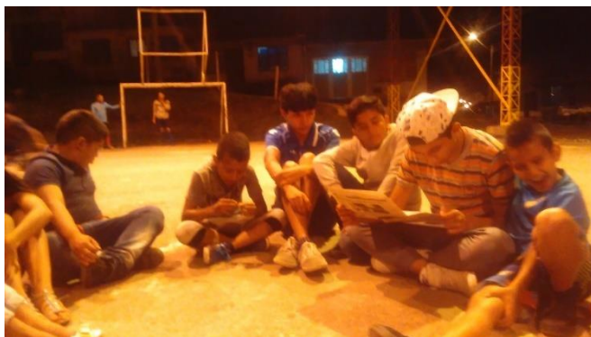
Imagen 4. Leyendo la Prensa

Entonces, se procedió a compartir esta noticia con el grupo de adolescentes, teniendo en cuenta que era propicia para acercarse de manera real a un caso específico de violencia de género. Se leyó por parte de uno de los adolescentes para ser escuchada por el resto del grupo y luego de manera voluntaria se hicieron algunas reflexiones acerca de la noticia por parte de los adolescentes: