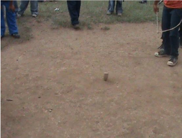
Figura 3 El trompo fuegado

Es primordial la labor con los niños y niñas en realizar estas prácticas, con la colaboración del dinamizador y del mayor sobre cómo elaborar cada uno de los juegos tradicionales, explorando el entorno, en conjunto aprenderemos las historias de cada juego.