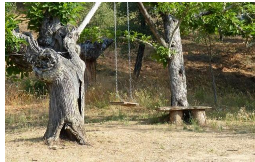
Figura 8 Columpios descargada de internet