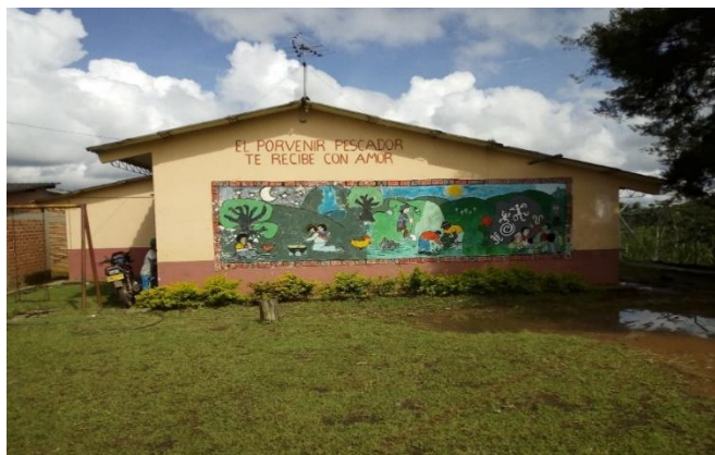
Figura 2 Escuela el Porvenir Pescador

En la sede educativa Porvenir Pescador existen dos (2) docentes distribuidos de la siguiente manera: dos docentes planta: uno con los grados de preescolar, primero y segundo y el segundo con los grados de tercero, cuarto y quinto. Los docentes que laboran en la sede tienen un sentido de pertenencia con la comunidad educativa.