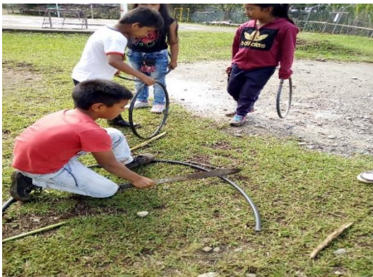
Figura 4 La rueda Fuente: Chepe, 2017

Para su construcción, es necesario reconocer su origen por parte de nuestros mayores, primero que todo se propone que cada estudiante traiga sus materiales que puede ser un palo de escoba o cualquier palo de nuestro alrededor y una manguera de tres o dos metros.