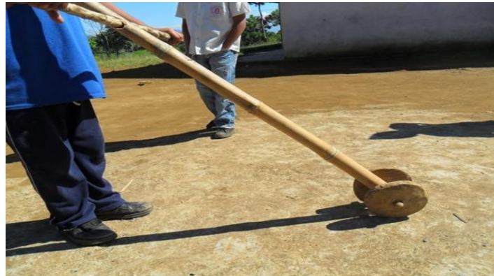
Figura 3 la carreta Fuente chepe, 2017

Los pasos para la construcción de la carreta son: 1. selección y consecución del trozo de madera; 2. Tallado de la madera para la rueda; 3. pulimiento y corte de los sobrantes de la madera. (Ver figura elaboración de la carreta).