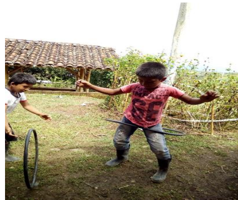
Figura 5 Giro de la rueda en la cintura

Procedemos a ir dándole forma a la rueda con la manguera en forma circular uniéndola con un pequeño palo en los extremos de cada lado; los niños estaban muy contentos realizando sus propios juegos ,algunos que no habían traído los materiales los mismos compañeros les facilitaron materiales que ellos habían llevado suficientes, se colaboraron muchos entre sí. Algunos estudiantes la utilizaron para jugar con ella de otra forma como hacerla girar en la cintura otros para lanzar hacia arriba y que pasara por dentro de ellos,