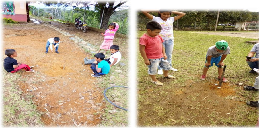
Figura 6 El palmo