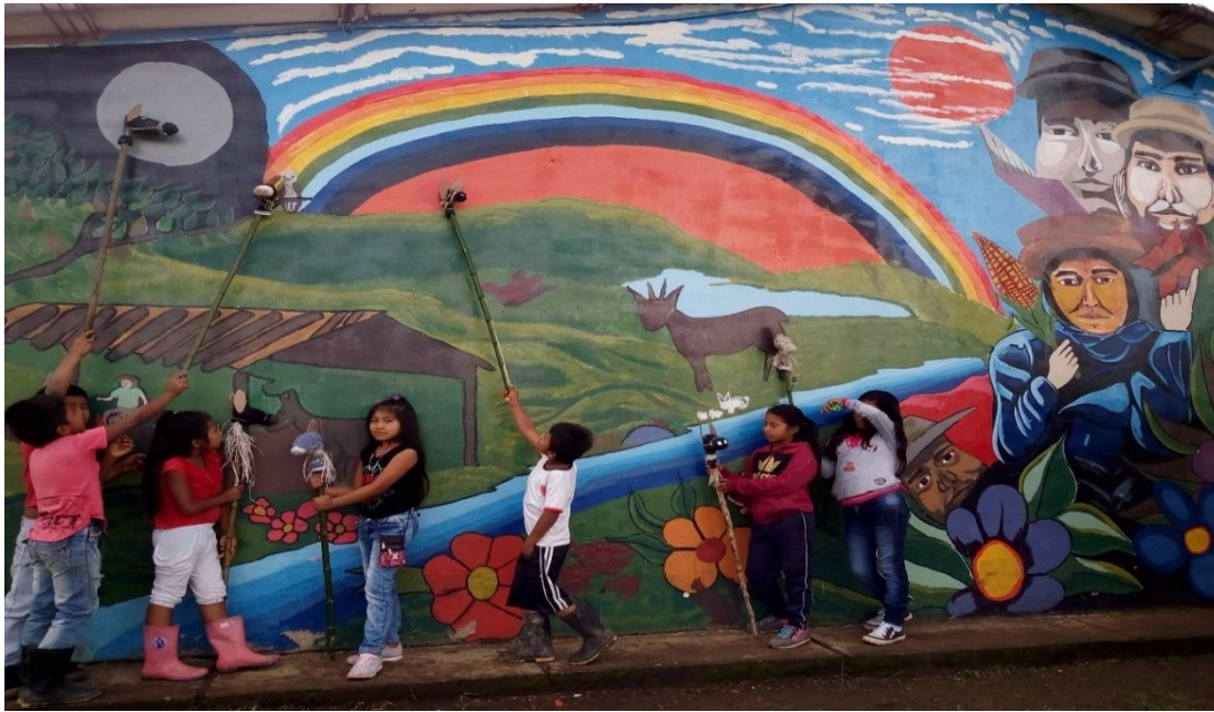
Figura 7 El Caballito de palo

Jugando con el caballito alrededor del centro educativo el porvenir pescador, realizando competencias entre ellos, y desde el día que lo hicieron se lo llevan para la casa y lo vuelven atraer montados en sus caballos también lo utilizan en las horas del recreo jugando y lo comparten con algunos niños de primero y pre escolar, ellos no creen que fueron capaz de hacer su caballito con sus propias manos están muy contentos hasta uno de ellos propuso que le colocáramos nombres a sus caballitos unos se llaman: morocho, palomo ,mariposa etc. ,cada uno le puso como quisiera en este mural.