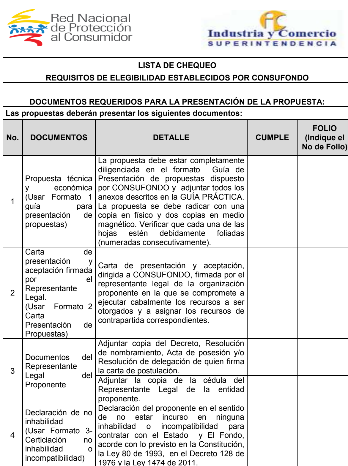
Tabla 3. Lista de chequeo