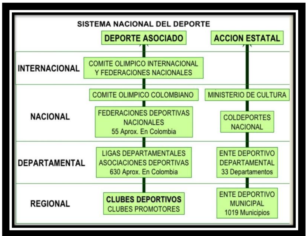
Ilustración 1 “Sistema Nacional del Deporte Colombiano”