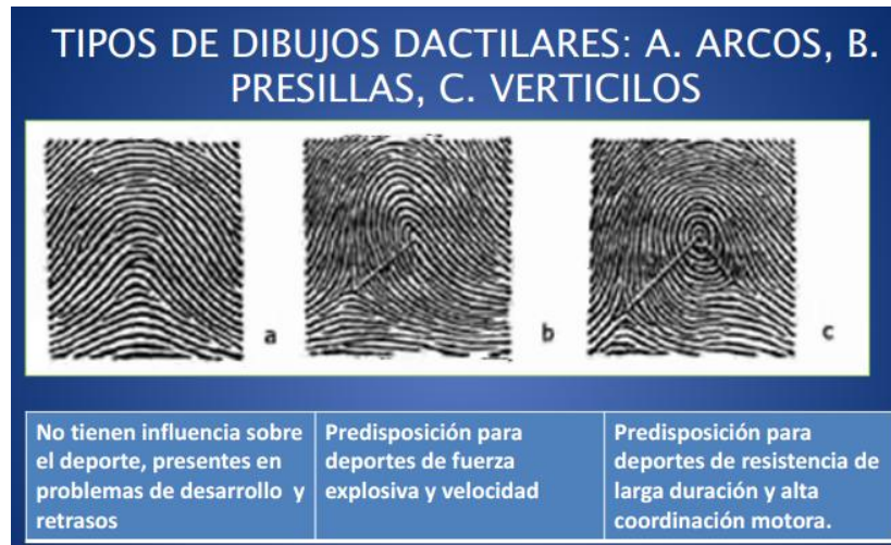
Ilustración 19 "Tipos de Dibujos Dactilares"

Fuente: Harold Cummins y Charles Midlo, publican en 1942 "Palmar and plantar Dermatoglyphics in primates",