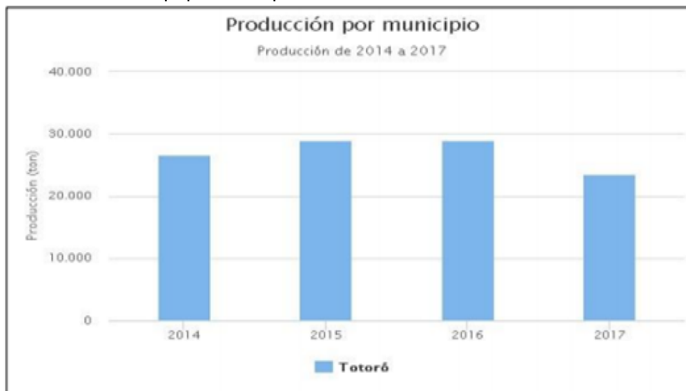
Figura 3. Producción de papa municipio Totoró 2014-2017

Fuente: Ministerio de Agricultura y Desarrollo Rural.