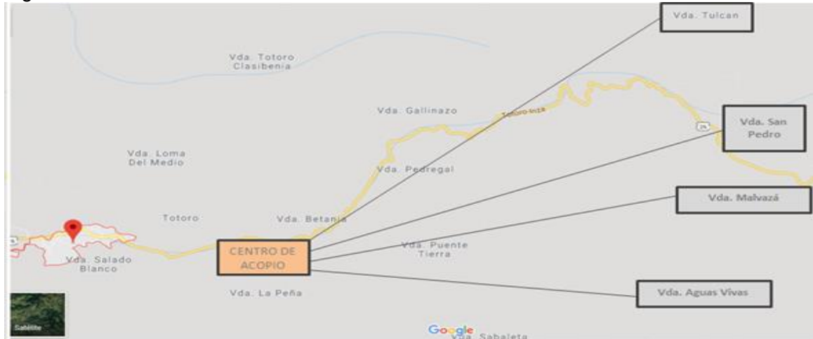
Figura 2. Micro localización