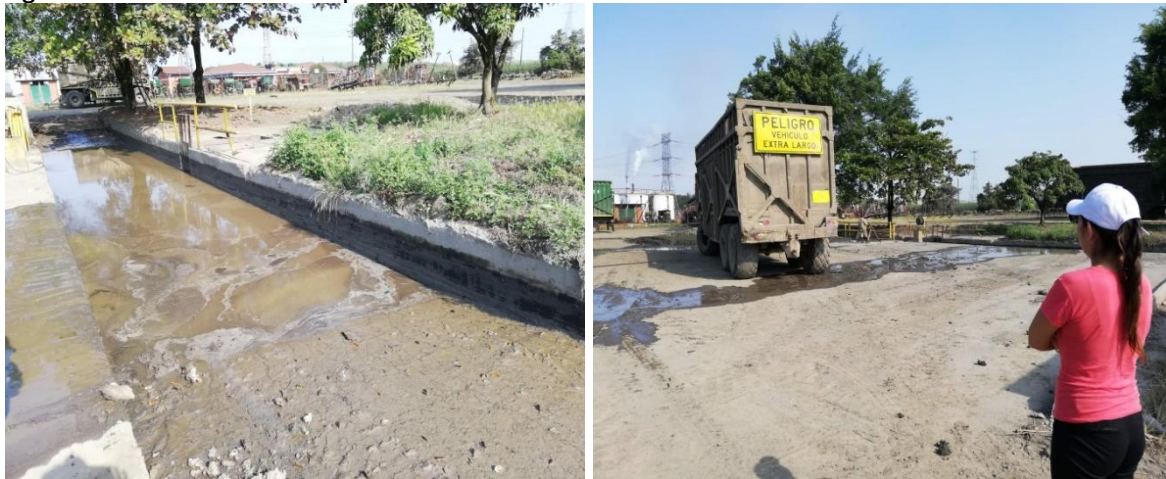
Figura 4. Lavadero de maquinaria

3.1.8 Reparación de maquinaria. El valor de la importancia del impacto obtenido para esta labor fue de menos veinte (-20), un valor que se clasifica como impacto moderado, cuyo resultado se obtuvo al calificar la variable afectada suelo.