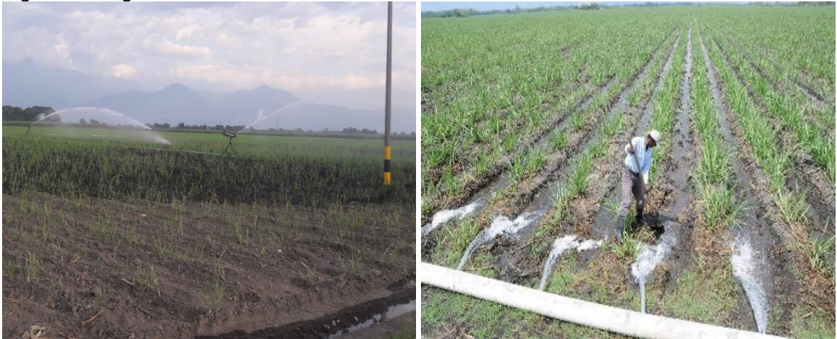
Figura 3. Riego

3.1.3 Laboratorio de suelos. El valor de la importancia del impacto obtenido para esta labor fue de menos veintiuno (-21), un valor que se clasifica como impacto irrelevante, cuyo resultado se obtuvo al calificar la variable afectada agua .