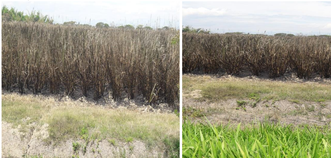
Figura 5. Quema

3.1.6 Corte, alce y transporte. El valor de la importancia del impacto obtenido para esta labor fue de menos veintisiete (-27), un valor que se clasifica como impacto moderado, cuyo resultado se obtuvo al calificar la variable afectada suelo y población .