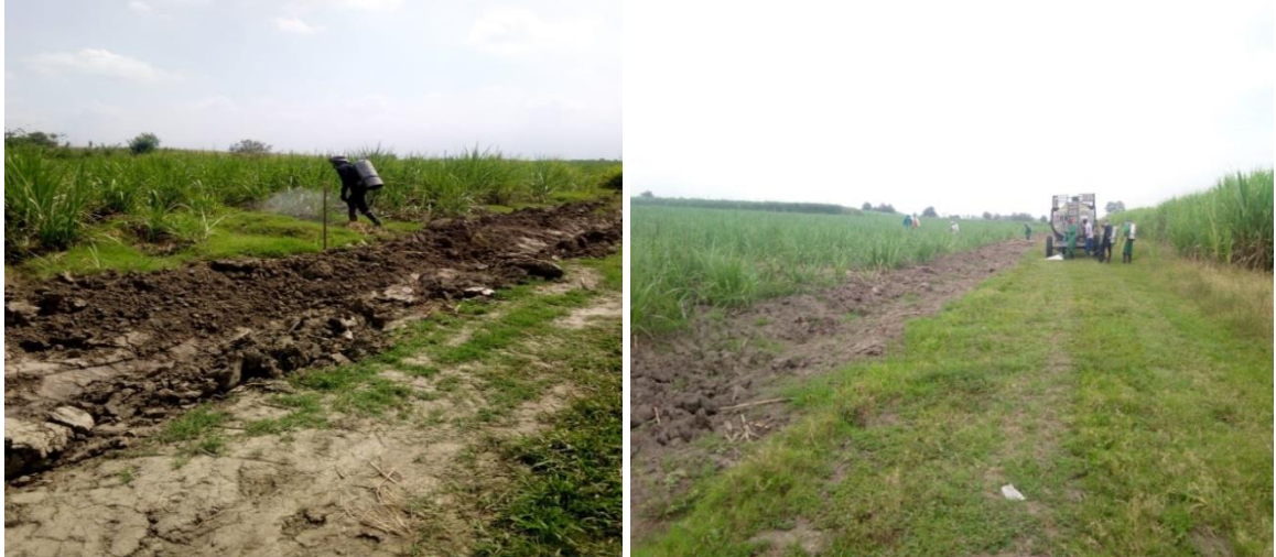
Figura 2. Aplicación de herbicidas

3.1.2 Riego. El valor de la importancia del impacto obtenido para esta labor fue de menos cuarenta (-21), un valor que se clasifica como impacto irrelevante, cuyo resultado se obtuvo al calificar la variable afectada agua .