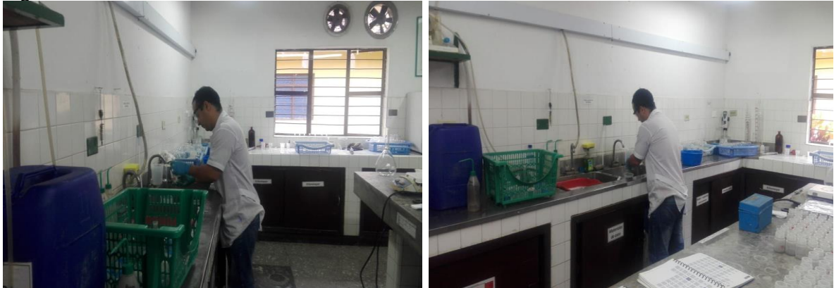
Figura 3. Lavado de laboratorio

3.1.4 Elaboración de compost. El valor de la importancia del impacto obtenido para esta labor fue de menos dieciocho (-18), un valor que se clasifica como impacto irrelevante, cuyo resultado se obtuvo al calificar la variable afectada población .