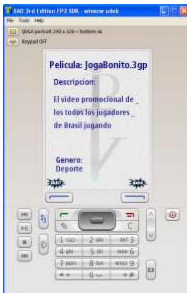
Ilustración 9. Descripción del Contenido Multimedia