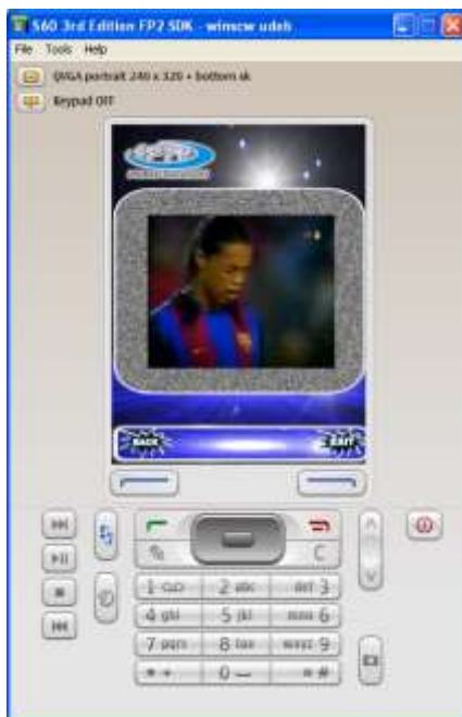
Ilustración 10. Reproducción de IPTV Móvil a la Carta