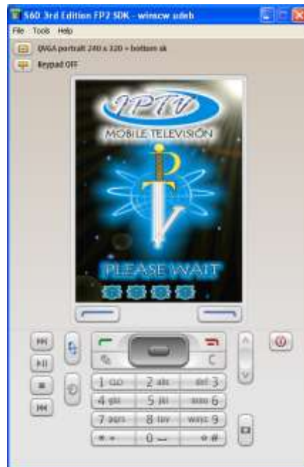
Ilustración 1. Pantalla de Inicio IPTV Móvil