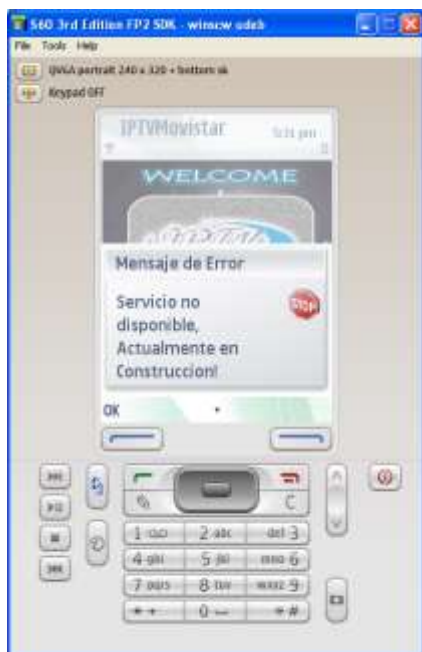
Ilustración 4. Servicio de IPTV Móvil en Vivo

donde se especifica que el servicio se encuentra en construcción, por lo cual no es posible hacer uso de él.