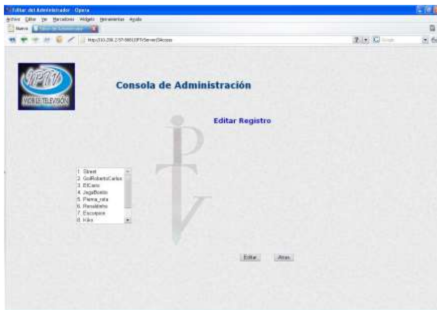
Ilustración 18. Pantalla de Edición de Contenidos