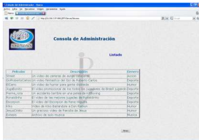
Ilustraci6n 14. Pantalla del Listado de los Contenidos