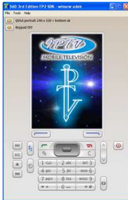
Ilustración 2. Logo de IPTV Móvil