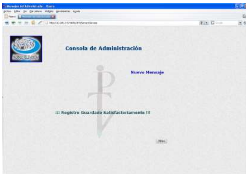
Ilustración 20. Pantalla de Proceso Exitoso