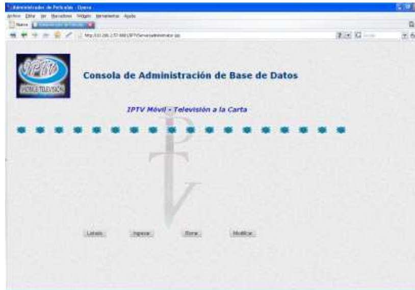
Ilustraci6n 13. Consola de Administraci6n del Sistema