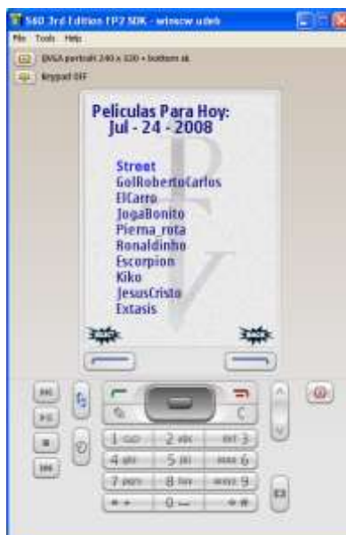
Ilustración 8. Guía Interactiva