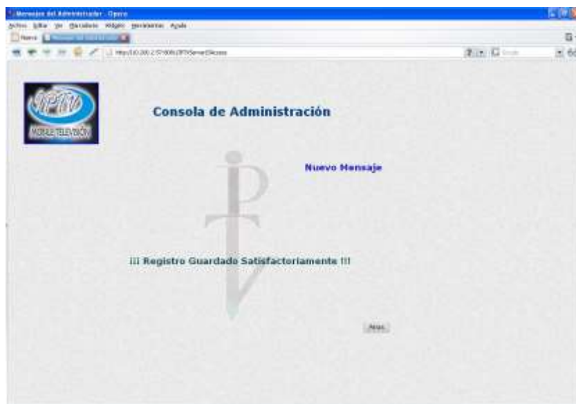
Ilustración 16. Pantalla de Mensajes