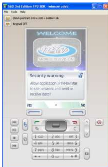
Ilustración 7. Permiso para Conexión de IPTV Móvil