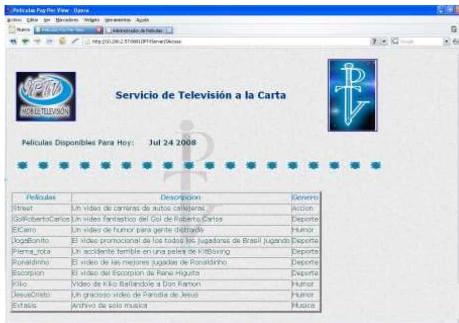
Ilustración 12. Lista de los Contenidos Ofrecidos

Al pedir la guía interactiva del día, el browser pide al servidor Web la lista de los contenidos con la debida descripción de los mismos. En una nueva pantalla es mostrada una tabla con el nombre de cada contenido, la descripción y el género del mismo, además permite al usuario volver a la pantalla de inicio.