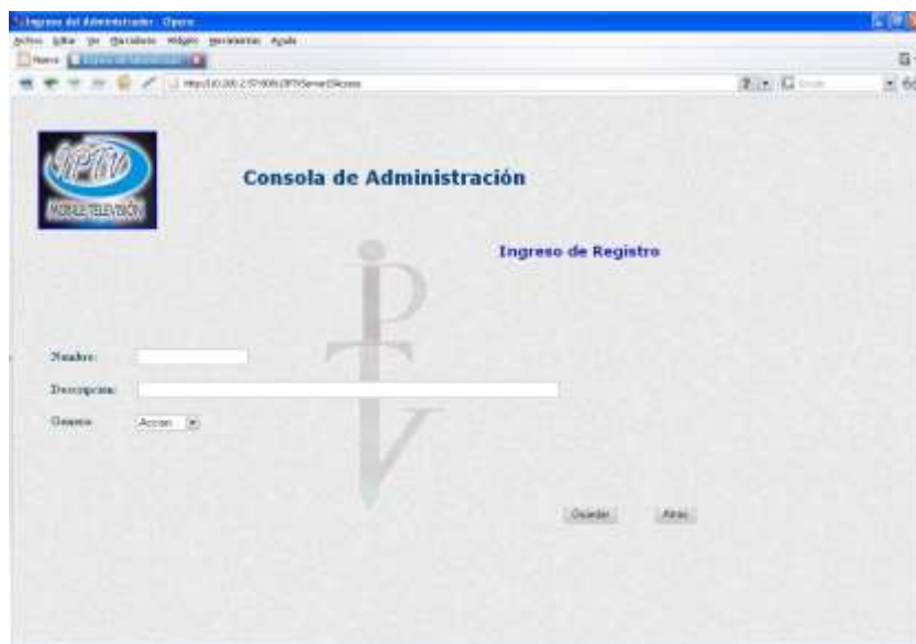
Ilustración 15. Pantalla de Ingreso de Nuevo Contenido