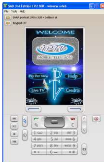
Ilustración 3. Menú de IPTV Móvil