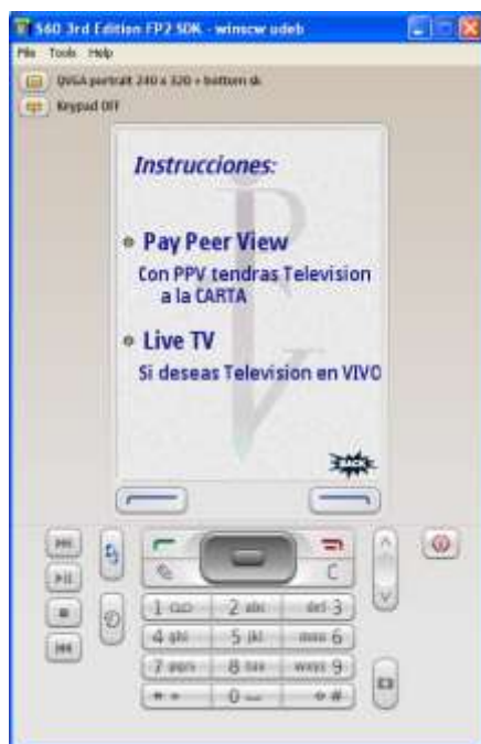
Ilustración 5. Ayuda en IPTV Móvil