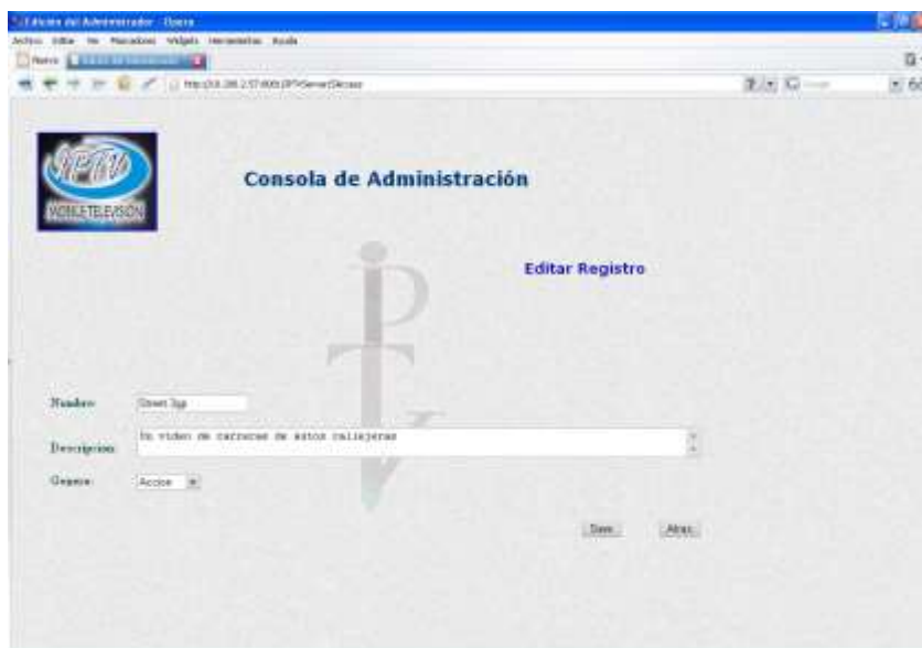
Ilustración 19. Pantalla de Modificación de Contenidos