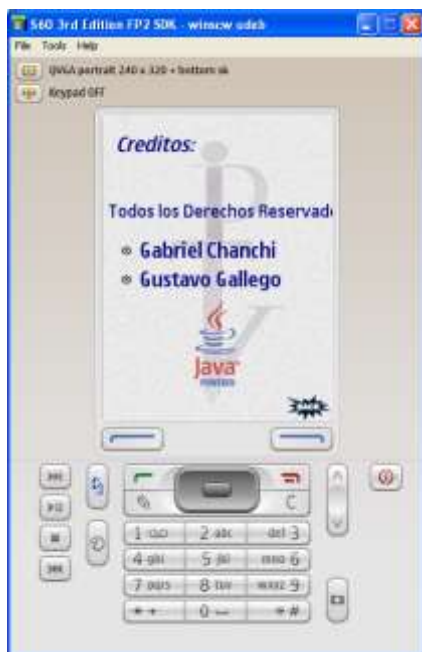
Ilustración 6. Créditos de IPTV Móvil