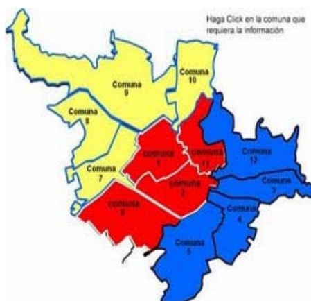
Imagen 2: Comunas Municipio de Pasto

Su capital es San Juan de Pasto, municipio situado en medio de la cordillera de los Andes en el macizo montañoso denominado nudo de los Pastos; denominado valle de Atriz, al pie del volcán Galeras y a su vez muy cercano a la línea del ecuador. El territorio municipal tiene en total 1181 km 2 de superficie, de los cuales el área urbana consta de 14,7 km 2 . La ciudad está dividida en 12 comunas; El área rural está compuesta por 17 corregimientos, La población total del municipio (urbana y rural) estimada, según datos de la proyección del DANE, es 411 706 habitantes.