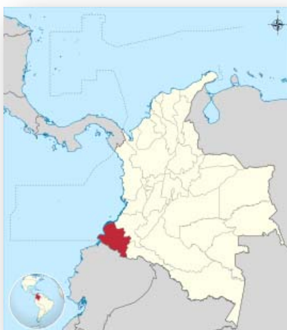
Imagen 1: Posición geográfica de Colombia y Departamento de Nariño

Esta investigación se lleva a cabo en Colombia, país ubicado en la esquina noreste de América del Sur; en el Departamento de Nariño situado al sur del país entre las regiones Andina y Pacífica.