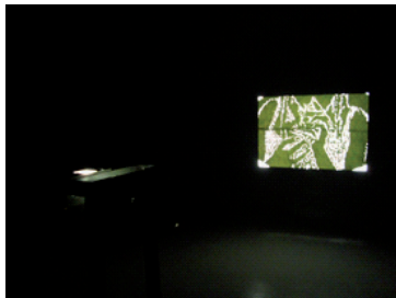
Titulo: “Inhale” Hoja de coca perforada Dimensiones variables