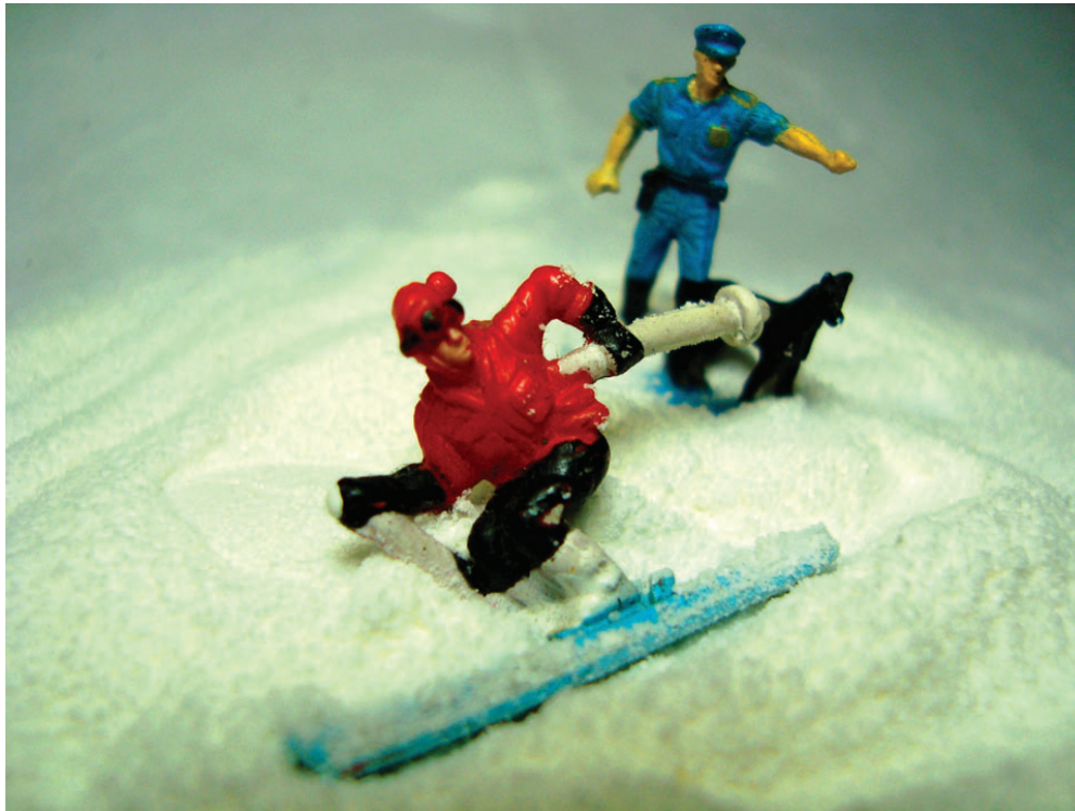
De la serie Trabajo con las Uñas-Paisajes Escamosos “Policía norteamericano con perro antidrogas” Fotografía Digital 100 x70 cm

En la fotografía se presentan tres personajes: un policía, un perro y un gringo esquiando, cada uno ellos tienen un significado dentro de la foto.