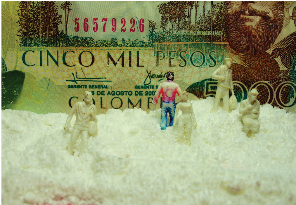
De la serie Trabajo con las Uñas-Paisajes Escamosos “Un Gramo Colombiano” Fotografía Digital 100 x70 cm

“...Y la luna llena Por los cielos azulosos, Infinitos y profundos esparcía su luz blanca, Y tu sombra Fina y lánguida, Y mi sombra Por los rayos de la luna proyectadas, Sobre las arenas tristes De la senda se juntaban, Y eran una, Y eran una, Y eran una sola sombra larga...”