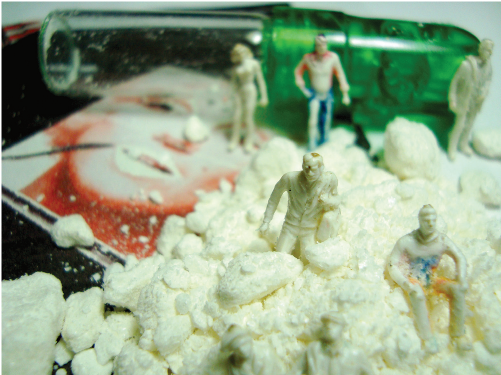
De la serie Trabajo con las Uñas-Paisajes Escamosos “la cocaína de Oiticica era Colombiana” Fotografía Digital 100 x70 cm