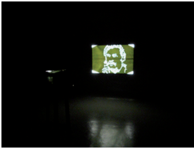
Titulo: “El Patrón” Hoja de coca perforada Dimensiones variables

La hoja de coca dentro de nuestra realidad es considerada como maldita y esto se debe a la influencia ejercida por los medios de comunicación que a diario bombardean nuestro pensamiento, presentando a la planta de coca como peligrosa, algunas veces olvidándose que existe una gran diferencia entre la hoja de coca y la cocaína.