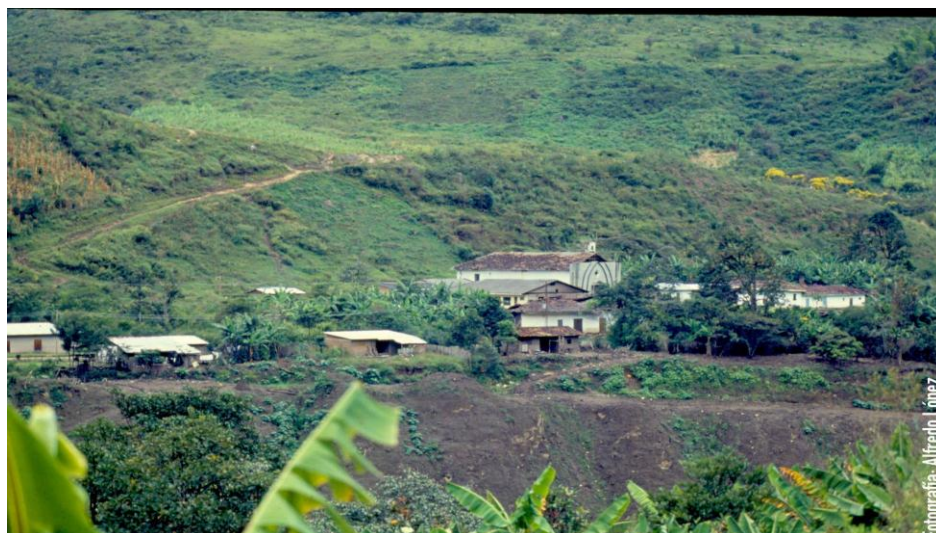
Foto 8: Vereda de Tálaga antes de la tragedia del 6 de Junio de 1994, se puede observar el templo.