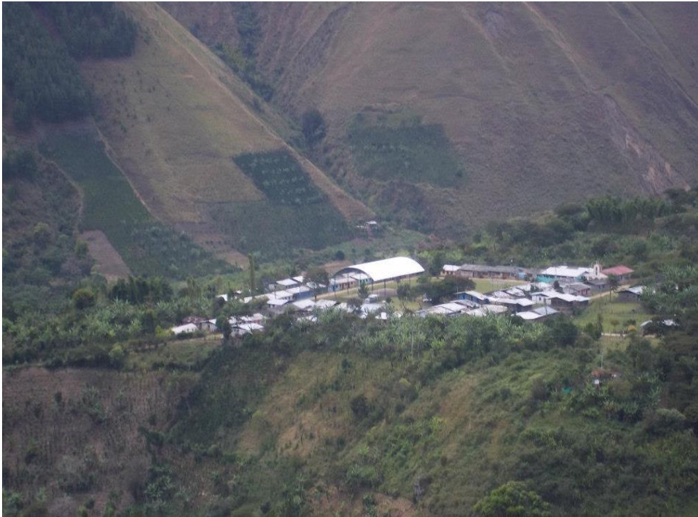
Foto1: Vereda, Tálaga Centro