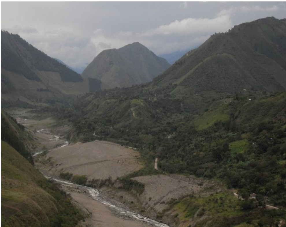
Foto 7: Vertiente del río Páez, donde se observa Tálaga viejo y Tálaga nuevo