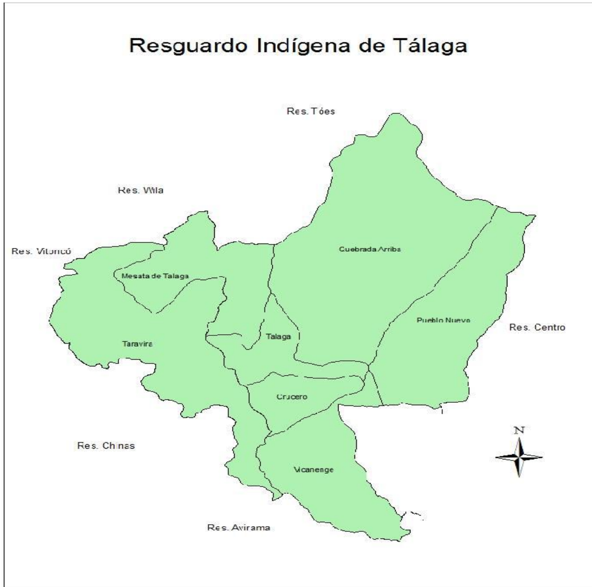
Mapa N° 2: Veredas del resguardo de Tálaga.

Meneses, 2000: 96); Escobar también menciona que Tálaga significa guitarra (Tala) en Nasa Yuwe , ya que desde la vereda de Taravira es vista así (Escobar, 2013: 54).