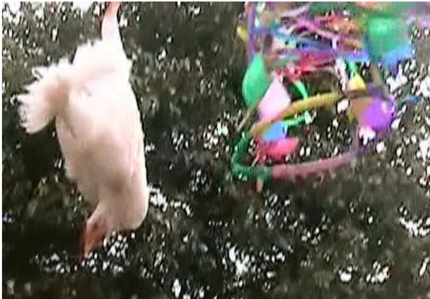
Foto 34: La colgada de la jaula para quien quiera recibir la fiesta.

La entrega de la jaula es responsabilidad del fiestero quien hace entrega al que recibe (ver foto 35), este evento tiene una responsabilidad muy grande ya que debe realizar la fiesta el siguiente año.