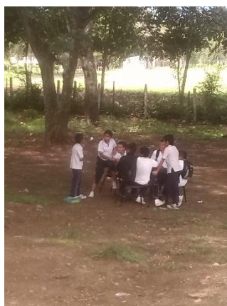
Ilustración 33 Unión del grupo en torno al dialogo