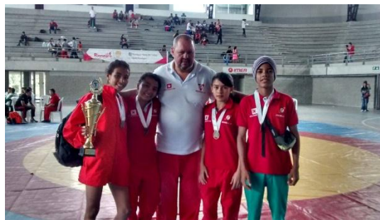
Ilustración 31 Grupo de Lucha Olímpica