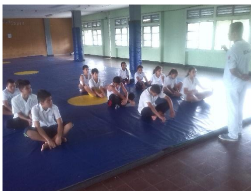
Ilustración 32 Grupo de Hapkido