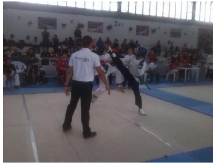
Ilustración 34 Motivación para ganar