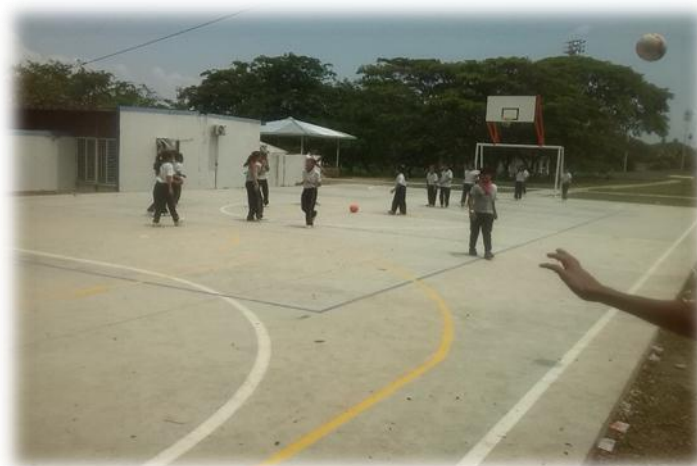
Ilustración 11 de salón