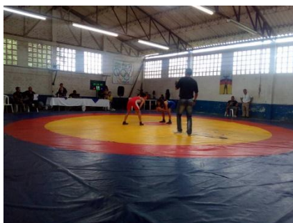
Ilustración 29 Interacción