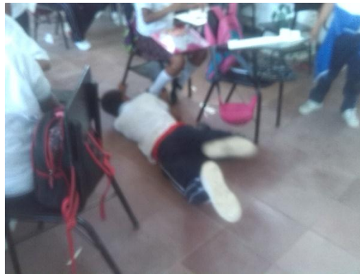
Tendencias agresivas proyecto