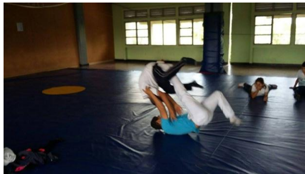
Ilustración 35 Observación y aprendizaje del Hapkido