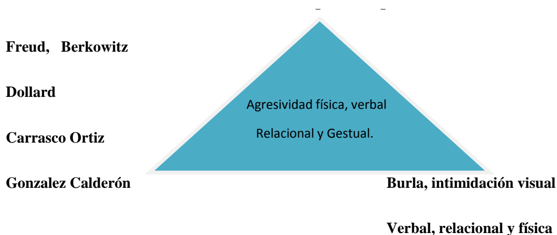
Ilustración 1 Triangulación diagnóstica de la fase de planificación (Freud, 1973)

anexo 1), informándose a la población escolar intervenida, padres de familia y directivos de la Institución educativa el propósito del proyecto, para posteriormente iniciar la intervención mediante práctica de deportes de combate (Lucha Olímpica) y artes marciales (Hapkido).