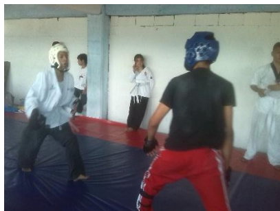
Ilustración 28 Interacción