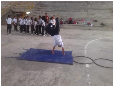
Ilustración 19 Educación