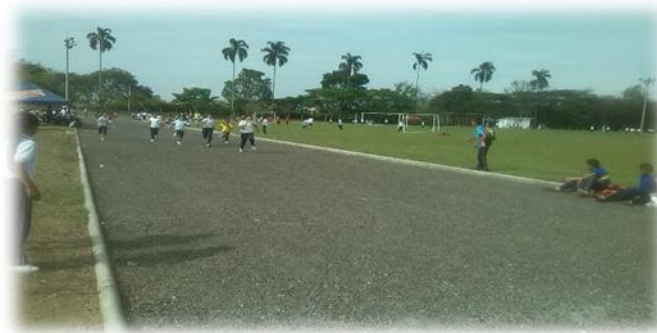
Ilustración 10 fútbol sala