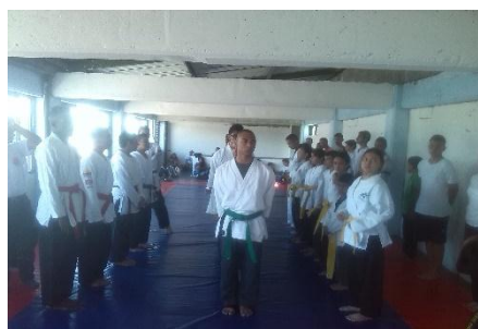
Ilustración 30 Conocimiento de