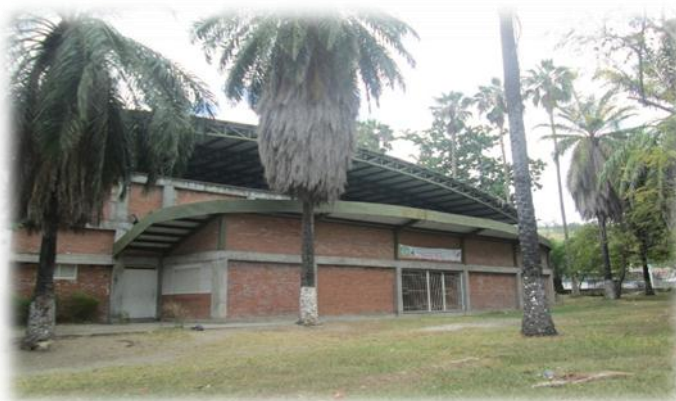
Coliseo cubierto de del proyecto