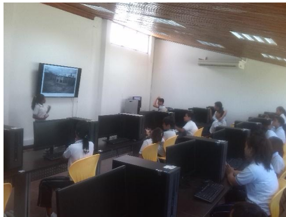
Ilustración 41 Apoyo entre compañeros