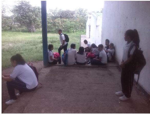
Ilustración 40 Unión grupal