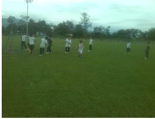
fútbol y pista atlética

Evidencias fotográficas de las fases y sub fases del proyecto