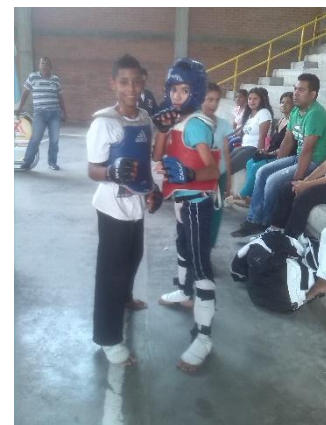
Ilustración 36 Competición en lucha Olímpica y Hapkido ¡Vamos a ganar!