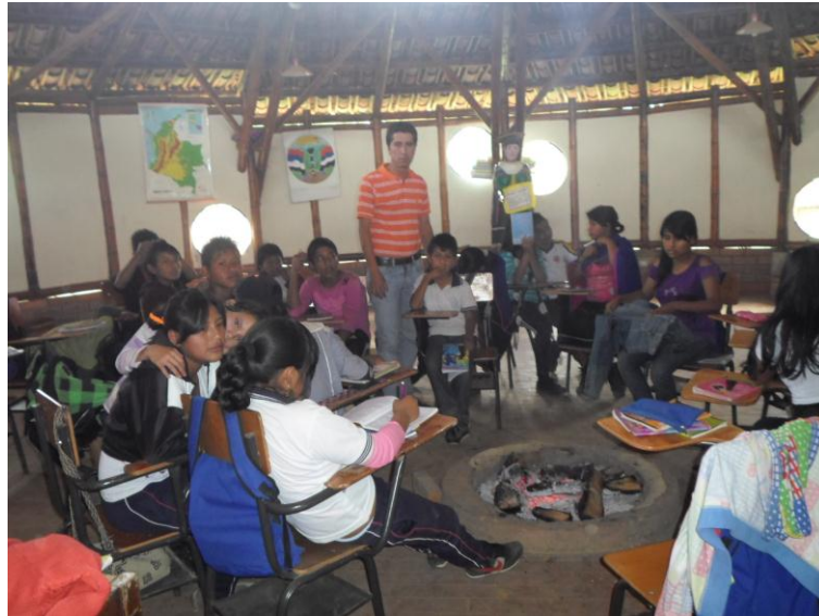
Foto 20. Minga de pensamiento con estudiantes alrededor del fogón Autor: Juan Pablo Perafán 2013

Uno de los conceptos sobre los cuales se hace más referencia desde la etnoeducación, es el de cultura, la cual no voy a definir en este texto, por la complejidad y diversas concepciones que sobre ella existen, sin embargo, debo aceptar que uno de los principales retos que tenemos los etnoeducadores es precisamente ser dinamizadores de la diversidad cultural, por lo que tenemos que asumir la responsabilidad al estar en el interior de un grupo cultural, de investigar y conocer de cerca sus valores culturales para contextualizar nuestros procesos de enseñanza.