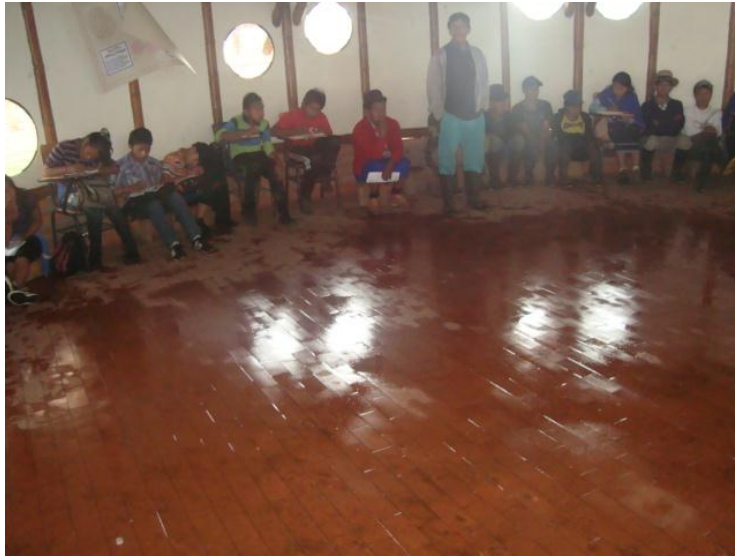
Foto 15.Minga de pensamiento con los padres de familia y estudiantes de sexto y séptimo Autor: Juan Pablo Perafán 2013

la luna en los cultivos. Cada una de estas inquietudes iban siendo resueltas por los padres de familia asistentes, donde la mayoría expresaba sus opiniones.