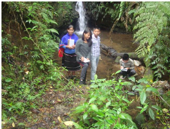
Foto 17. Compartiendo saberes en la salida de campo 2013

indígena, tratando de tener en cuenta la concepción Misak, y la de los Nasa. Se retomó un aspecto sobre el cual habíamos charlado antes acerca de la forma como se concibe la naturaleza desde los dos pensamientos, el local y el occidental, tocando brevemente el aspecto ambiental.