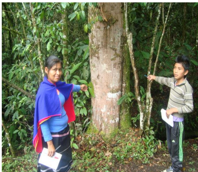
Foto 16. Recorrido ecológico con estudiantes de grado séptimo Autor: Juan Pablo Perafán 2013

Antes de iniciar el recorrido, se hizo una revisión teórica con ayuda de videos y de lecturas sobre el concepto de ecosistema y todo lo que tiene que ver con los factores bióticos y abióticos, dichos conceptos manejados desde el conocimiento occidental, pero que bajo el propósito de articular saberes, considere oportuno revisarlos.