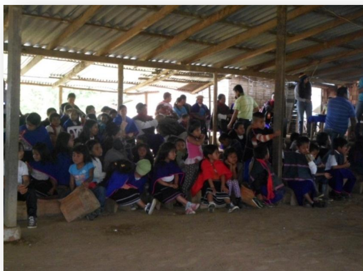
Foto 11. Actividades culturales de la institución educativa 2013

Debo manifestar igualmente, que en estos primeros espacios de interacción con los estudiantes, se tocaron diversos temas, un poco más relacionados con su cultura y la forma de pensar de ellos frente algunas situaciones en particular, como el uso del vestido propio, el Namui Wam, la medicina tradicional, el Ya tul, la madre tierra, entre otros. Todo ellos abordados de una manera muy general pero que dejaron entrever un gran conocimiento por parte de los estudiantes frente a los mismos.