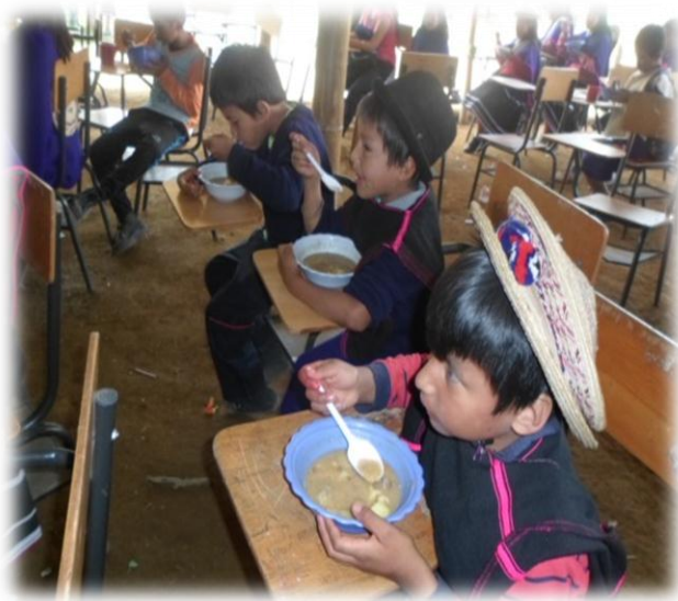
Foto 8. Niños Misak, estudiantes de la institución.