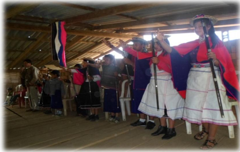
Foto 9. Acto de posesión del Cabildo Escolar