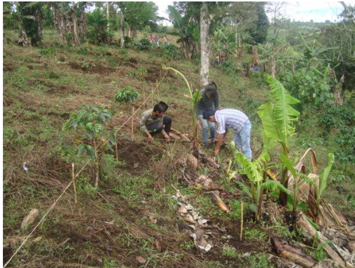
Foto 13. Sistema de trazado para sembrar café Autor: Juan Pablo Perafán 2013

Este proceso inicia desde la preparación del terreno hasta su siembra, y en cada una de las etapas se incorporó en su práctica los conceptos trabajados. Por ejemplo, para el concepto de área, se sacó en conjunto con los estudiantes el área del lote donde iba a quedar sembrado el café, lo mismo que la utilización del metro para medir la longitud entre cada árbol, a la vez que se utilizó en el proceso de trazo y ahoyado, ya que se manejaron distancias y medidas de profundidad y ancho en los huecos. Por otra parte, se trabaja el tema de suelo y sus distintas clases, dialogando un poco sobre el uso que se le ha dado desde la parte agrícola, comentando y reflexionando sobre la utilización desbordada de abonos químicos y la necesidad de aplicar abonos orgánicos.