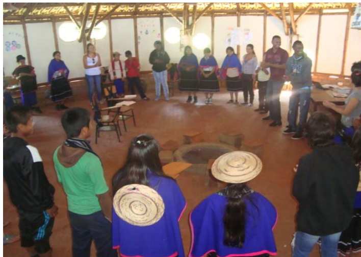
Foto 19. Actividades lúdicas con estudiantes de sexto grado Autor: Juan Pablo Perafán 2013

Otro aspecto que considero importante no pasar por alto, es el que tiene que ver con el desarrollo de actividades lúdicas en las clases, ya que es innegable el aporte que estas pueden ofrecer en el proceso educativo. Aquí, debo reconocer, que se encuentra una de mis debilidades como docente, pues el poco manejo de recursos lúdicos y didácticos han generado grandes tensiones en mi práctica, al hacerse evidente, la actitud desanimada de algunos estudiantes en ciertos momentos de la clase. Ante esta situación, he tenido que realizar muchos esfuerzos y buscar varias actividades lúdicas para implementarlas en las clases y que sirvan de motivación a los estudiantes.