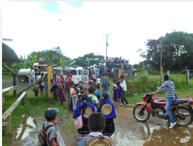
Foto 5. Hora de salida, estudiantes abordando los vehículos que los transportan Autor: Juan Pablo Perafán 2013

Otro aspecto a tener en cuenta, es lo referente a la jornada escolar, la cual comienza a las 8:00 a.m. y finaliza a las tres de la tarde. Los estudiantes en su mayoría llegan a la institución haciendo uso del servicio de transporte escolar, el cual es prestado por camperos pequeños, que en muchas ocasiones no tienen suficiente espacio para todos los niños y es común observar a la hora de llegada y de partida, a muchos de ellos en la parte superior externa del vehículo y colgados en la parte de atrás, aunque ellos son felices viajando afuera.