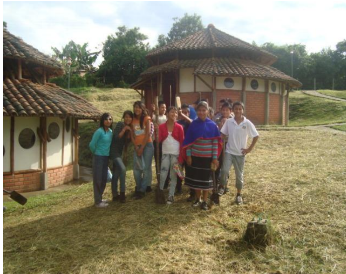
Foto 12. Estudiantes de grado séptimo preparados para ir al ya tul Autor: Juan Pablo Perafán 2013

ejercicios en el tablero, se logró superarlas. Mientras se trabajaba en el aula todas estas actividades, se disponían en ellas, algunos momentos para indicar a los estudiantes la necesidad de comprender estos conceptos y luego llevarlos a la práctica en el desarrollo de otras actividades en diferentes áreas; a la vez que se discutía con ellos, sobre la relación de estos contenidos en la vida cotidiana y así poder lograr mayor interés por su estudio.