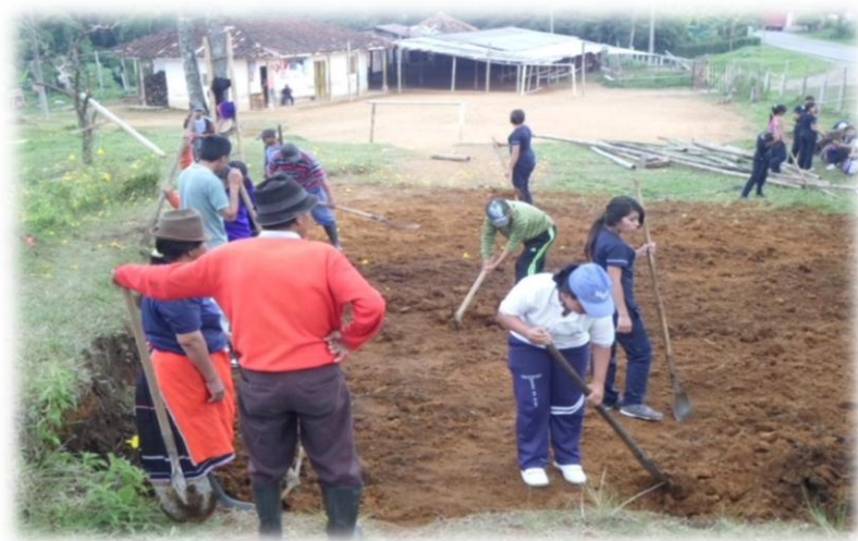
Foto 10. Minga escolar con padres de familia, estudiantes y docentes Autor: Juan Pablo Perafán 2013

Los padres de familia de los niños que asisten a la Institución Educativa Ala Kusreikya Misak Piscitau, son de gran valor para la educación, puesto que están disponibles ante la enseñanza-aprendizaje del conocimiento propio, el niño no solo se forma en la escuela, sino que es el reflejo de las familias en las que crecen, ya que cultivan en los niños la importancia del ser Misak, por medio de la lengua materna Namui Wam.