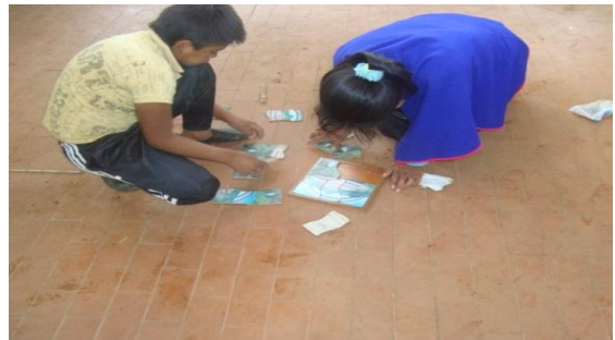
Foto 18. Actividades didácticas con estudiantes Autor: Juan Pablo Perafán 2013

De igual forma se socializan los informes escritos por cada uno de los estudiantes y se puede dar cuenta en la mayoría de ellos, la gran acogida que tuvo el recorrido ecológico, al observar en varios escritos, frases como esta: “la salida ecológica fue muy