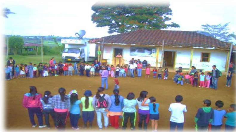
Foto 2. Círculo de formación para el saludo de bienvenida a la Institución