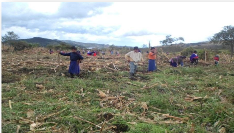
Foto 21. Minga interinstitucional Finca Guarangal –Silvia -Cauca 2013

Otro aspecto que me deja una gran lección, es el haber reconocido que definitivamente, una actividad pedagógica puede dar mejores resultados, si nos salimos de los límites que tradicionalmente nos han puesto las aulas de clase. Es decir, no se hace imperantemente necesario estar en un salón para construir un conocimiento.