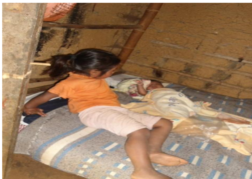
Foto 18. Camas elaboradas provisionales para los niños.