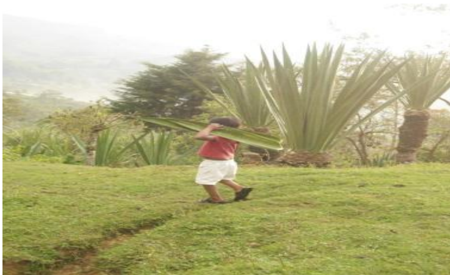
Foto 15. Niña trabajando.

La relación con los animales es muy importante para los niños, el caballo es el medio de transporte que la mayoría de las familias utiliza para salir al casco urbano, también el caballo es una ayuda muy importante para el trabajo, en este animal llevan y traen los productos que la familia necesita para vivir, los niños a esta edad ya pueden ir a traer un caballo y montarse con la ayuda de sus padres o de una persona mayor.