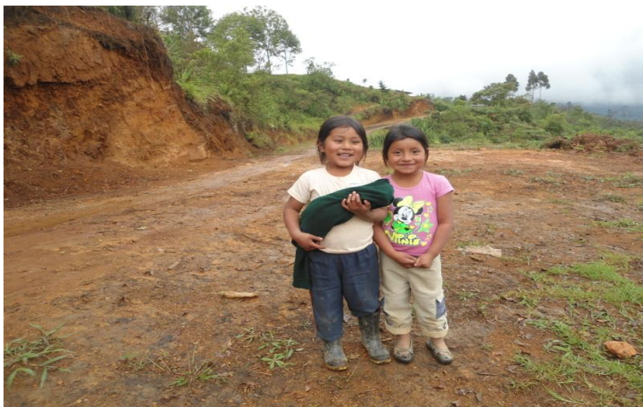
Foto 9. Niñas con muñeca de trapo.

Cuando los niños Nasa y Misak empiezan a caminar, imitan lo que sus padres hacen, se vuelven muy curiosos y empiezan a hacer preguntas de las cosas que ven y suenan a su alrededor, cogen herramientas llevan y traen cosas simulando que están cargando leña o remeza, juegan a las muñecas haciéndolas con trapos, y con una cobija pequeña o pañal lo enrollan diciendo que este es el bebé, luego lo envuelven con el chumbe, en algunas ocasiones lo hacen con la ayuda de sus padres y se los cargan en los brazos o en las espalda. Cuando están imitando a cocinar lo hacen con hojas de árboles que las ponen como ollas y platos, la flor del pasto la utilizan como el arroz y también utilizan semillas y raíces diciendo que son productos como arracacha frijol, yuca etc.