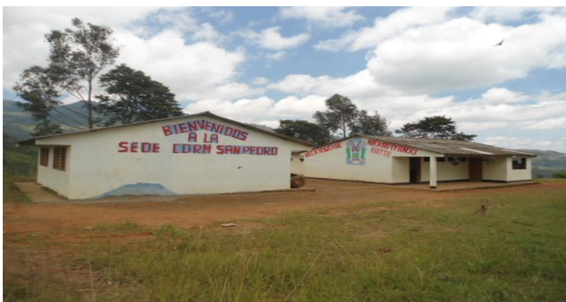
Foto 2. Centro Educativo San Pedro resguardo de Pueblo Nuevo.

escolar en la vereda, para esto se organizan mingas entre nasas y Misak para subir el material; siendo construida el aula empieza a funcionar la escuela con el grado primero y segundo con un total de 30 estudiantes; poco a poco con la llegada de más estudiantes se iba aumentando el numero de niños y también de los grados escolares hasta actualmente contar con 57 estudiantes distribuidos desde grado transición al grado quinto.