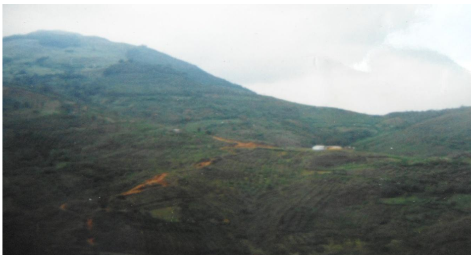
Foto 1. Panorámica de la vereda San Pedro.

La vereda San Pedro está ubicada en la parte alta del resguardo de Pueblo Nuevo a una hora y media de camino del casco urbano de Pueblo Nuevo. Esta vereda limita con las siguientes veredas: Al oriente con el resguardo Indígena de Quichaya, al occidente con la zona urbana de Pueblo Nuevo, al norte con la vereda la Palma, al sur con la vereda Loma Amarilla.