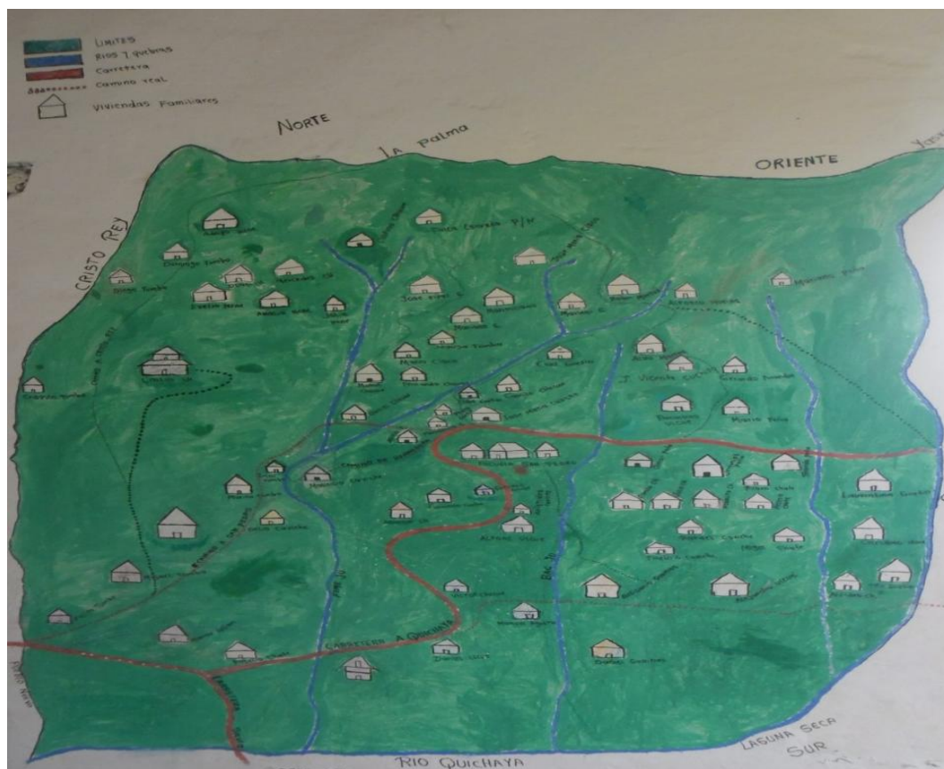
Mapa 2. Mapa de las familias de la Vereda San Pedro

Mientras que los guambianos se fueron adaptando poco a poco y fueron creando lazos de amistad, cuando iban a bautizar los hijos buscaban padrinos ya sea de la familia Misak o nasa, en otras ocasiones intercambiaron el servicio de padrinos y se hacían compadres que es el término más usado en la región.