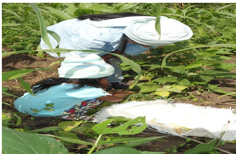
Foto 13. Niña Misak junto a su madre en la huerta.

Las niñas son las que más acompañan a la mamá a buscar los diferentes productos que siembran en la pequeña parcela cerca de la casa, y que para el Misak se llama ya tul que es la huerta casera, donde se encuentran las plantas medicinales para hacer las aromáticas y algunos remedios cuando algún miembro de la familia se encuentre en mal estado de salud, también hay otros productos que se cosechan cuando se necesitan para la alimentación en la familia.