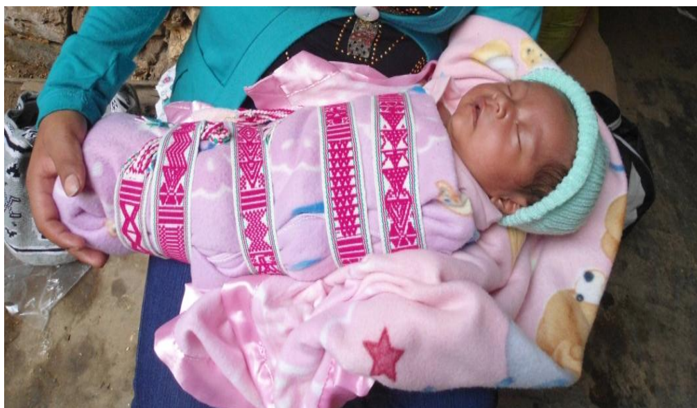
Foto 7. Niño envuelto con el chumbe.

A los bebés hasta los tres meses se debe cargar siempre de forma horizontal, no es recomendable levantarlos de forma vertical, el levantarlos de esa forma se corre el riesgo de que el bebé tenga los ojos brotados, para ello se debe cubrirlo con un manto y sostener la cabeza del bebé para que no se descuelgue y tenga lesiones del cuello y la columna al cargarlo.