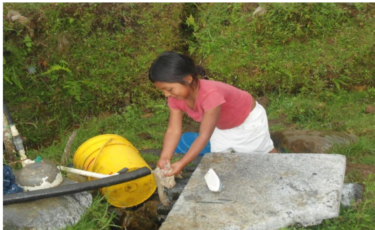
Foto 12. Niña lavando ropa.

Las niñas son las que más acompañan a la mamá a buscar los diferentes productos que siembran en la pequeña parcela cerca de la casa, y que para el Misak se llama ya tul que es la huerta casera, donde se encuentran las plantas medicinales para hacer las aromáticas y algunos remedios cuando algún miembro de la familia se encuentre en mal estado de salud, también hay otros productos que se cosechan cuando se necesitan para la alimentación en la familia.