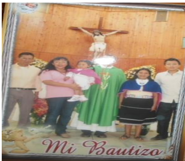
Foto 16. Bautizo de niña Misak.

Los niños y niñas de la familia Nasa y Misak acuden a otros espacios de aprendizaje en compañía de sus padres, los días domingos y los días de mercado son muy concurridos por los padres y que junto con ellos llevan a los niños, en el mercado que se realiza en el casco urbano acuden muchas personas tanto mestizas, indígenas y afros, los cuales hacen que el niño o niña sienta que hace parte de una gran sociedad, el aprendizaje de los niños en esta edad se da mas por le medio visual ya que observa detenidamente los diferentes objetos, materiales y otras cosas que suben a vender en el mercado.