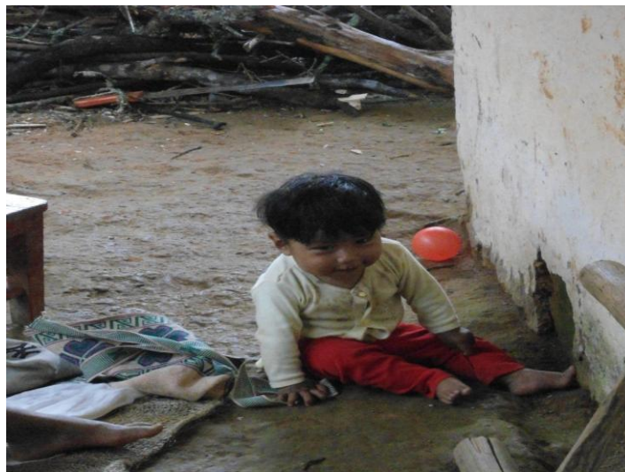
Foto 8. Niño de 1 año.