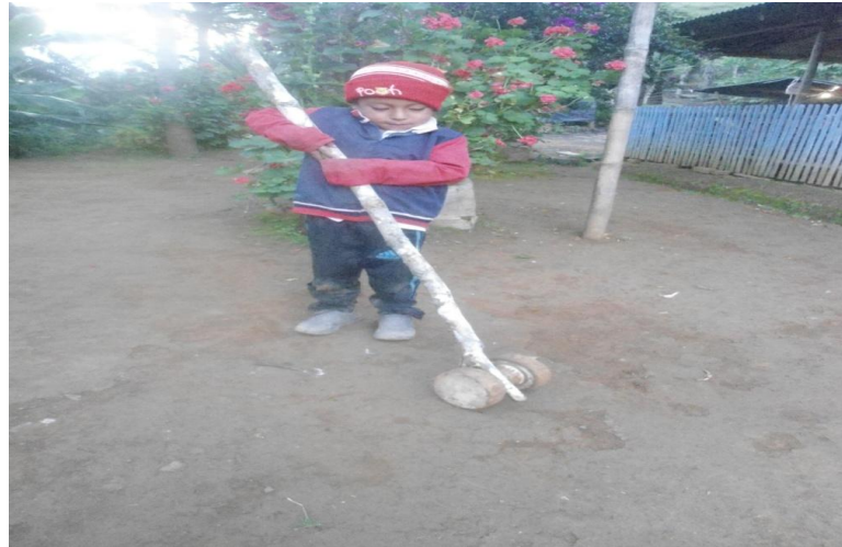
Foto 10. Juguete tradicional: carrete y astil de dirección.

cansancio a velocidades rápidas ya que en ocasiones se reúnen varios niños con este juguete y terminan haciendo competencias para el que llegue primero.