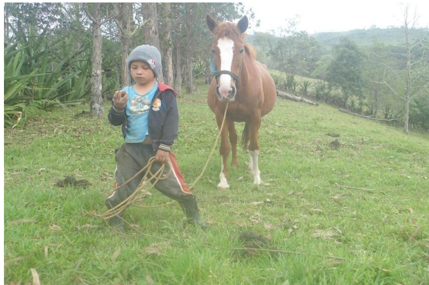
Foto 14. Niño trayendo el caballo. Fuente. Tombe Guasamalli, Gloria Elena).

Por lo general los niños son los que salen al campo en compañía de su padre quien lo lleva a caballo para que se acostumbre al manejo de los animales, las niñas se quedan en la casa ayudando a algunos oficios que realiza su madre para atender trabajadores o familiares que llegan de visita a la casa. Los niños por lo general son los que se relacionan con otros mas rápido, tienen mas libertad que las niñas, el juego es una estrategia de llamar la atención de otros niños y niñas y así se van reuniendo y compartiendo elementos como la oralidad en el lenguaje propio..