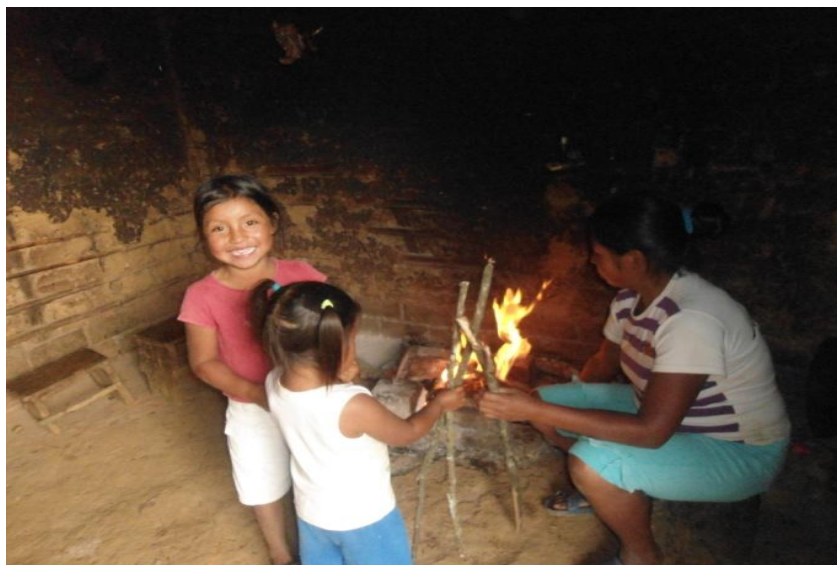
Foto 11. Niña haciendo oficios en casa

4.11.1 Enseñanza en las niñas. Las madres y las abuelas son las encargadas de darles las enseñanzas a las niñas, esta esta basada en la realización de los oficios de la casa, algunas niñas son las encargadas de estar pendientes de sus hermanitos mas pequeños, el de traer agua, o de pelar o desgranar con la mano algunos productos que se necesitan para la cocinar los alimentos como los frijoles o arvejas.