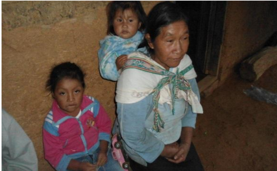
Foto 17. Abuela cuidando a sus nietas.

pueden estar al tanto de lo que hacen sus nietos, llegando así que los niños crecen sin ley y sin autoridad.