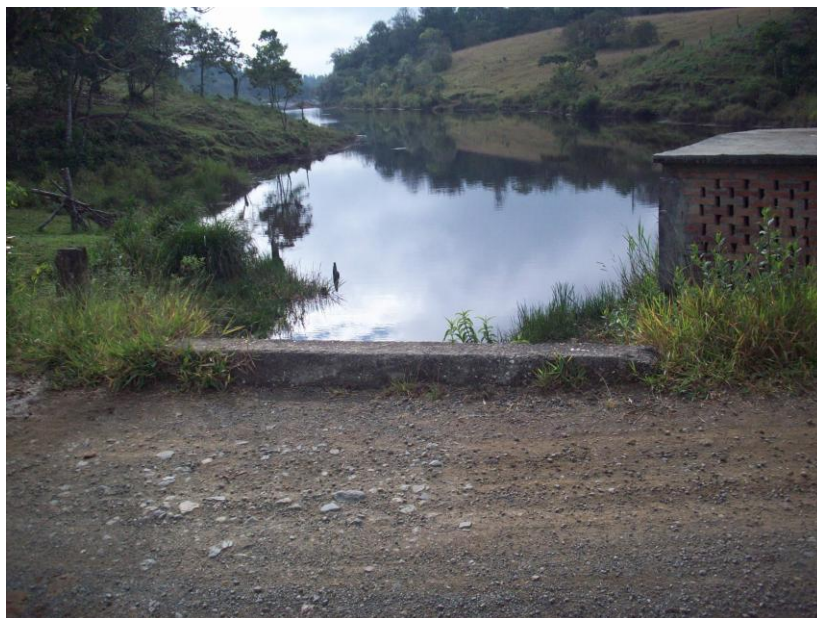
Foto No.4: Lago Carrizal fuente de agua para el consumo de Path Yu', en sus inicios del asentamiento.

y además no son permanentes. En el momento el 100% de las viviendas poseen en sus patios un aljibe de donde toman el agua para suplir sus necesidades.