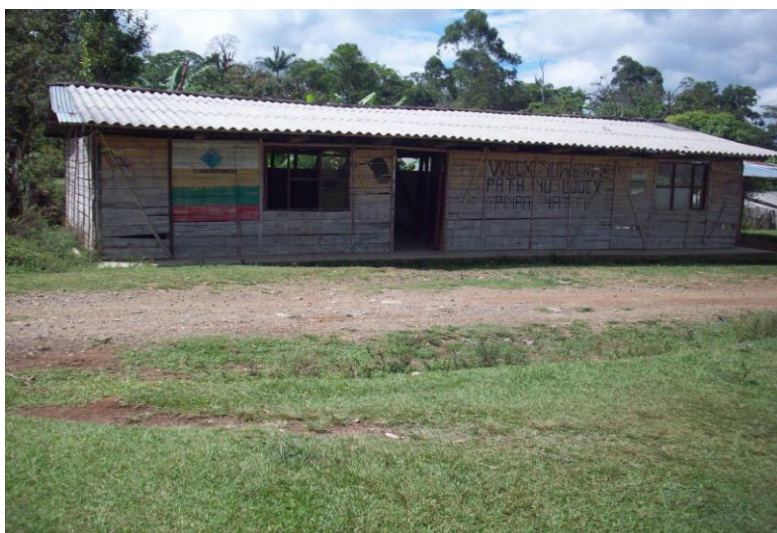
Foto No.5: Primera sede del Centro Educativo de Path Yu’, en sus inicios.

Actualmente, cuentan con resolución propia legalmente constituidos como Centro Educativo “El Despertar de Nuestros Sueños” y a partir del año 2014, serán administrados por la Institución Educativa de los Reasentamientos del Cauca Nasa Ñ us.