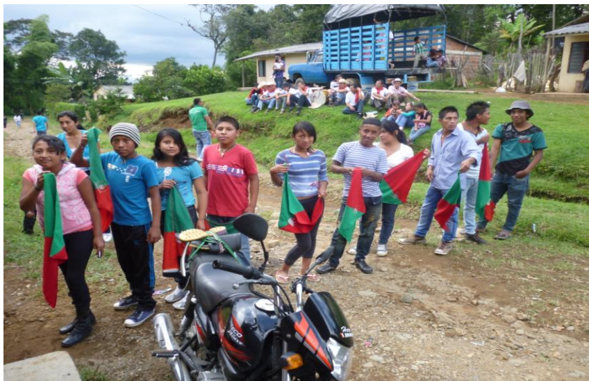
Foto No 8: Estudiantes de la Institución Educativa El Despertar de Nuestros Sueños.

En lo referente al currículo desarrollado y adaptado para la Institución Educativa el Despertar de Nuestros Sueños, se tiene el siguiente plan de estudios en el área de las Ciencias Sociales para los grados tercero, cuarto y quinto que ha sido construido desde el Centro Educativo Elías Trochez, quienes también pertenecen a la etnia nasa y desde donde se adecuan los lineamientos curriculares para ser desarrollados en este contexto de Path Yu’.