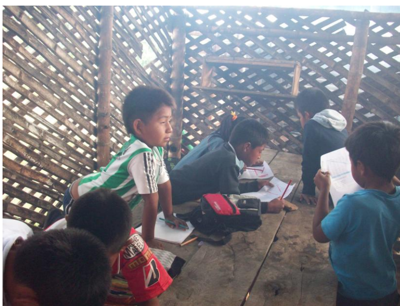
Foto No 11. Actividad de grupos, estudiantes de los grados 3, 4 y 5. Institución kwesx ksxaw yah fxide (El despertar de nuestros sueños).

Cuando los niños inician la elaboración de los trabajos se nota mucha comunicación entre ellos, se preguntan unos a otros en sus grupos como hacer, miran el trabajo de los compañeros y lo comparan, algunos que no tienen la habilidad de hacerlo rápido son auxiliados y apoyados por lo que terminan primero.