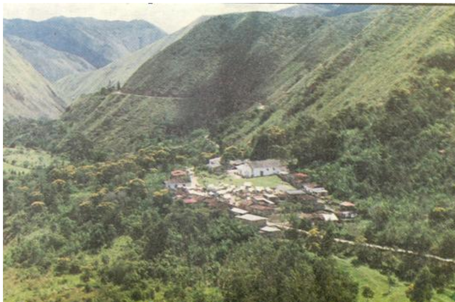
Foto No. 1: Resguardo de Huila, Tierradentro, hoy en día desaparecido.

En Tierradentro se encuentran altos relieves tallados en piedra, y los famosos hipogeos o tumbas subterráneas que indican una fuerte religiosidad centrada en el culto a los difuntos. Antes de la conquista y que los Paeces ocuparan la región de Tierradentro, ésta estuvo sin duda habitada por un pueblo de una elevada civilización -pueblo escultor quizá relacionado con otra cultura cercana a la de San Agustín-. Esta es la famosa necrópolis de San Andrés de Pisimbalá. En estas tumbas se han encontrado objetos de cerámica muy bien trabajados, de formas elegantes