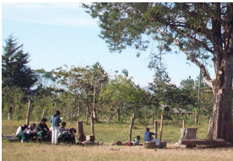
Foto No 13: Los niños de los grados 3,4 y 5 en clase al aire libre.

culturales y que unen a las comunidades en busca de su auto sostenibilidad alimentaria. Además el profesor usa términos precisos que se aplican en la vida diaria centrada en su contexto, entorno y cotidianidad en los que los niños interactúan constantemente.