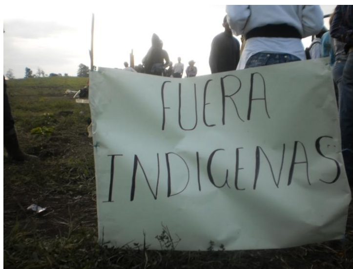
Foto No.15: Época de conflictos entre indígenas y campesinos.

llamada la Cecilia ubicada en la Vereda la Unión. Respecto a este relato, nos aporta el siguiente material fotográfico que da cuenta de los momentos tan difíciles que tuvieron que pasar para lograr posesionarse y comprar la finca en mención.