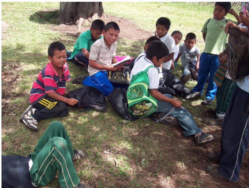
Foto No 9: Estudiantes 3° y 4° y 5° de la Institución kwesx ksxaw yah fxide (El despertar de nuestros sueños), archivo personal, Silva, 2013

Las culturas indígenas tienen dos experiencias claramente diferenciadas respecto a la educación: en primer lugar están los procesos propios alimentados con los conocimientos y saberes de nuestros abuelos, de nuestros capitanes y demás autoridades propias de la población en general que diariamente construyen en su relación con la tierra, en su trabajo, en la tradición oral y la historia.