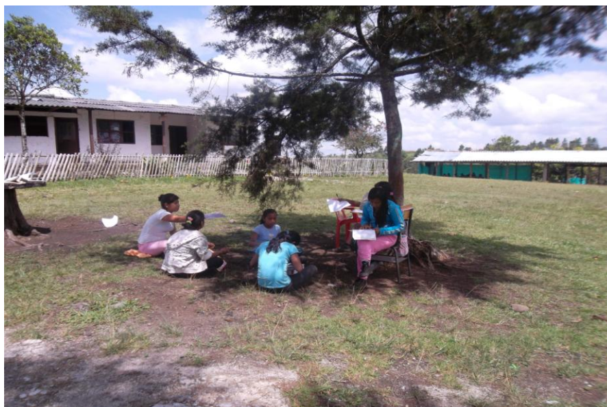
Foto No. 10. Estudiantes de la Institución kwesx kxaw yah fxide en actividad al aire libre.

En tercer lugar tienen muchos procesos de educación generados a partir de necesidades muy precisas como la organización desde la dimensión organizativa, las comunidades reivindican la educación como un derecho ancestral y humano, en tanto cada pueblo posee un acumulado de conocimientos, normas y valores que le dan derecho de ser respetado y valorado en su identidad, a ser reconocido en la diversidad y a persistir como cultura.