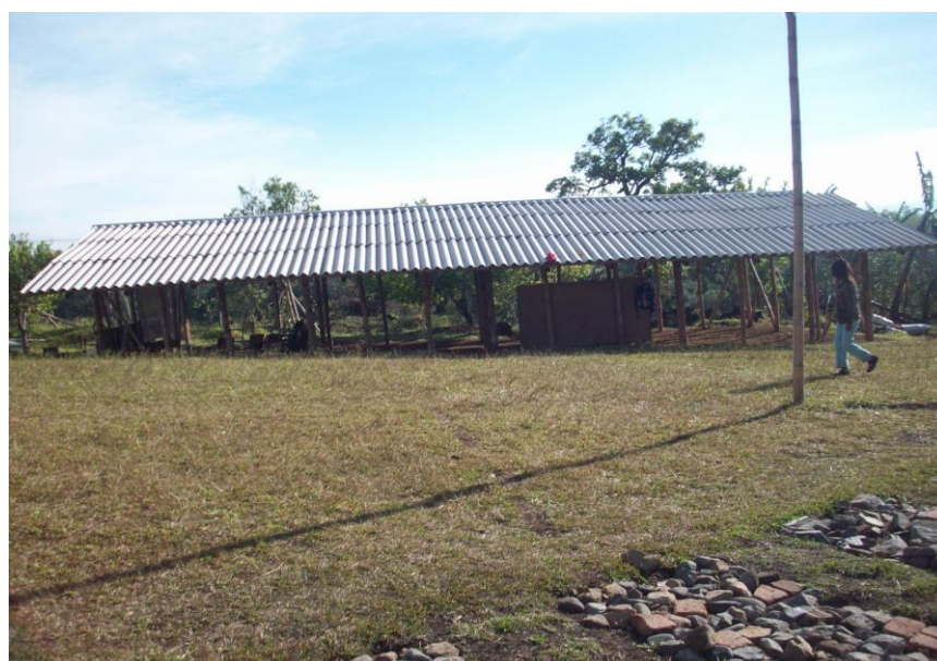
Foto No.7: Construcción nueva en guadua para atender a los niños de los grados tercero, cuarto y quinto.