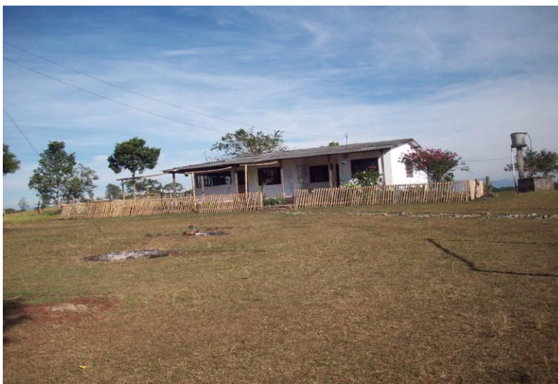
Foto No.6: Panorama actual del Centro Educativo El Despertar de Nuestros Sueños de Path Yu'.

En relación, a la infraestructura con la que actualmente cuenta el centro educativo se tiene que es una casa en paredes de ladrillo, puertas de madera y pisos en cemento; que ha venido siendo adecuados poco a poco para el desarrollo del proceso escolar, consta de tres salones distribuidos para los niños de los grados preescolar, primero, segundo, sexto, séptimo, octavo y noveno; mientras el comedor se adecuan esporádicamente como salón de clases para los grados de tercero, cuarto y quinto, grupo focalizado para el trabajo etnográfico. Así mismo el centro educativo cuenta con una cocina donde se preparan los refrigerios y almuerzos que se ofrecen a los niños y que son beneficio recibido por una parte del CRIC y por otra de los aportes que hacen los padres de familia con algunos alimentos de tipo agrícola como plátano, yuca, hortalizas y leña; la manipuladora de alimentos es pagada por el Cabildo de Path yu' y hace parte de la comunidad. De otro lado, la batería sanitaria solo cuenta con un baño en déficit condiciones, pues no cuenta con servicio de agua y la que se consigue debe ser traída de aljibes.