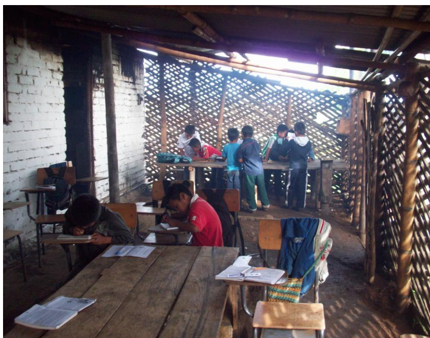
Foto No 17: Los niños de los grados 3, 4 y 5 en actividades de acuerdo a su grado

comunidad y la enseñanza es bilingüe, igualmente se trabaja el tul desde la parte agrícola y el proyecto de ganado de leche desde la parte pecuaria”. Nuevamente repite el profesor Efraín que: -“en el año de 1994 se presentó un sismo y las consecuencias fueron el desbordamientos de los ríos Páez y Moras ocasionando el desplazamiento, hacia diversos puntos del territorio Caucano y Huilense”.