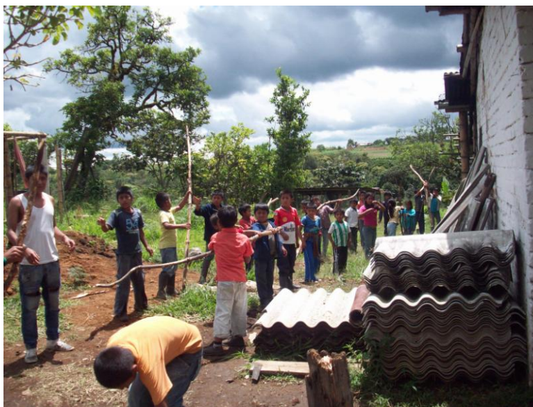
Foto No. 16: Minga comunitaria realizada con los niños(as) para celebrar y conmemorar la tragedia de la avalancha de Páez.

Para la comunidad de Path Yu', la conmemoración de esta fecha es muy importante, con ella toda la comunidad se integra y los niños y niñas que no vivieron esta tragedia la entienden y la sienten gracias a las historias que los mayores y adultos que sufrieron y sobrevivieron la avalancha les transmiten desde la oralidad. Es así que las canciones expresadas en lengua Nasa Yuwe manifiestan el dolor, la nostalgia y los sentimientos que dejó este evento, así mismo una voz de esperanza de continuar con la lucha por la supervivencia adaptándose a nuevos territorios trayendo consigo sus costumbres, su cultura, sus creencias y sus formas de interrelación como es la minga, característica de la comunidad nasa que se ha mantenido a través de los tiempos.