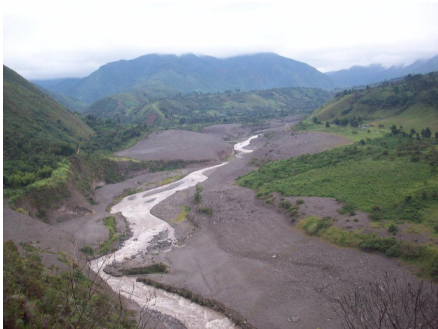
Foto No. 2: Rezagos de la avalancha del Río Páez.

El 6 de junio de 1994, siendo un día lunes a las 3:47 de una tarde resplandeciente y soleada, un movimiento telúrico de 6.7 grados en la escala de Richter, atemorizó a las comunidades y desencadenó la avalancha del río Páez. A esta se suma la avalancha de los ríos Moras, San Vicente y la Símbola como lo comenta Belarmino Pumba, docente en la escuela Monte Cruz en entrevista realizada para este trabajo etnográfico: