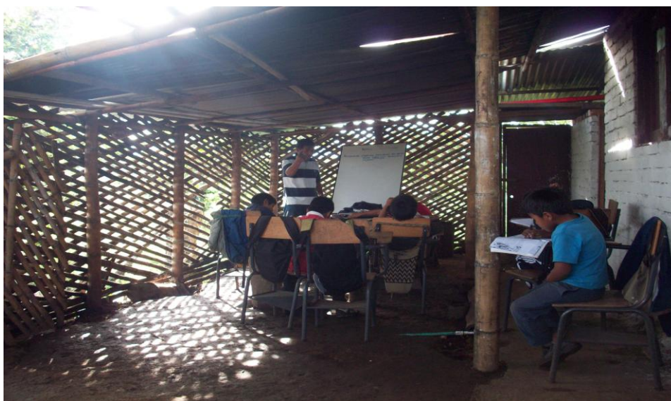
Foto No. 12: Salón de clases de los niños de los grados 3,4 y 5 Institución kwesx kxaw yah fxide (El despertar de nuestros sueños)