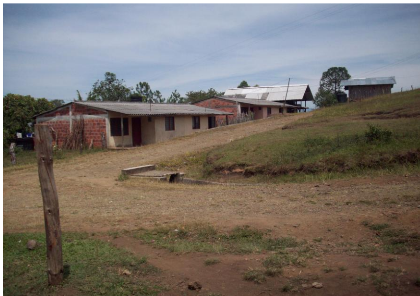
Foto No. 3. Panorama del Resguardo de Path Yu'.

El transporte se realiza en camperos y chivas, los días lunes, martes y viernes, parten del barrio Bolívar en la ciudad de Popayán. La comunicación con la cabecera municipal se hace a través de la vía que conduce a la vereda la Unión, en un recorrido de 7 kilómetros, la carretera está en regular estado. Es de anotar que la comunidad tiene mayor contacto con Popayán que con la cabecera municipal.