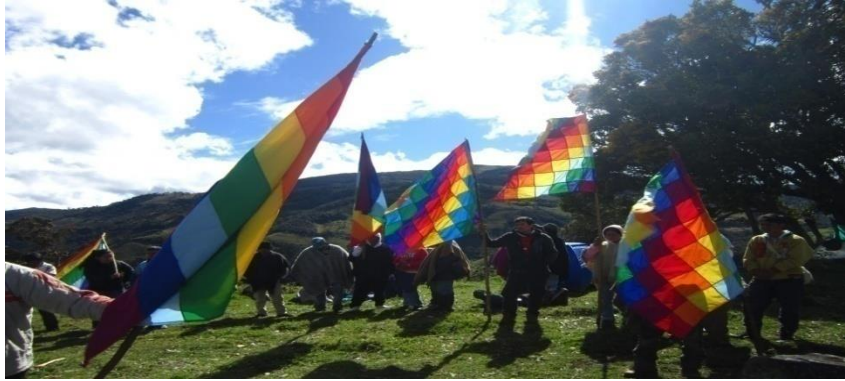
VÍCTOR TINTINAGO PIAMBA