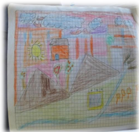
Ilustración 13 dibujo de los niños sobre su comunidad