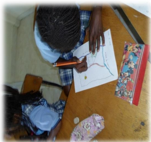
Ilustración 5. Niños realizando el mapa de la vereda

En los comentarios de los estudiantes sobre los mapas realizados, se resaltó el reconocimiento que hicieron sobre lo aprendido dado que nunca habían recorrido su lugar para representarlo, puesto que siempre aprendía en mapas de los libros o de las láminas de geografía. Quizás lo más relevante con este trabajo, fue el reconocimiento del entorno, la ubicación de la comunidad y la valoración de los elementos del territorio y aún, de espacios que ya no existen, lo cual representa un avance para insertar las temáticas afrodescendientes.