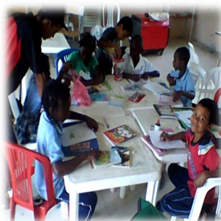
Ilustración 12 niños dibujando