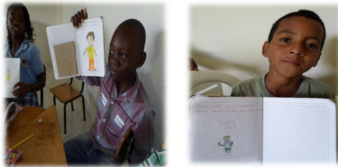
Ilustración 8 dibujo de los niños de cómo se reconocen