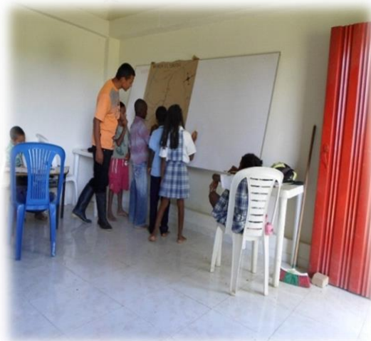
Ilustración 4. Niños reconociendo el territorio

El otro aspecto valioso, fue la motivación, participación y comprensión de los estudiantes que el aprendizaje de las ciencias sociales comienza por aquello que es familiar, cercano, observable, vivenciado y que pueden manipular. De allí, la importancia de aprender haciendo, de aprender observando y dibujando para generar la capacidad de hablar de aquello que se vive, se conoce, se comparte y se aprende.