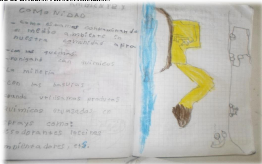
Ilustración 15 dibujo de los niños sobre la contaminación

De otra parte, se aprovechó el espacio reflexivo con el docente y algunos padres de familia sobre la necesidad llevar los productos tecnológicos al aula, especialmente aparatos electrónicos de videos, medios de comunicación y de acceso virtual para facilitar el aprendizaje de los contenidos de las áreas de estudio y por supuesto para el conocimiento de la Cátedra de Estudios Afrocolombianos.