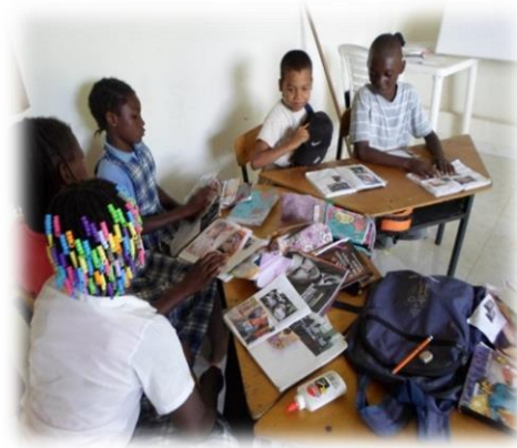
ILUSTRACIÓN 9. TRABAJO DE RECORTES DE CARTILLAS

Llamó la atención el hecho que durante el desarrollo de esta actividad, se observó que varios niños y niñas encontraron y recortaron de una cartilla, varias imágenes de niños mestizos que fueron valoradas como muy bonitas para pegarlas en sus cuadernos porque según ellos, eran las mejores. Esta situación evidencia que aún, los estudiantes tienen dificultades para aceptarse como afros.