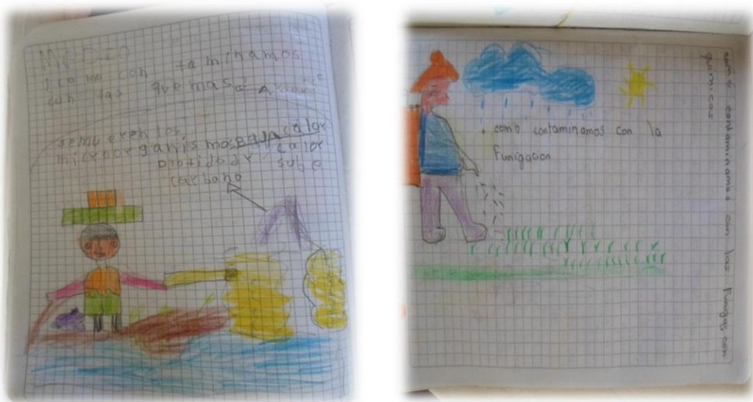
Ilustración 14 dibujo de los niños sobre la contaminación