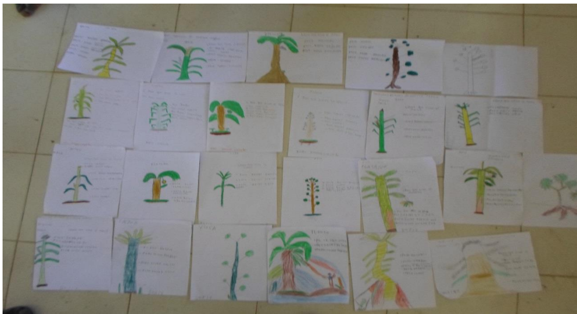
Ilustración 11 dibujo de los niños de los cultivos de su comunidad