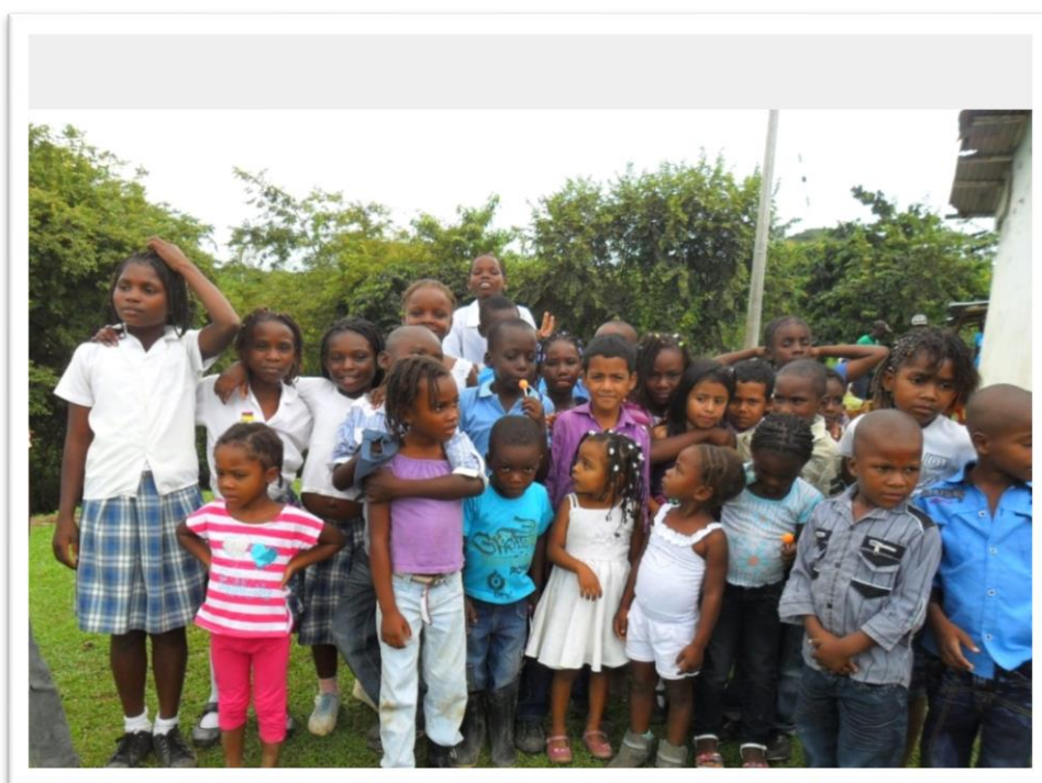
Ilustración 3 Niños y niñas de la escuela El Salado

Este conocimiento informal adquirido por varios estudiantes, se constituyó en un punto de apoyo para iniciar el conocimiento y aprendizaje de los elementos de la Cátedra de Estudios Afrocolombianos, dado varios niños y niñas participan ocasionalmente en las deliberaciones de las organizaciones mencionadas, por tanto disponen de algún conocimiento práctico relacionado con temas de la Cátedra.