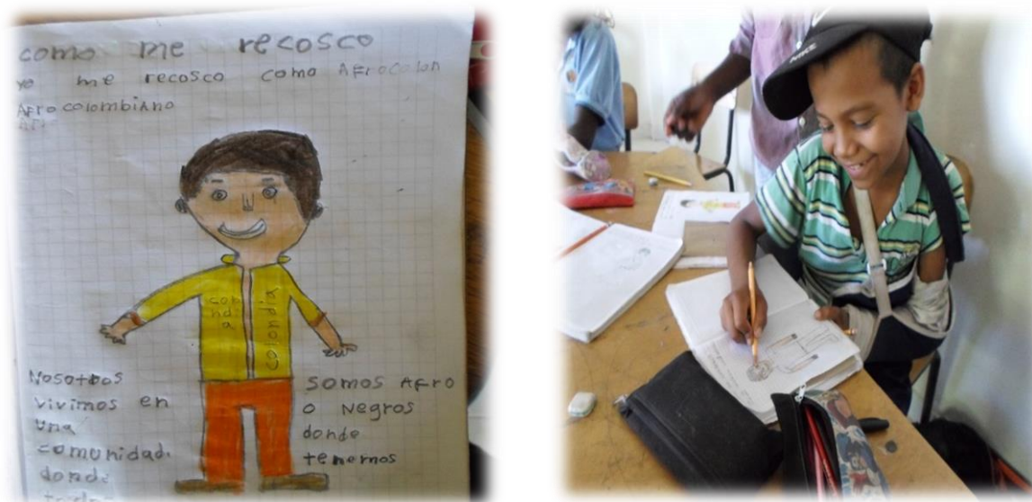
Ilustración 7 dibujo de los niños de cómo se reconocen

Estas inconsistencias en la identidad a criterio del Etnoeducador en formación, requieren de elementos investigativos y conocimiento apropiados para entender que la identidad de la persona, no se puede reducir al color de la piel, sino que está relacionada entre otros, con elementos culturales y sociales que en la mayoría de casos son desconocidos o reducidos a estigmatizaciones que en vez de aportar a construcciones de vida, niegan las potencialidades de reconocimiento de las personas para construir sus propios esquemas de vida..