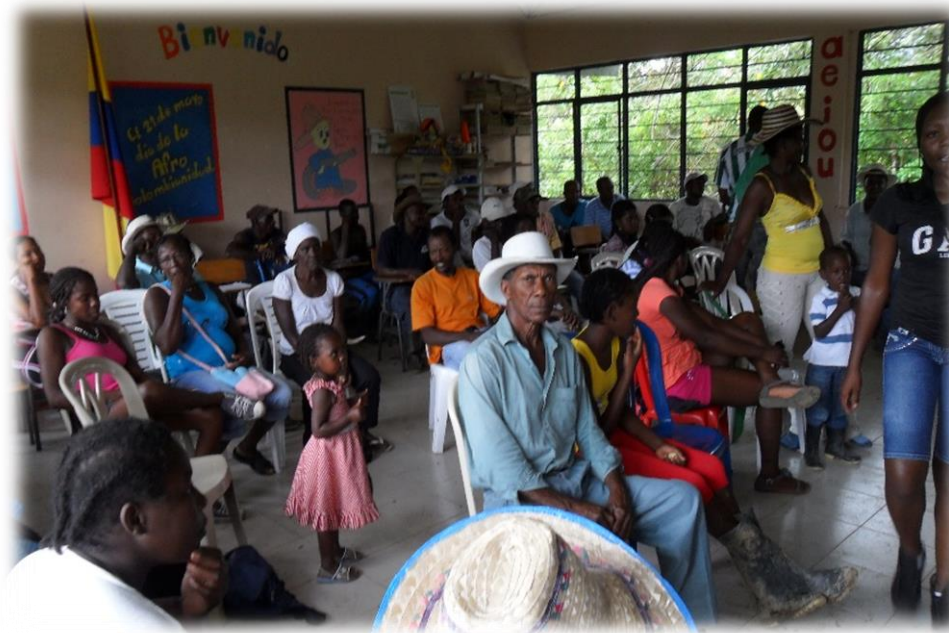
Ilustración 2: Foto 1. La comunidad de la vereda El Salado