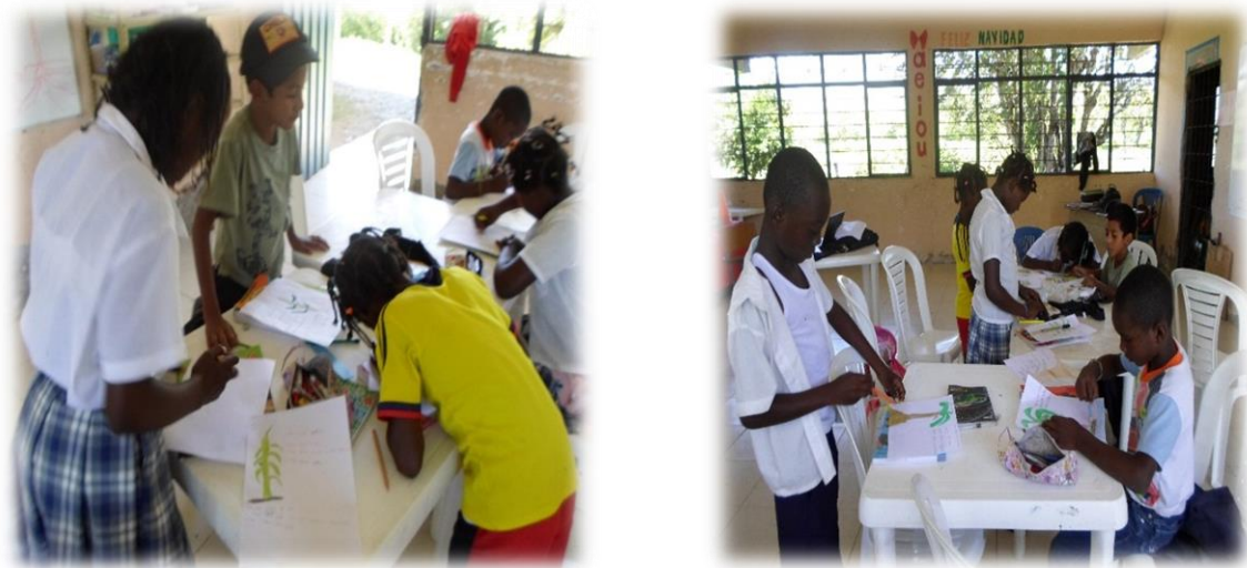
Ilustración 10. Niños dibujando los cultivos de su comunidad

Este momento fue aprovechado por el etnoeducador en formación para dar una explicación sobre la importancia de estos cultivos en economía y cultura de las comunidades afros, especialmente para la seguridad y soberanía alimentaria. Incluso, se resaltó la importancia y los usos de productos como el maíz que ha sido uno de los mayores aportantes a la nutrición, la recreación de labores culturales y los agregados sociales y familiares que representa para la transformación de variados platós y productos típicos que hacen parte de la estéticas y los orgullos afrodescendientes. Se culminó el trabajo con intercambios de experiencias y representaciones de dibujos en el cuaderno sobre el maíz.