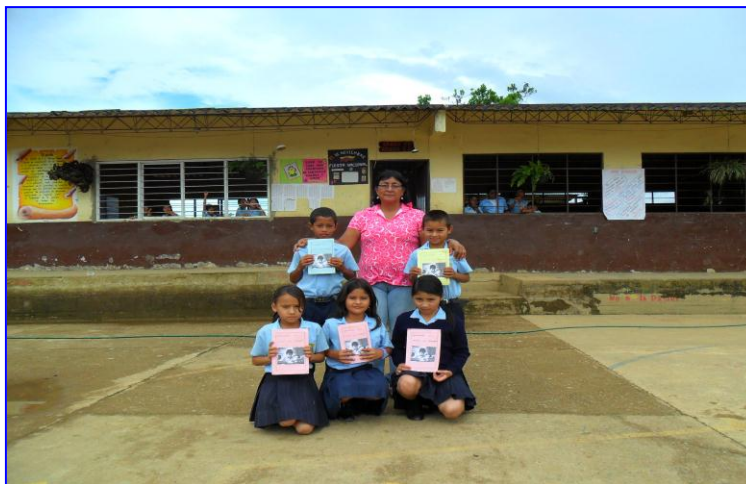
Foto N° 4. BLOQUE A de la Institución Educativa Técnica Miguel Zapata.

El continuo crecimiento de la población, la necesidad de responder al avance técnico y científico ante la globalización y la visión futurista del rector, docentes y líderes comunitarios hacen que se concrete un gran sueño en la institución “la educación media” fue así como en noviembre de 2007 mediante la resolución 5552 se autoriza el servicio educativo hasta la Media Técnica con especialidad Agroindustrial, la razón social ahora es institución Educativa Técnica Miguel Zapata y obtuvo su aprobación final el 07 de diciembre de 200, con la resolución 10244.