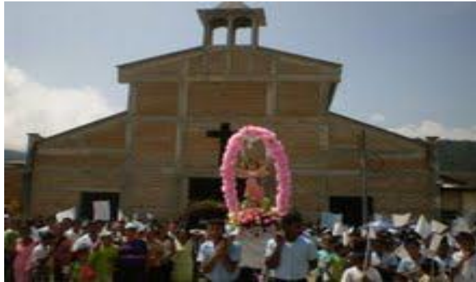
Lame, Eider. 2010. Corregimiento El Plateado.