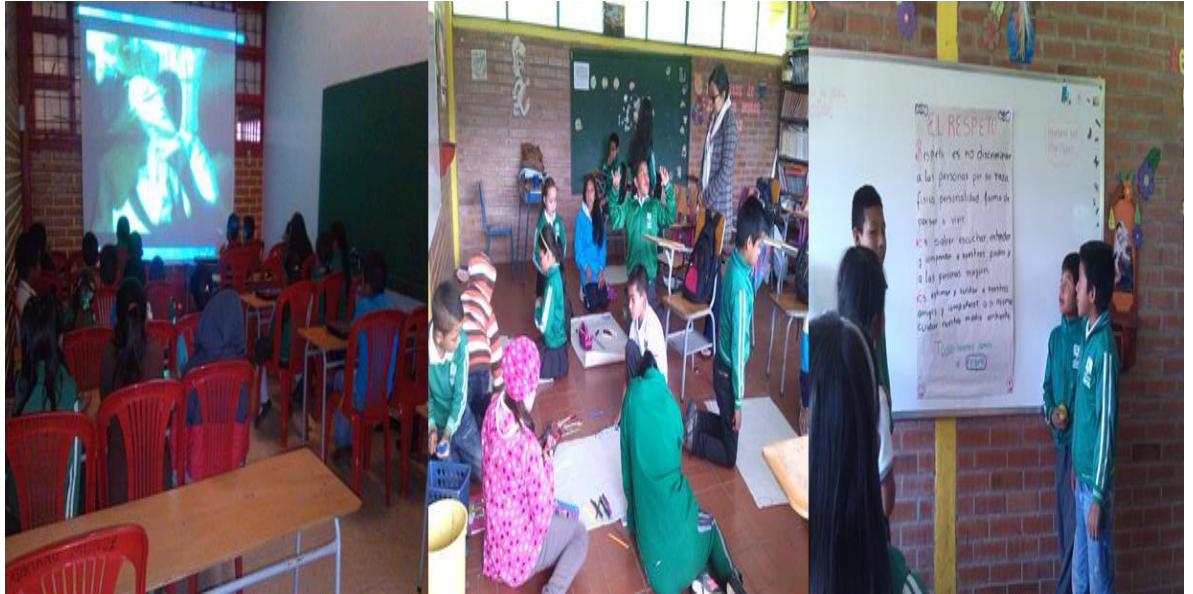
Fotografía 4. Estudiantes grado quinto I.E. Ezequiel Hurtado