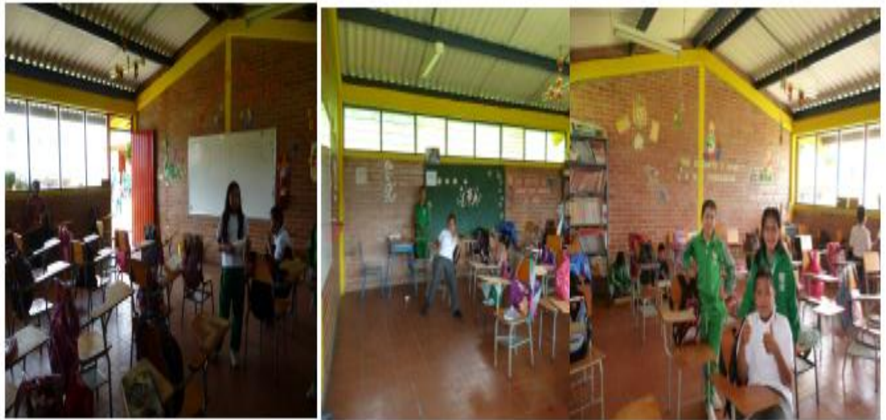
Fotografía 3. Aula de clase grado quinto