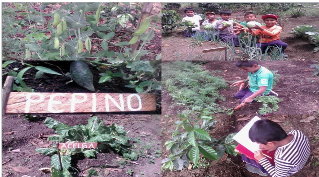
Foto. No. 13. Estudiantes Recolectando Productos del Yatul.

Cuando se desarrollaron ejercicios de trabajo o de investigación los estudiantes fueron descomplicados se sentaban en diferentes sitios de la huerta, no hubo dificultades por el espacio, muy tranquilos, realizaban preguntas cuando ellos no entendían algún concepto.