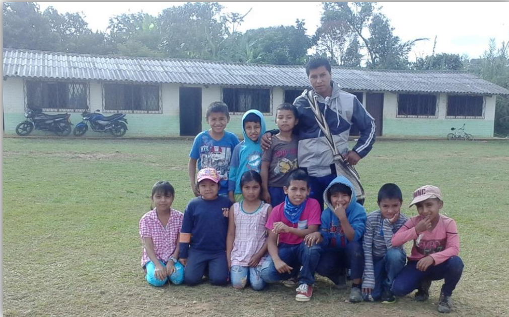
Foto No. 2. Estudiantes de la Escuela Misak La Bonanza.

Con el fin de trabajar activamente por la felicidad de los niños y niñas en el entorno escolar, es importante integrar a la comunidad educativa y apropiar las enseñanzas de los padres de familia, en la escuela. Para lograr el desarrollo integral de los estudiantes, en la búsqueda de espacios de aprendizaje significativos sobre los conceptos de las ciencias naturales, mediante la vivencia y aplicación al contexto, de tal manera que contribuyan en la solución de dificultades nutricionales, con los recursos del medio rural de la vereda la Bonanza Resguardo Misak la Bonanza.