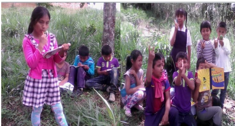
Foto. No. 3. Estudiantes de grado tercero realizando actividad de ley natural.

Inicio mi jornada con gran expectativa ya que en este día conocí a los niños y niñas del grado tercero, de la Escuela La Bonanza, eran campesinos, Misak y nasas. Realicé ejercicios de integración donde cada uno se presentó, luego me presente y les expuse que