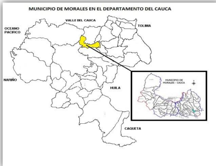
Gráfico No. 1: Localización del Municipio de Morales en el Cauca.

El Municipio de Morales se encuentra ubicado al nororiente del departamento del Cauca a 25 kilómetros de la ciudad de Popayán. La población es de una diversidad étnica que se distribuye así, campesinos mestizos, indígenas, como Misak, Nasas y Afros, donde prevalece un espacio de saberes en la población que habita este territorio.