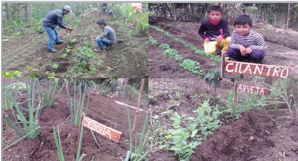
Foto. No. 11. Explicación del docente en el cuidado de las hortalizas que hay en el yatul.

“Al igual que las plantas, los animales son fundamentales en los ecosistemas, incluyendo los agroecosistemas. Los animales domésticos y asociados juegan un papel fundamental para asegurar la eficiencia de los agroecosistemas campesinos, ya que aprovechan recursos como el rastrojo de los cultivos y los desechos de la cocina y los productos secundarios del procesamiento de los alimentos. Su estiércol, con el manejo adecuado, se convierte en excelente abono”.