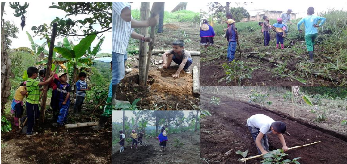
Foto. No. 4. Estudiantes en la adecuación del terreno para el yatul.

saltamontes, hormigas, avispas, abejas y mariposas, cada uno de estos seres con una características diferentes y únicas, incluyendo al ser humano.