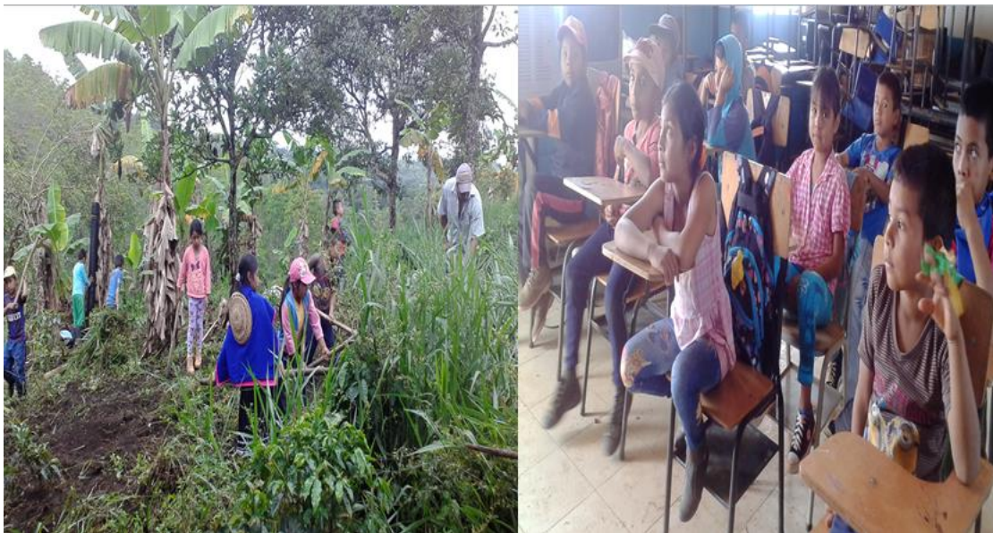
Foto. No. 12. Niños y Niñas en Minga de la Escuela, y Minga de Pensamiento.

Los mayores hablan que la “ minga es como una fiesta ”, un gran momento de estar en conjunto como una gran familia; con ella se vive según la idea innata de mayeiley, lata-lata y linchap, es alik porque es acompañar en el trabajo.