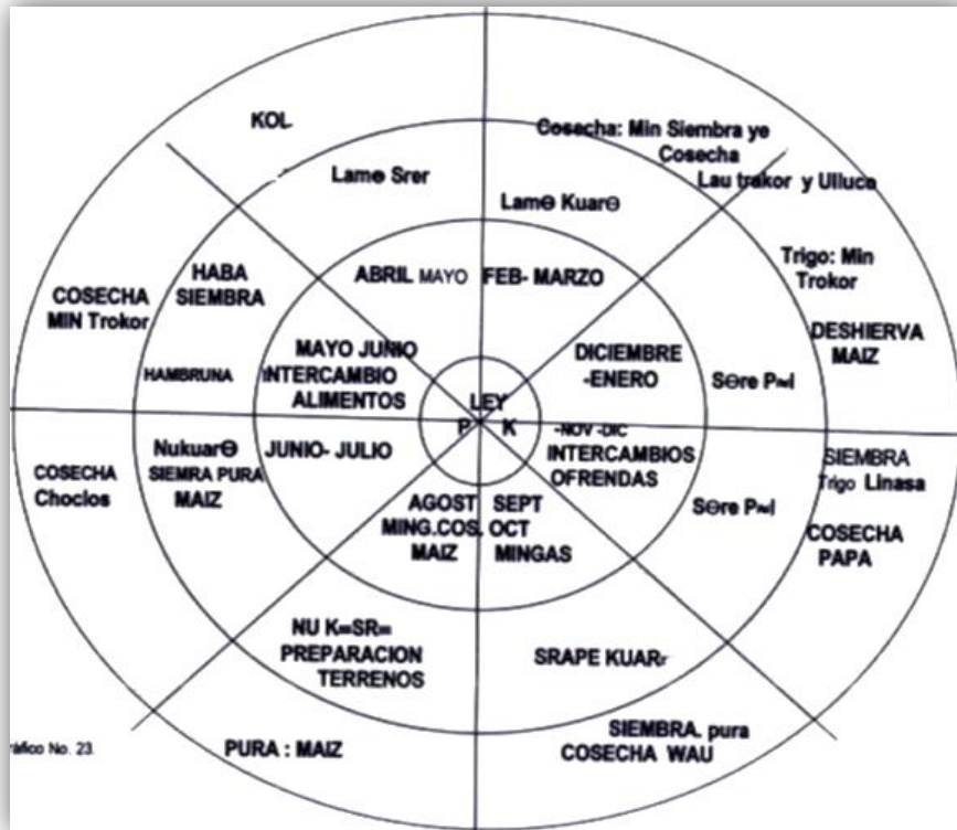
Grafica No.3 .Calendario de la Cosmovisión Misak

Variedad de productos que han sido adaptados a nuestros distintos pisos bioclimáticos; porque tenemos agricultura desde los 1.500 hasta los 3.50 metros sobre el nivel del mar. Con este calendario agrícola propio, los Misak aplicaban los conocimientos y saberes ancestrales, obteniendo buenos productos en la cosecha de cultivos.