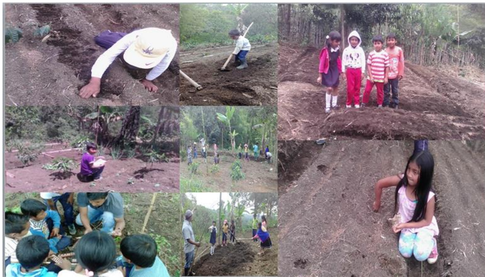
Foto. No. 5. Preparación del terreno para sembrar las hortalizas

En el espacio donde no se ha realizado ningún tipo de siembra se procede a efectuar el proceso de picado del terreno para que la tierra suelte de tal forma que se pueda trabajar, además, para que le filtre agua, aire, minerales y nutrientes como el fósforo, el calcio. Para hacer las eras donde se sembrarán las hortalizas, se hace la limpieza de toda clase de basura para que no haya incomodidad en la siembra de los productos.