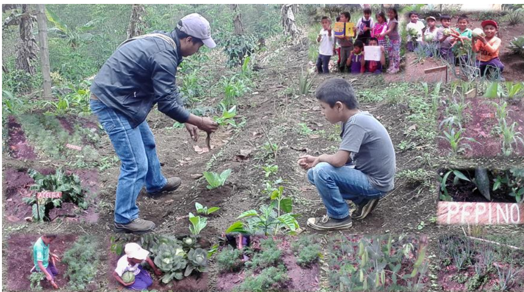
Foto. No. 16. Diversidad de productos que se plantaron en le Yatul.

“el hombre misak practica los intercambios de dones naturales dado que consideran que los animales y las plantas tienen espíritus que acompañan al hombre y a la comunidad en la vida diaria. Y que el territorio tiene un temperamento que se expresa a través del estado del tiempo, los fenómenos naturales y de los espíritus que en él, habitan”.