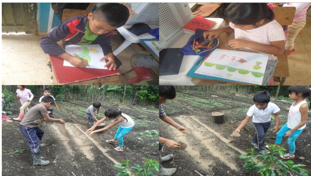
Foto. No. 6. Estudiantes en clases de ley natural teórico-práctico

Nuevamente se ingresa al espacio donde se estaba orientando, se realizó un conversatorio para analizar sus conocimientos, preguntándoles sobre los alimentos que se cultivaban en este clima; los estudiantes respondieron que en donde viven se siembra y se cultiva el café, plátano, yuca, maíz, caña, cidras, naranja, mango, papaya entre otros.