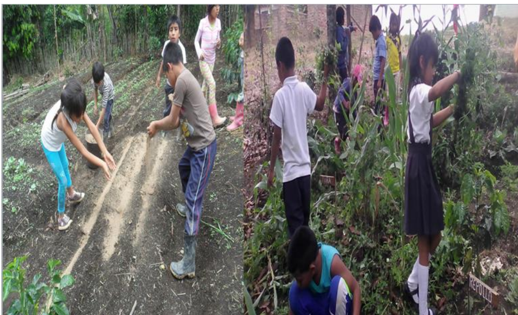
Foto. No. 9. Niños y niñas abonando con gallinaza, y arrancando la maleza.

En nuestro medio natural existen diversos componentes que se pueden utilizar como abono para las plantas lo que arrojaría en nuestro ecosistema un equilibrio natural ya que no estamos contaminando nuestra madre tierra, porque ella es quien nos brinda los alimentos necesarios para la vida de todos los seres que habitamos el planeta denominado tierra.