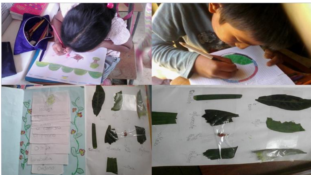
Foto. No. 14. Estudiantes dibujando, creación de herbarios.

En las diferentes actividades que realizamos en conjunto con los estudiantes siempre fuimos un equipo, indagando con el fin de obtener un resultado de las metas que nos proponíamos. La huerta siempre fue un sitio que nos brindó mucha información junto con los estudiantes se extrajo varios métodos de investigación.