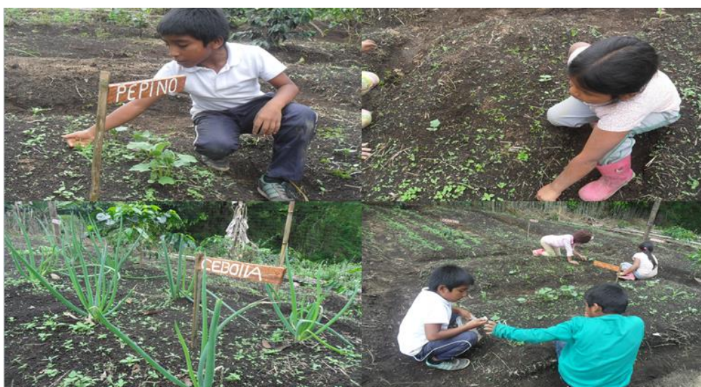
Foto. No. 7. Estudiantes sembrando y desyerbando las eras, donde hay hortalizas.

Por otro lado se lleva a cabo la construcción del semillero, en el área de terreno preparado y acondicionado, especialmente para colocar las semillas para su germinación bajo los cuidados adecuados. Al instante de regar las semillas se debe cubrir con muy poca tierra para evitar que la semilla muera, de lo contrario la planta crecerá sin dificultad hasta el momento que esté lista para el trasplante puede ser de 30 a 45 días dependiendo de la planta, en este periodo se debe estar remojando la tierra para que las plantas germinen. Antes de sacar las plantas del semillero conviene que esté regado pero no encharcado. Se procurará sacarlas sin dañar las raíces.