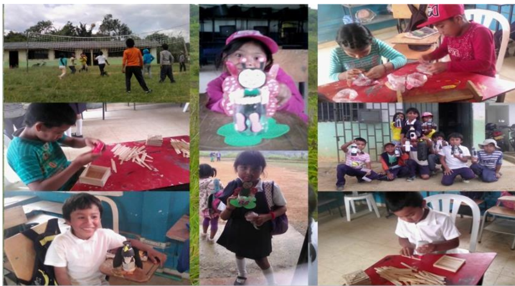
Foto. No. 15. Estudiantes jugando, elaboración de manillas, creación de elementos Con material reciclado.

Con los estudiantes se realizó el ejercicio que fue los diarios de cada uno de ellos, donde la propuesta fue que cada uno de ellos debía escribir todos lo que acontecía en cada sesión que se realizaba en las clases de ciencias naturales. Al inicio esta propuesta no fue bien aceptada pero cuando la fui explicando comenzaron a motivar de lo que de lo que ellos debían realizar, luego les entregué un cuaderno a cada uno, se pusieron alegres por lo novedoso para ellos, al principio todos iniciaron entusiasmados a escribir en este cuaderno, realizaban algunos dibujos, en algunas sesiones que yo realizaba con ellos.