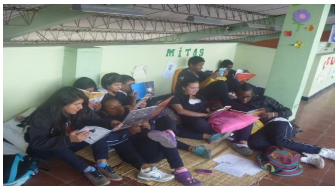
Fotografía 4. Estudiantes realizando lectura en los descansos.

Durante el transcurso de la aplicación de la estrategia se presentó un inconveniente: el espacio era utilizado por los estudiantes para refugiarse y realizar otras actividades completamente diferentes a la lectura, debido a que no habían desarrollado el hábito lector. Ante esta situación se propuso como alternativa de solución, trabajar con los estudiantes de grado once quienes acompañarían la lectura y esta labor se compensaría con las horas de servicio social que debían cumplir. Su trabajo fue exclusivamente de cuidadores del espacio para mantener el orden y evitar la pérdida de los libros. Sin embargo, se cumplió con los objetivos propuestos: el Vivero Literario Liceísta fue puesto al servicio de los estudiantes y se empezó a enamorar a los niños y jóvenes de la lectura.