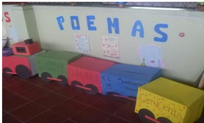
Fotografía 2. Tren para la comarca de la poesía. (2016)

Para la decoración, se utilizaron los dibujos de los estudiantes, un tren para la Comarca de la poesía donde se colocaban las producciones literarias de los estudiantes (que se realizaban durante la clase de proyecto de lectoescritura).