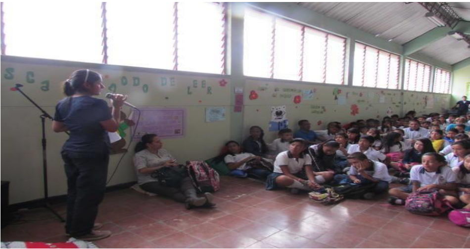
Fotografía 6. Año 2013. Relanzamiento del espacio de lectura.

Uno de los logros de este año fue la programación de reuniones periódicas para evaluar lo que sucedía en el Semillero literario durante los descansos. Esto sirvió para retroalimentar las estrategias de lectura; porque en cada sesión la docente llevaba nuevas actividades para motivar los procesos lectores.