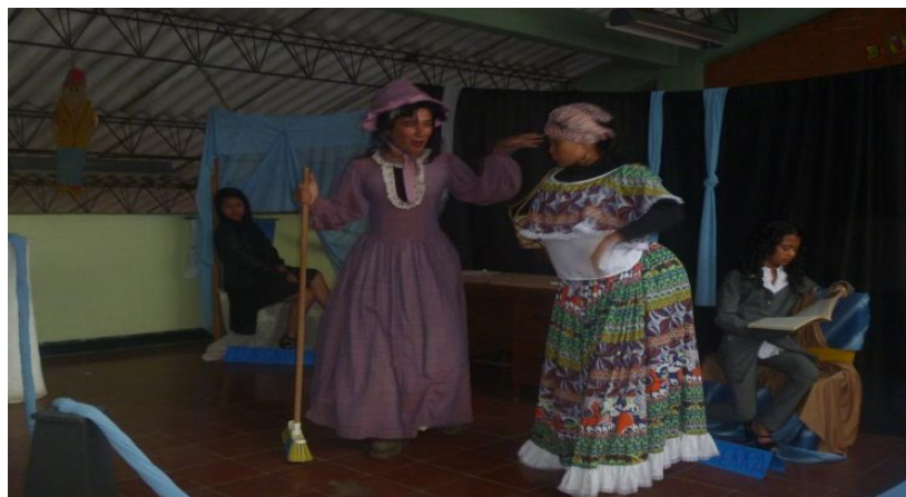
Fotografía 8. Obra de teatro: La Mujer y las letras. Un homenaje a las escritoras colombianas. Año 2014.

y reales como las escritoras. De esta forma la literatura sirve de testimonio para transformar proyectos de vida.