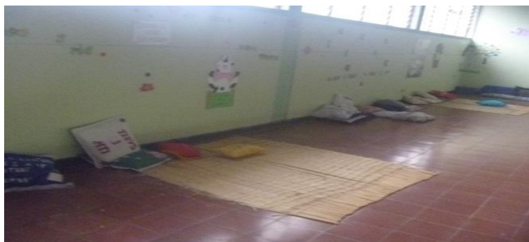
Fotografía 3. Adecuación del espacio con esteras.

acostados de acuerdo a como se sientan más a gusto. Una vez organizado el espacio se invitó a los estudiantes a visitarlo