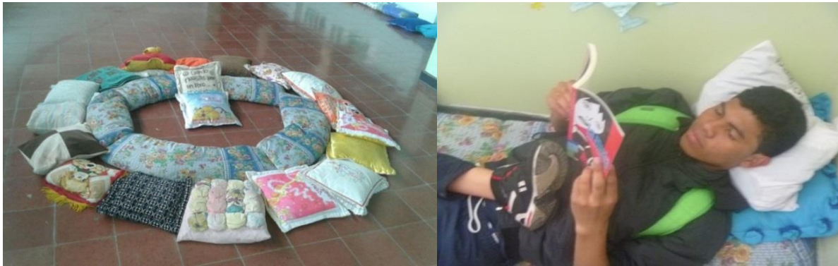
Fotografía 7. Acondicionamiento del Semillero de literario.

Comienza el tercer año de la estrategia pedagógica que pretende mejorar procesos lectores de los estudiantes liceístas. Durante el mes de febrero se inicia la decoración del espacio, para este nuevo ciclo se hacen algunos cambios, entre ellos se adquieren más cojines, por ser prácticos y cómodos para realizar la actividad al permitir que los estudiantes realicen la lectura en forma relajada y además al trabajar de manera colectiva o individual, se establecen interrelaciones con los otros o se fortalecen los momentos de intimidad al enfrentarse a un libro.