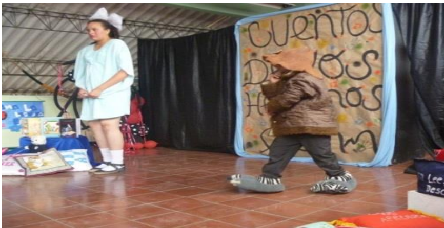
Fotografía 5. Puesta en escena a partir de los cuentos de los hermanos Grimm por el grupo de teatro del Liceo.

Para iniciar el segundo año de la estrategia se integra al comienzo del período escolar. Se readecua el lugar, decorando nuevamente con material didáctico donado por los estudiantes de sexto a once, se cambiaron las esteras por cojines y almohadas para brindar mayor comodidad. A partir de la experiencia anterior el trabajo se realizó con los estudiantes que voluntariamente querían participar en el proyecto, esta vez con el objetivo de hacer un acompañamiento in situ a los estudiantes que deseaban leer durante los descansos. La estrategia para atraer más lectores fue cambiar el nombre y hacer el lanzamiento del Semillero literario cuya finalidad se centró en el fortalecimiento de la lectura. Al acto inaugural se invitó al grupo de teatro del colegio 9 quienes presentan un montaje de los cuentos de los hermanos Grimm en una puesta en escena que duró 40 minutos, con un despliegue de creatividad que invita a la lectura. Por otra parte, algunos estudiantes leyeron poemas y mitos, todo el colegio asistió en rote de una hora por grado (sexto, séptimo, octavo, noveno, décimo)