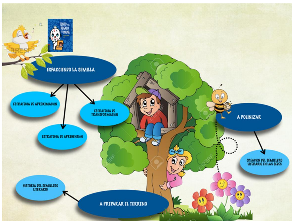
Fotografía 12. Infograma del proceso.

Como gestora de la propuesta confío en que mi “Ejercito maravilloso de mediadores” continuarán apoyando este proceso en las sedes para acompañar, hacer seguimiento y por supuesto ensanchar horizontes para que sean muchos más los que se sumerjan en el mundo mágico de la lectura.