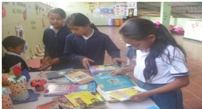
Fotografía 10. Exhibición de libros para que los visitantes al Semillero Literario puedan observar, manipular y deleitarse.

El inicio del año escolar marcó también el comienzo del cuarto año de funcionamiento del Semillero Literario. A diferencia de los años anteriores, la premura del tiempo impidió que se realizara el relanzamiento del espacio de lectura; sin embargo, empezó a funcionar con normalidad en el mes de marzo.