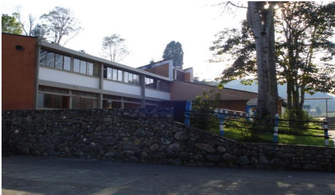
Fotografía 1. Instalaciones de la Institución Educativa Liceo Alejandro de Humboldt.

La Institución Educativa Liceo Alejandro de Humboldt 3 se encuentra ubicada en la comuna 4 de la ciudad de Popayán (Cauca), es una Institución de carácter oficial, la cual atiende a 1.250 estudiantes en los niveles de pre-escolar, primaria, básica secundaria y media académica, en edades que oscilan entre los cinco y los veinte años, cuenta con cuatro sedes, dos ubicadas en el área rural y dos en el área urbana, las cuales son: Pisojé Bajo, El Sendero, Yanaconas y Pueblillo respectivamente.