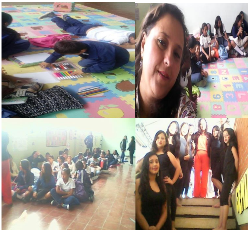
Fotografía 11. Adecuación del Semillero Literario.