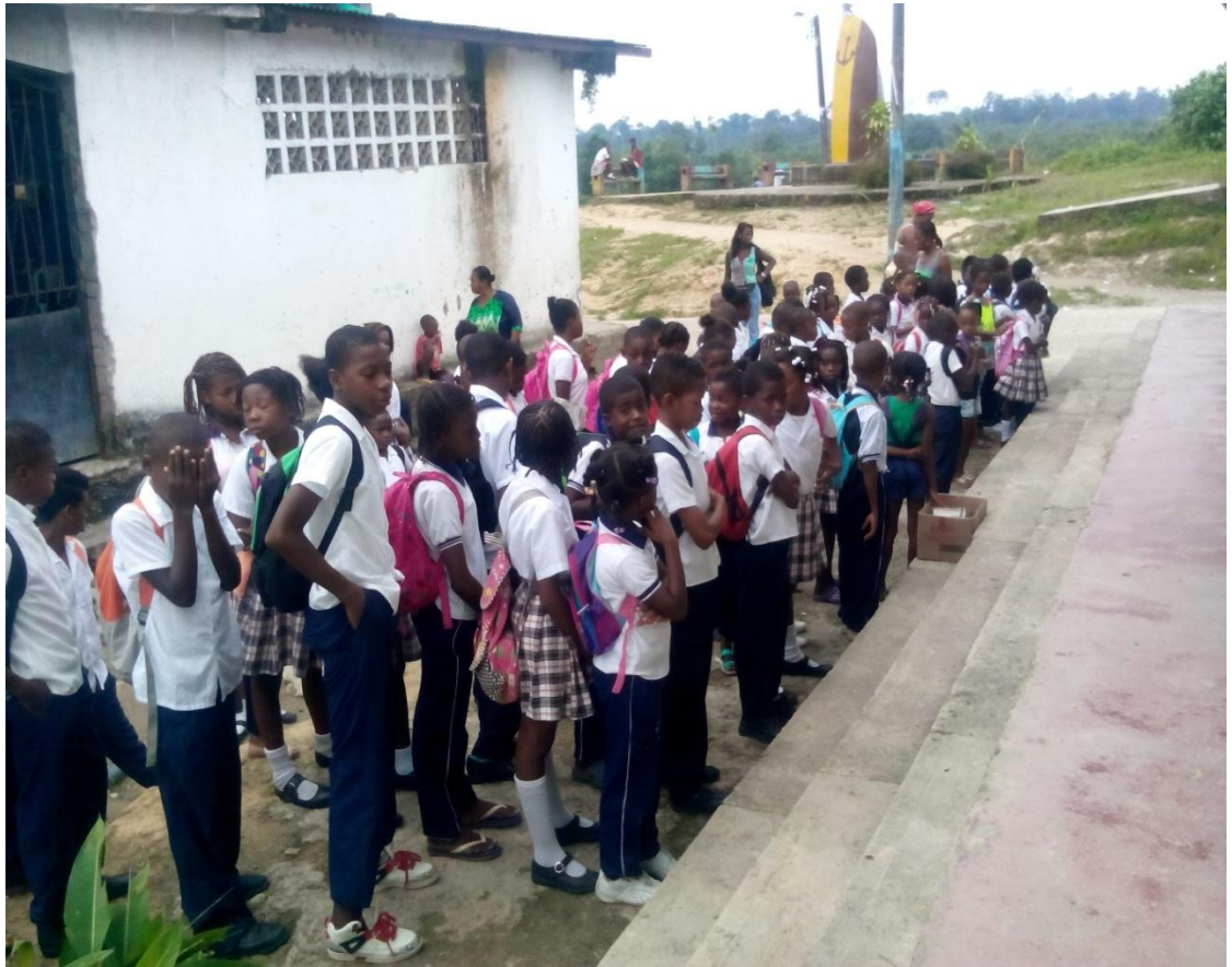
Fotografía 1. Niños y niñas del Centro Educativo en formación plaza libre

Fuente: Archivo fotográfico Francia Cuero. (2016)