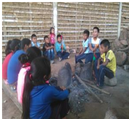
Fotografía 6 – Los estudiantes en la tulpa

En la vida social, se reflexiona las malas conductas de algunos estudiantes, de padres de familia y otros que están en la comunidad, y que en general desestabilizan la armonía de la vida comunitaria. Padres de familia que, en las reuniones han contado las vivencias y otros que han ocultado algunas malas actuaciones en familia y que por respeto de los docentes que coordinamos, tampoco nos adentramos a escudriñar todo. Solo nos queda claro que es el interés nuestro, orientar y mediar en algunos casos donde sea posible. Tampoco juzgamos a nadie y no es nuestro interés, el diálogo docentes y familia es poder compartir nuestras proyecciones en familia y de brindar lo mejor para nuestros hijos.