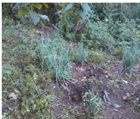
Fotografía 15 – Detalle del tul