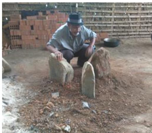
Fotografía 4 – Mayor sembrando las tulpas

En la lengua nasa yuwe se dice ipxh kweth, el fogón o la tulpa. De igual, el vocablo la tulpa, es aceptado por la real academia de la lengua castellana como las tres piedras donde se ubica el fogón. En la comunidad nasa, la tulpa es considerada como el corazón donde se origina vida y el lugar predilecto en la transmisión de los valores culturales. Las tres piedras representan la familia (padre, madre e hijo) como base de la sociedad. En la tulpa, no solo se recrea la familia compartiendo los saberes propios de la cultura, si no el sitio donde la mujer da vida a otro ser, y así continuando la puesta en práctica las normas culturales dejado por los neh, espíritus mayores uma y tay.