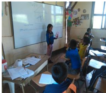
Fotografía 10 – Exposición de los estudiantes

Cada uno de los estudiantes sin temor nos da a conocer las noticias que escucharon del día anterior, algunos son muy olímpicos responden deportivamente, esto hace que los niños no están informados de lo que está aconteciendo a nivel local, regional, nacional. Hay algunos factores que inciden como son falta de radio, televisión o no tienen el servicio de energía.