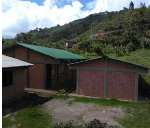
Fotografía 2 – Detalle de la infraestructura

La infraestructura de la institución educativa en esto momentos el estado de los salones es bueno, cuenta con seis salones para atender de los grados de preescolar a quinto de primaria, incluida los seis cursos de la secundaria, En el año 2016 se implementó que los docentes de primaria se rotan grado por grado sin desconocer que cada grado tiene su docente a cargo; cada docente debe tener el horario que le corresponde y las actividades establecidos en su planeador. Esto quiere decir que en el día los estudiantes comparten experiencia con 3 docentes en diferentes disciplinas.