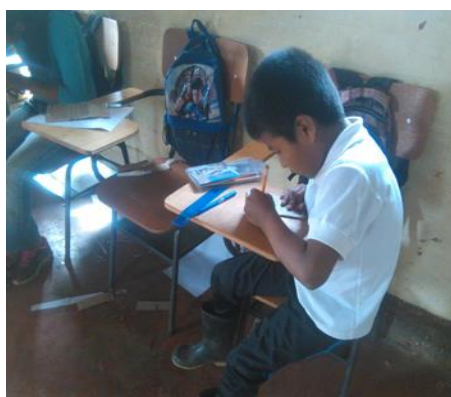
Fotografía 20 – La línea del tiempo

Es lo que manifiestan los estudiantes cuando ellos ponen desde su punto de análisis de la situación que afrontan en su diario vivir. En la mayoría de las familias de los estudiantes se refleja estas dificultades ya mencionadas, como hay debilidades también hay fortalezas, y una de las fortalezas es que los estudiantes están muy motivados en terminar la primaria y de continuar con sus estudios y de seguir capacitando en las diferentes entidades y universidades que brinda oportunidades de formación, es lo que ellos nos dan a conocer de sus