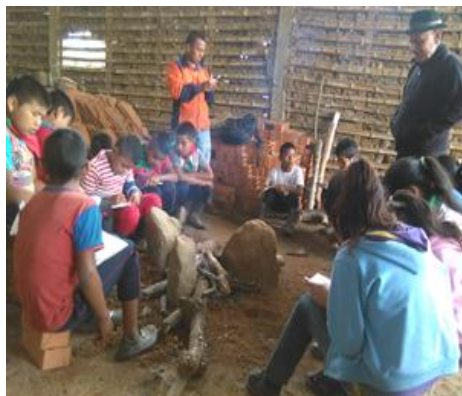
Fotografía 5 – Aspecto de la tulpa pedagógica

Y entonces, ¿Que es la tulpa pedagógica?