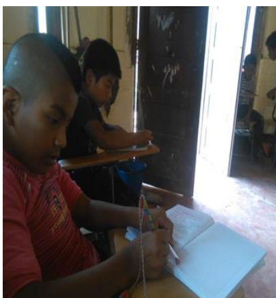
Fotografía 11 – Escritos libres de los estudiantes

Con la actividad desarrollada los estudiantes realizaran escritos libres como son cuento, poemas, dibujo, en donde cada uno de los estudiantes pone en escena de lo que más les ha llamado la atención. Algunos tienen buenas habilidades de retención y de reacción de textos, otro les dificulta en los escritos,