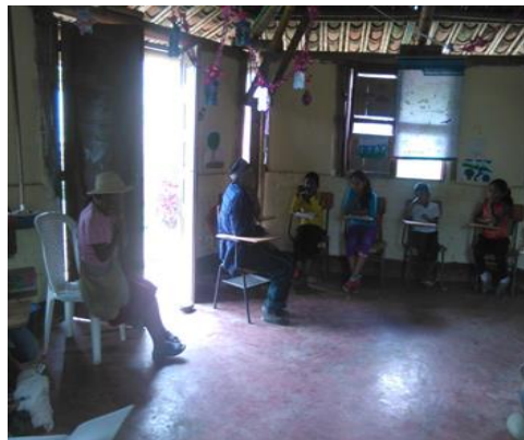
Fotografía 14 – Compartiendo conocimientos

En nuestra lengua materna (nasa yuwe) y en español esto les permite a los estudiantes tener una mejor comprensión al conocimiento. La mayoría de niños y niñas, son hijos de familias jóvenes que depende de la agricultura, pero no tienen en cuenta las prácticas culturales a la hora de realizar las siembras agrícolas, se les olvida la fase de la luna, no hay cuidado a la hora de ubicar las semillas, esto hace que se pierdan mucho espacio de terreno y de semillas son muy pocas las familias que practican las creencias a la hora de realizar cualquier de las actividades dentro de la huerta tul o en la finca. Cuando se realizan nuestras creencias en la agricultura hay buenas cosechas, mejorando la seguridad alimentaria e ingresos. Algunos estudiantes se desinteresan por muchos motivos. Unos porque no permanecen con los padres, otros porque no les gusta trabajar. Y los padres los dejan solos en las viviendas realizando otras actividades.