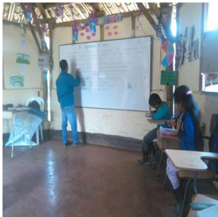
Fotografía 19 – Compartiendo los sueños

Con el análisis propuesto en las clases se identifican que los estudiantes si tiene muchas aspiraciones y sueños de salir adelante con el proyecto vida, muchos piensan continuar con sus estudios, otros trabajar en la agricultura, conductores de novelas, docentes, trabajar en el cabildo y en la alcaldía, son como los sueños de los estudiantes que tienen, solo uno de los estudiantes propone que el sueña ser un gran ciclista para competir a nivel nacional e internacional, al ver que uno de los estudiantes comenzó despejando las dudas, se alarmo como las aspiraciones de habla y de poner en debate, pero en su gran mayoría empezaron a imaginar y a proponer situaciones que no conocían en su realidad.