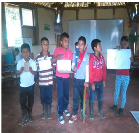
Fotografía 12 – Los estudiantes exponen

Después de una larga reflexión cada uno de los estudiantes plasmaran en sus cuadernos la línea de tiempo, con esta actividad les permite hacer memoria y de dejar evidencia de cada paso que damos. Con esto se busca que todos los niños participen y den a conocer su pequeña historia. Como es de conocimiento muchos realizan preguntas de lo que se va a realizar y como lo pueden explicar. Dodo es un momento de mucho análisis y reflexión de los estudiantes. Al terminar el tiempo disponible se procede a la socialización de la línea de tiempo por parte de los estudiantes.