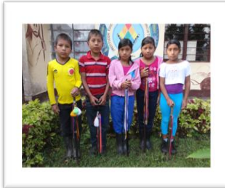
Fotografía 3 – Cabildo estudiantil

Las recomendaciones que realizan los cabildos a los demás estudiantes es el cumplimiento del horario, leña, revuelto, el aseo en los salones y en los alrededores del colegio para tener armonía y equilibrio en los estudiantes, en algunas ocasiones debe aplicar el remedio (castigo) si algún estudiante rompe alguna recomendación establecida en el manual de convivencia que tiene en cada establecimiento educativo.