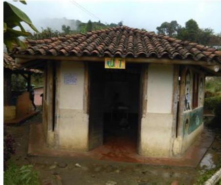
Fotografía 9 – Salón del grado 5

Después de las orientaciones tanto del cabildo escolar y de los docentes los estudiantes se desplazan a cada uno a los salones para atender las clases. Los 16 estudiantes(a) del grado quinto de primaria dan la bienvenida, de esta manera da inicio de presentación personal y agradecimiento por el espacio concedido para el desarrollo de las P.PE.