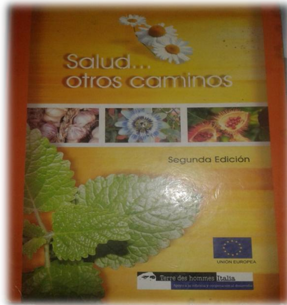
Foto No 12. Texto de apoyo utilizado para las clases de práctica pedagógica.

contrastes en cuanto a la forma de uso y la preparación en diferentes zonas del país e incluso por fuera de él.