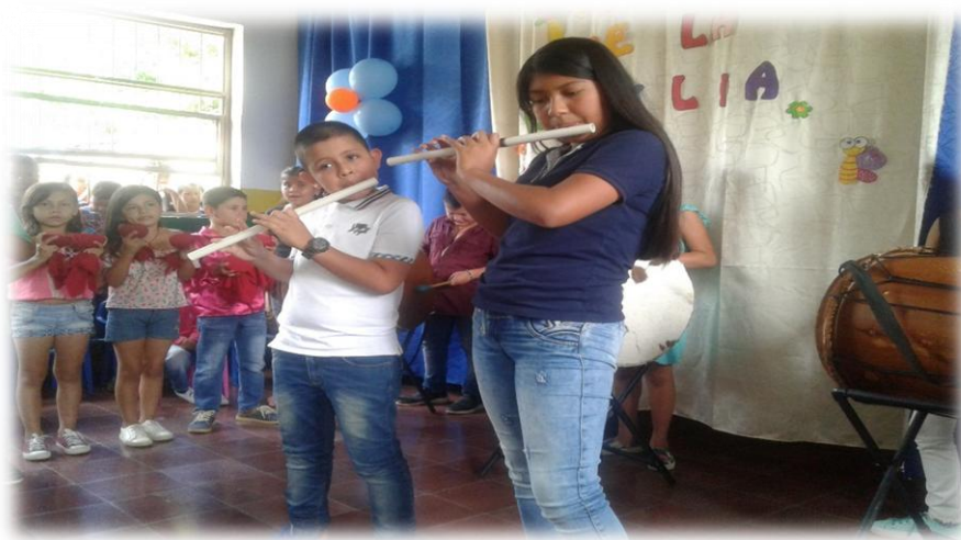
Foto No 29. Mostrando resultados del trabajo con la chirimía en la celebración del día de la familia, escuela de Lerma.

Para el desarrollo de estos talleres no tuve un espacio en el horario de clases, sino que debimos encontrar espacios en horas de la tarde para los ensayos. La institución me facilitó los instrumentos y las instalaciones de la biblioteca donde nos reunimos todos los martes y miércoles a las cinco de la tarde.