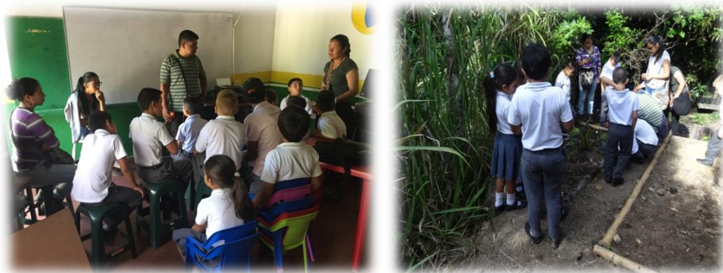
Foto No 25 y 26. Conversatorio estudiantes de grado cuarto y estudiantes de la Licenciatura en Etnoeducación.

Posteriormente de la experiencia de la ruta de la coca, el día 24 fue la visita a la escuela a los niños de grado cuarto. Con ellos se hizo la presentación en la que también estuvo la profesora titular. Luego pasamos a conocer la huerta y los niños aprovecharon el tiempo para echarle agua a las plantas.