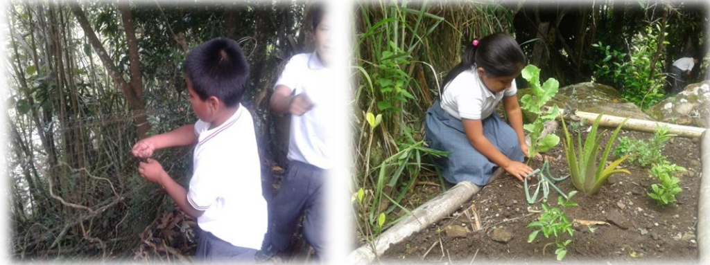
Foto No 16 y 17. Los niños y niñas haciendo mantenimiento al cerco de la huerta y limpieza a las plantas medicinales.