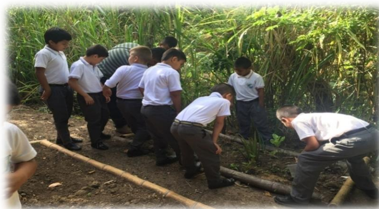
Foto No 9 niños de grado cuarto en cuidado de las plantas medicinales.

Entonces, fue a través de los proyectos de aula que se logró que los niños y las niñas aprendieran de acuerdo con la realidad del contexto, de manera colectiva y no individual, es decir los estudiantes no se dedicaron solo a escuchar al practicante dentro del salón, sino que conocieron otros escenarios donde también pudieron aprender.