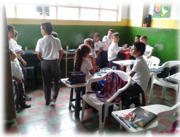
Foto No 5. Niños y niñas grado cuarto departiendo en el desayuno escolar en el salón de clase.