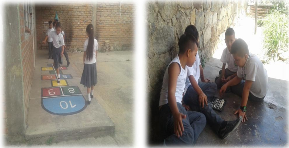
Foto No 6 y 7 niños y niñas en horas de descanso disfrutando de algunos juegos.

En cuanto al tiempo de descanso, en general lo ocupan con algunos juegos de mesa como el ajedrez, mientras que otros prefieren salir y jugar en el patio de la escuela.