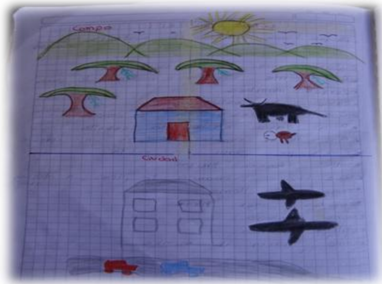
Foto No 14 Dibujo realizado por un niño de grado cuarto, mostrando el contraste campo y ciudad.

Terminado el dibujo en el cual se demoraron porque fue mucho lo que vieron, seguimos a planear como vamos a sembrar las plantas medicinales. Realizamos una lluvia de ideas para la consecución de semillas y llegamos al acuerdo que cada uno incluyéndome, conseguiríamos con nuestros padres, vecinos y con quien nos pudiera colaborar las semillas de las plantas y yo me encargaría de preparar el terreno y dejarlo listo para la siembra.