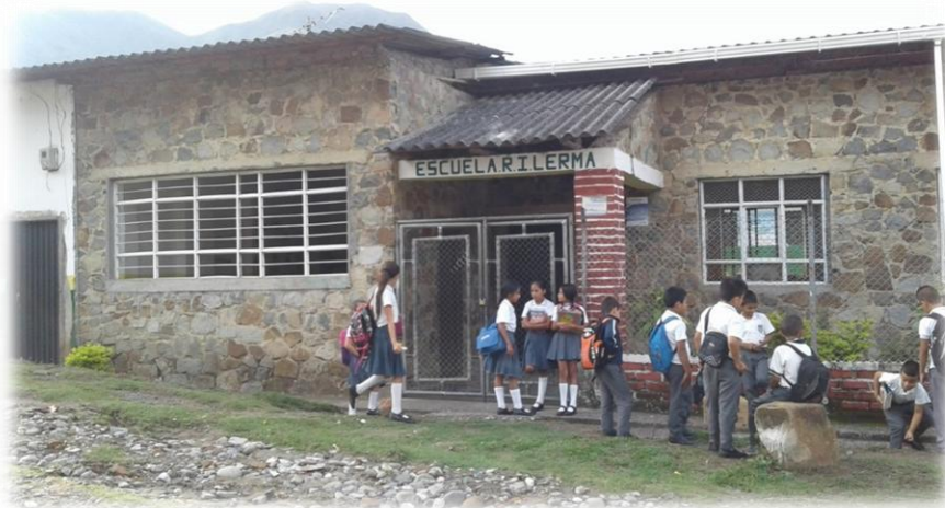
Foto No 4. Escuela de piedra ubicada en el barrio Brisas del corregimiento de Lerma

La escuela en donde se llevó a cabo la práctica pedagógica etnoeducativa, está ubicada en la cabecera corregimental, Lerma. Contaba a 2018 con 74 estudiantes y tres docentes nombrados, quienes se dividieron los grupos de tal forma que cada docente trabajaba con dos grados.