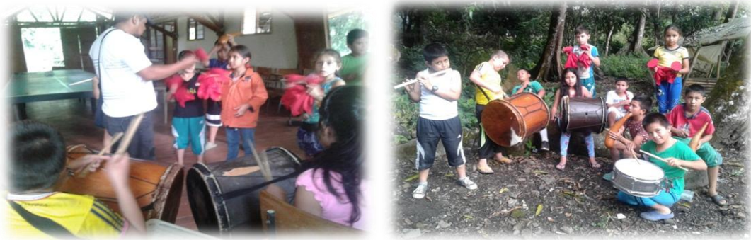
Foto No 27 y 28. En clase con el grupo de chirimía de la escuela de Lerma.

Específicamente lo que hice fue empezar con la recuperación de la música tradicional de chirimía que estaba desapareciendo de nuestro corregimiento a causa de la pérdida de la plaza docente de música.