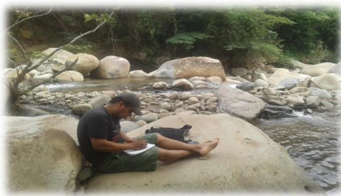
Foto No 11 preparando clase en horas de la tarde en el río Sánchez ubicado a dos minutos de Lerma

Por lo anteriormente mencionado, la preparación de clases las realicé en horas de la tarde y recurrí a un lugar que me agrada frecuentar, como es el río Sánchez.