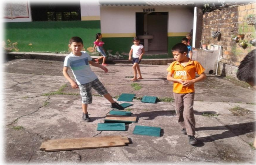
Foto No 18. Trabajo manual en tabletas para marcar con nombre de las plantas y sus propiedades curativas.

Utilizamos material como pintura, tabla y clavos, Que fueron conseguidos por los estudiantes.