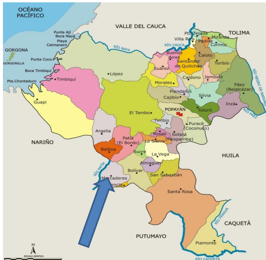
Foto No 1. Ubicación corregimiento de Lerma Cauca.

El corregimiento de Lerma se encuentra ubicado al sur de Colombia en el departamento del Cauca, municipio de Bolívar, a cuatro horas de la ciudad capital, Popayán.