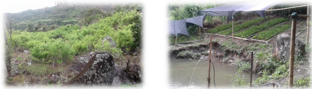
Foto No 2 y 3 Cultivos de coca como base principal de la economía lerneña y la piscicultura como otra alternativa de sustento. (Tomadas por W. Ibarra, 2018)

Teniendo en cuenta el relieve del corregimiento es de resaltar que posee los tres climas, cálido, templado y frío donde se destacan algunos cultivos tales como: caña, café, frijol, maní, maíz, yuca y hortalizas; así mismo renglones productivos como la piscicultura, avicultura y ganadería a baja escala. Lo anterior representa parte de la economía de algunas familias que habitan en el corregimiento y que han encontrado otra alternativa para darles educación a sus hijos.