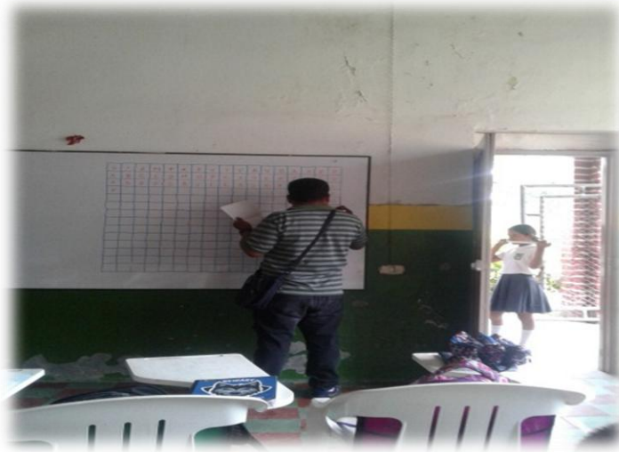
Foto No 13 Sopa de letras para realizar en clase, con los temas trabajados hasta la fecha.