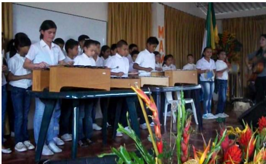
Audición el día 18 de mayo de 2012 – Conmemoración del Día de la Madre Aula Múltiple - Institución Educativa Concentración Escolar Guillermo Valencia