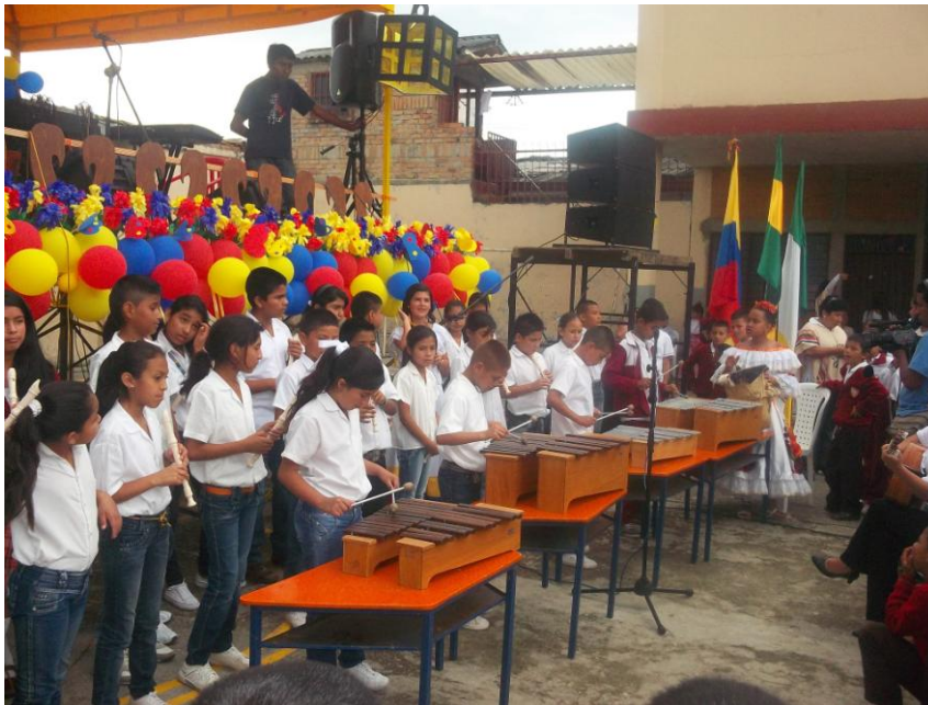
Audición el día 9 de noviembre 2012– 9º Encuentro de Música Colombiana Institución Educativa Concentración Escolar Guillermo Valencia