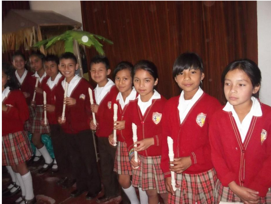
Audición el día 22 de noviembre 2011 – despedida de clases estudiantes de básica primaria (Jornada vespertina).