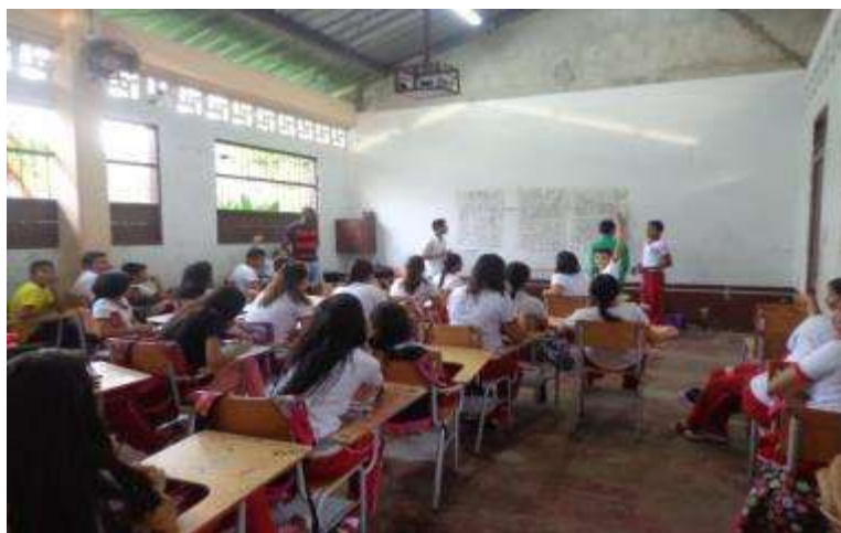
Figura 16. Socialización de actividades