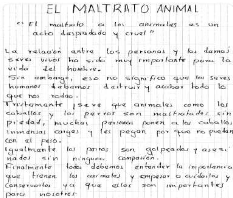
Figura 8. Texto final No. 3 El maltrato animal