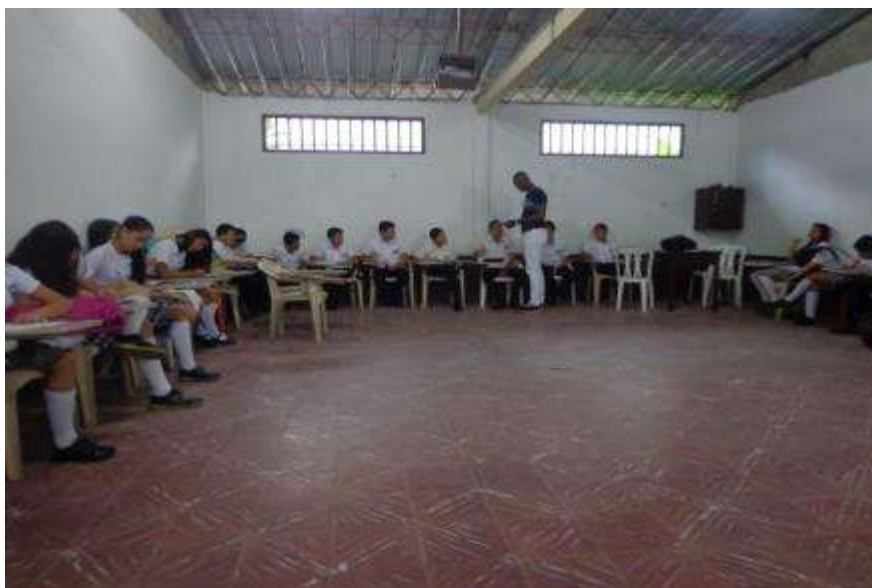
Figura 17. Construcción del texto final