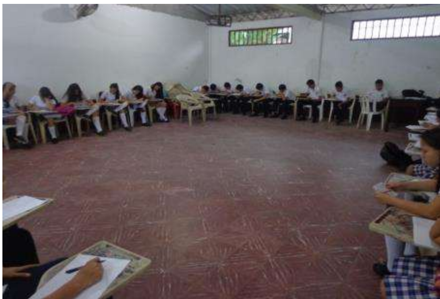
Figura 12. Escritura del texto inicial