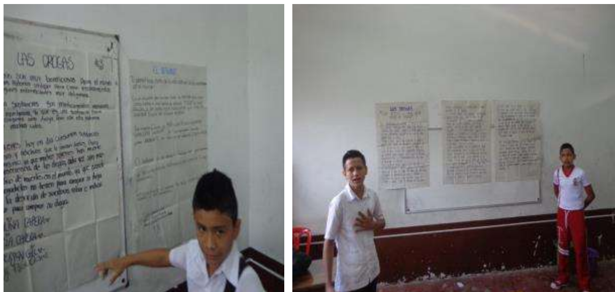
Figura 18. Socialización del trabajo final