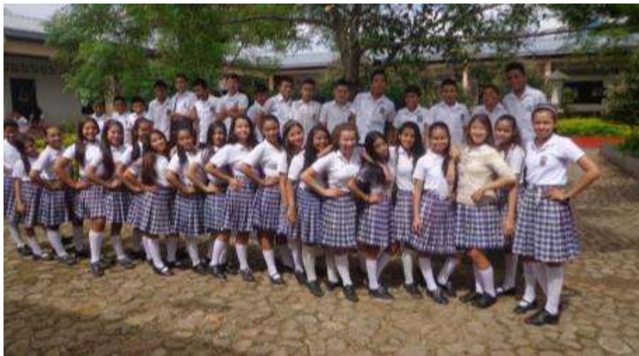
Figura 11. Población objeto de estudio (Grado noveno A)