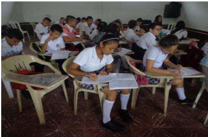
Figura 13. Desarrollo de actividades para el uso de conectores