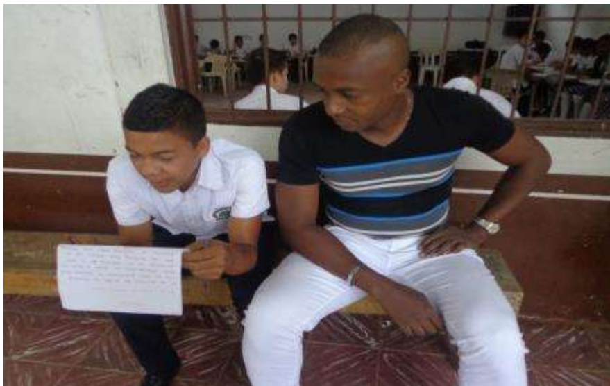
Figura 14. Acompañamiento y retroalimentación desarrollo de actividades.