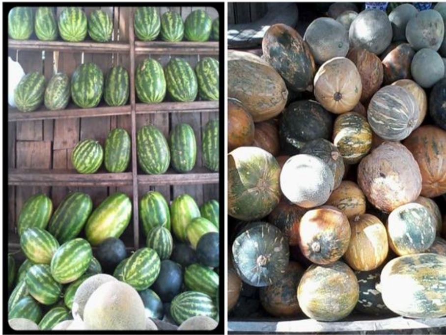
Figura 4. Productos de la Región

Es importante decir que la actividad ganadera extensiva se lleva acabo principalmente por latifundistas quienes poseen gran parte de la tierra, mientras la actividad agrícola es desarrollada por minifundistas.