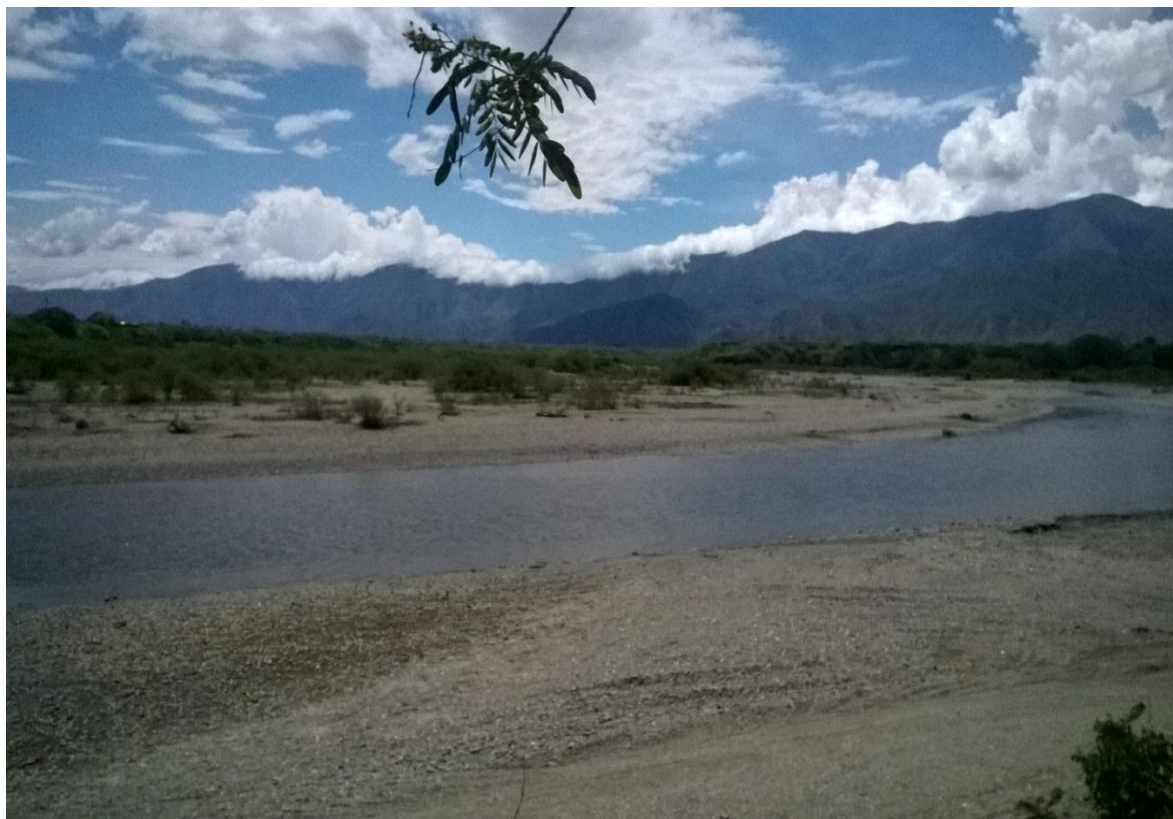
Foto 2. Impactos Ambientales de la minería ilegal en los ríos del Valle del Patía

familias de la región; pero hace ya aproximadamente 5 años se ha convertido en una actividad a gran escala con impactos negativos al medio ambiente, contaminación del mercurio en los ríos e impactos a nivel cultural.