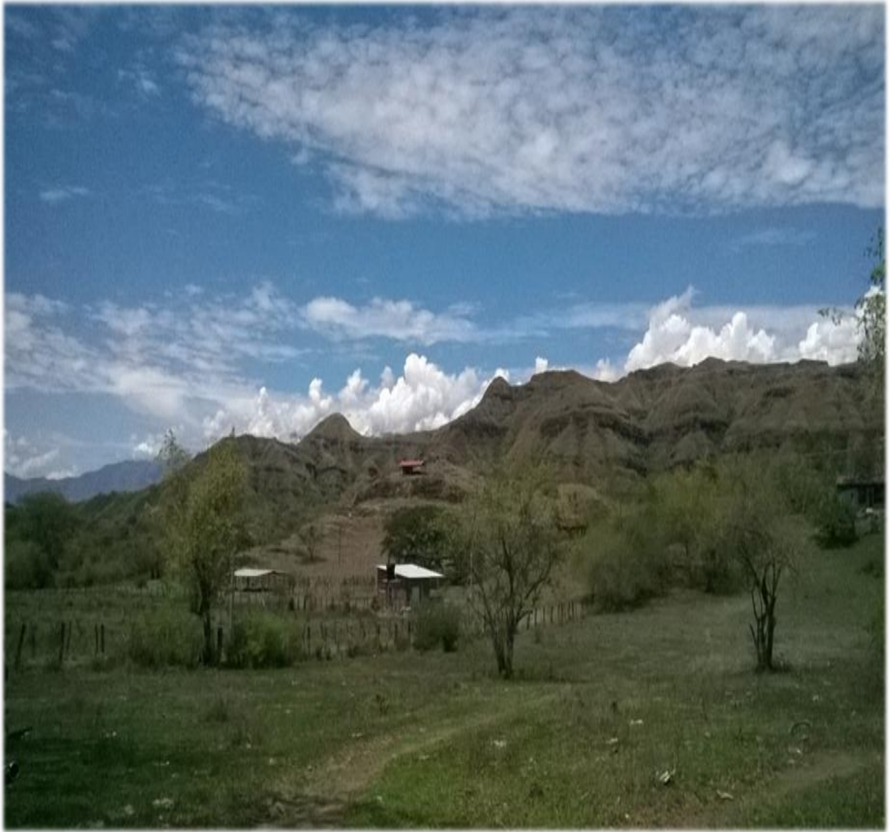
Figura 5. Fotografía Panorama del Cerro del Manzanillo

Dos fragmentos de entrevistas compiladas nos presentan otra imagen que se construye entorno al Cerro de Manzanillo.