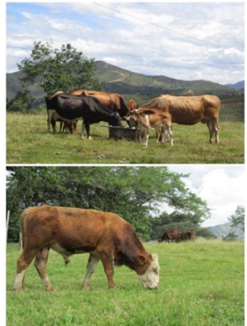
Figura 1: Fotografía actividad ganadera

Otros tipos de economía en la región son la industrial, el comercio y otras actividades dentro de las cuales están presentes trabajos informales. Entre estas actividades sobre sale la minería ilegal que en un primer momento fue la minería artesanal o a pequeña escala, la cual servía como medio de sustento para muchas