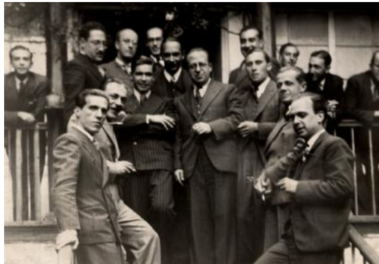
Fundadores de la Radiodifusora Nacional de Colombia.