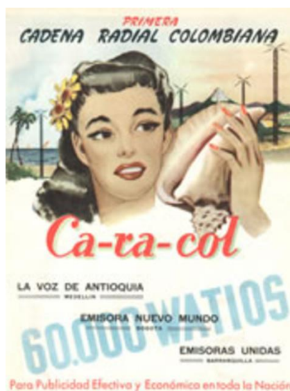
Figura 5 226

la función de encadenar una sola voz o programación por parte de la Cadena Radial Colombiana hacía los distintos lugares del país donde existían otras emisoras, fue así que “en 1950 Caracol otorgó a la radionovela un puesto definitivo en la programación normal con la transmisión de “El Derecho de Nacer”; radio novela cubana de Félix B. Cagnet y “El Ángel De la Calle” de Efraín Arce. Además el género fue estimulado porque los anunciantes han manifestado una preferencia a patrocinar espacios con radionovelas. Juzgaban que la acogida del público y su masiva sintonía representaban potenciales consumidores” 225 y altos ingresos económicos para los dueños de cadenas radiales, y para el sector comercial.