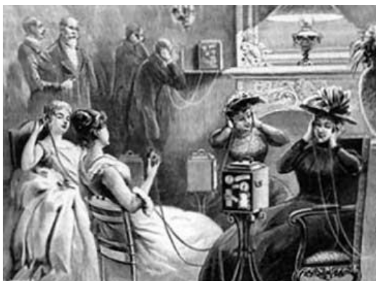
Modelo De Teléfono Hirmondo ofreciendo servicios de telefonía a suscriptores.