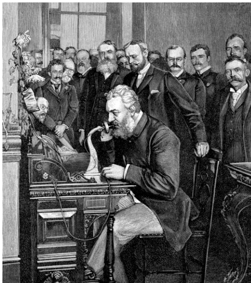
Alexander Graham Bell realizando pruebas con uno de los primeros prototipos de Teléfono.

Para el año de 1877, Bell comprometido con el crecimiento de la telefonía crea la National Bell Company , primera compañía de gran importancia para el crecimiento y expansión de la telefonía, este proceso de desarrollo se dio inicialmente en Europa para después expandirse a Estados Unidos, “había demostrado ofrecer al mundo una visión que él mismo llamó un gran sistema, algo que podría parecer utópico, una, red universal que llegara a los hogares, oficinas y lugares de trabajo. ” 9 Así mismo, para el óptimo funcionamiento de la telefonía, se debía establecer el conmutador y la central , éstas estaban a cargo de un operador para su normal funcionamiento y para que el proceso de la transmisión de la voz se diera con éxito. También, fueron de valiosa importancia los aportes de científicos interesados en la evolución del teléfono, que con otras patentes, ideas y modelos del mismo dieron pautas para el crecimiento del sistema telefónico.