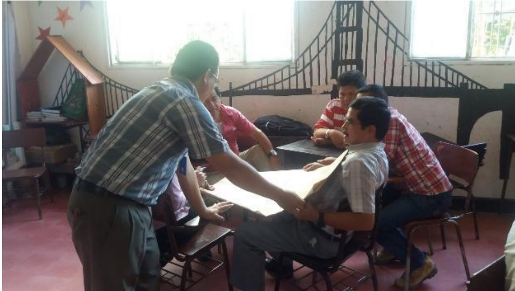
Figura 6. Ideas Educativas para la Paz

Realizado el análisis e interpretación de las reflexiones compartidas por los estudiantes, los maestros y los padres de familia, pensando en la necesidad de brindar a los educandos herramientas que les permita enfrentar las nuevas realidades sociales y asumir responsablemente su proyecto de vida, se presentan los aportes como propuesta para enriquecer las prácticas de manera transversal a la construcción de la paz, es decir, que sirvan para la construcción de una cultura de la sana convivencia y la comprensión y apropiación de la realidad nacional y local.