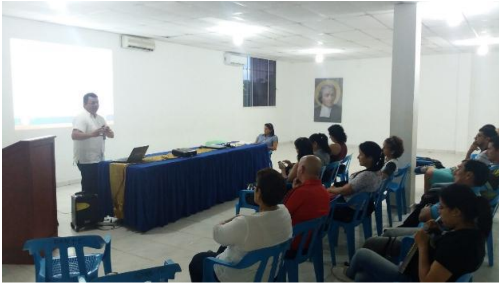
Figura 1. Socialización de la Propuesta

implementación. La cual fue bien recibida en tanto que la institución está en el proceso de fortalecer el énfasis institucional como constructores de paz. (Ver figura 1)