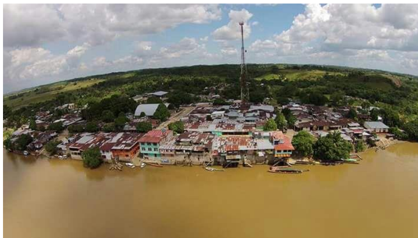
Figura 1- Vista aérea San Antonio

Fue fundada en 1988 mediante decreto 592 del 01 de noviembre de 1988 con modalidad agropecuaria. El caucho fue considerado el producto ideal para cultivar y procesar, con lo cual se pretendía alcanzar el auto-sostenimiento del establecimiento educativo. Sumado a esto, cuenta con una granja de 74 hectáreas que fue donada por el antiguo INCORA al colegio para que los estudiantes realizaran allí sus prácticas agropecuarias (Institución Educativa Angel Ricardo,