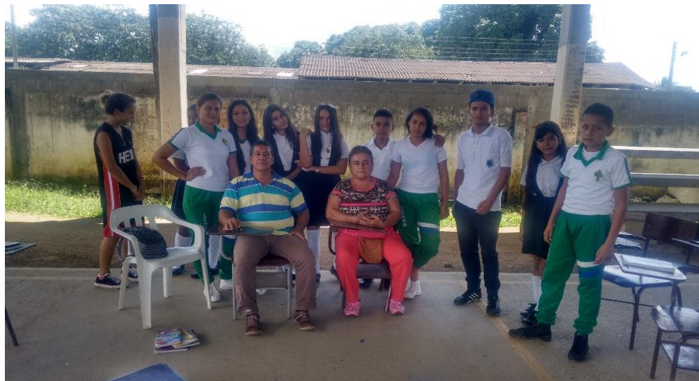
Figura 6- Conversatorio Habitantes de la comunidad

Recuperar la memoria histórica del conflicto local, obliga a ampliar el abanico de fuentes para incluir algunas como las orales, que se convirtieron en información de primer orden para la intervención. Simultáneamente, recurrir a los recuerdos de personas que por décadas han vivido en la localidad, garantiza una mirada amplia de la realidad que gira en torno al contexto educativo