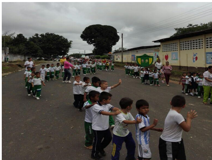
Figura 12. Desfile día institucional

Por otra parte, en el desfile por las calles de la comunidad se llevaron frases alusivas a la convivencia y la paz, se contó con el acompañamiento de los padres de familia y entidades representativas de la inspección, quienes fueron invitados previamente al evento, y cuya participación entusiasta contagió a la misma población, viviéndose momentos de euforia y