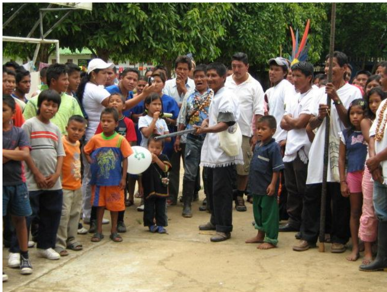
Figura 2- Comunidad korebaju

Los niños y niñas del grado séptimo son participes activos de actividades deportivas, especialmente micro futbol, así como de actividades culturales organizadas por la institución. Hasta el momento no existen programas que estén orientados para el aprovechamiento del tiempo libre, igualmente, en la localidad no se controla el ingreso de menores de edad a establecimientos