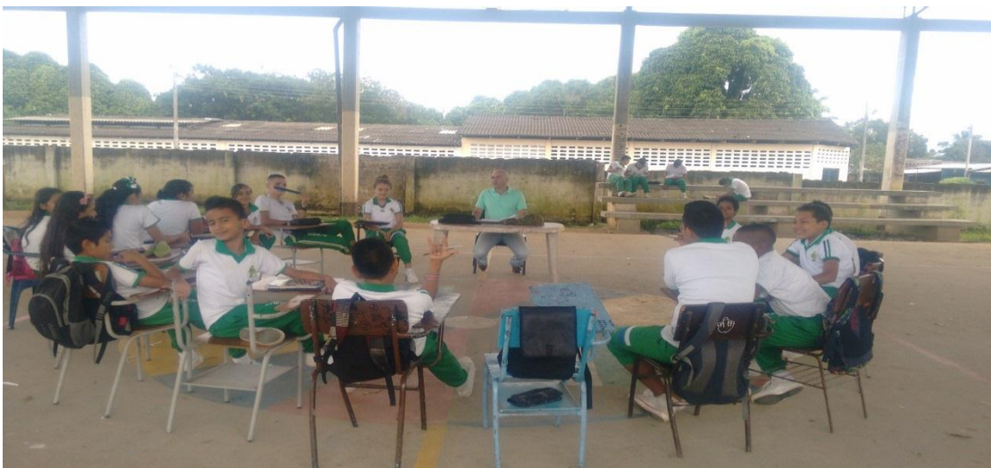
Figura 3 - Taller con estudiantes

Las narraciones de vivencias se precisan justamente para recordar lo pasado, no con el fin de perpetuar el dolor, sino de reconocer lo sucedido, basados en la vieja sentencia de que un pueblo que no conoce su Historia está condenado a repetirla (Zuluaga Aristizábal, 2014).