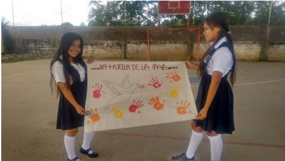
Figura 9-La huella de la esperanza

voluntariamente. Se coordinaron dos jornadas: una para la elaboración de la cartografía social y la otra para el proceso de socialización y evaluación.