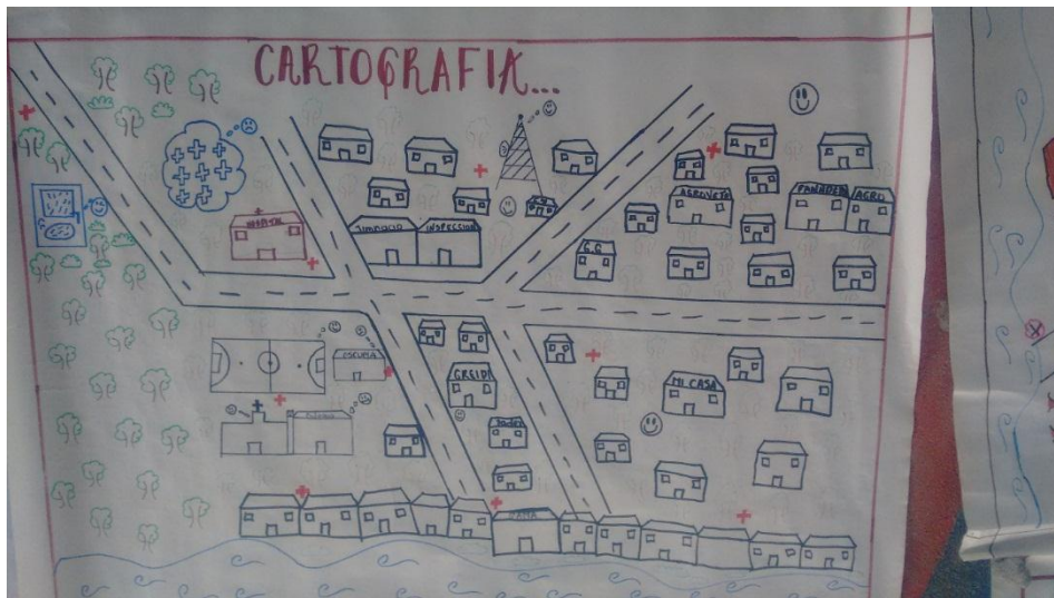
Figura 7. Cartografía Social

Por medio de la implementación de la metodología de cartografía social se pretendió identificar, junto a los niños y niñas del grado séptimo, la huella de dolor ocasionado por el conflicto armado que por varios años marcó el contexto de la Institución Educativa Ángel Ricardo Acosta. Para ello, se realizó un estudio minucioso de la metodología y de cómo orientarla en el proceso con niños y niñas, para, de esta manera, garantizar el éxito de su aplicación. Este ejercicio fue direccionado dentro del marco de competencias ciudadanas de convivencia y paz, específicamente la competencia: Reconozco el conflicto como una oportunidad para aprender y fortalecer nuestras relaciones.