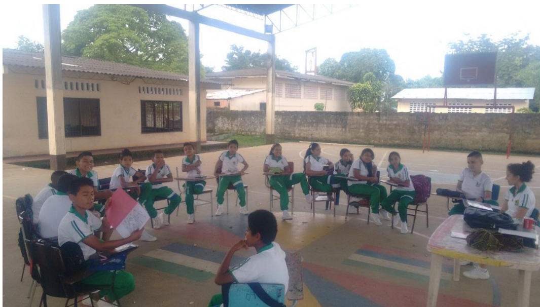
Figura 5- Socialización Historias de Vida

Los estudiantes tuvieron un encuentro con sus padres o familiares cercanos para que ellos les compartieran sus historias de vida. El objetivo fue que los niños realizaran una serie de preguntas que les permitieran conocer situaciones en las que se vieron involucradas sus familias y en muchos casos ellos mismos.