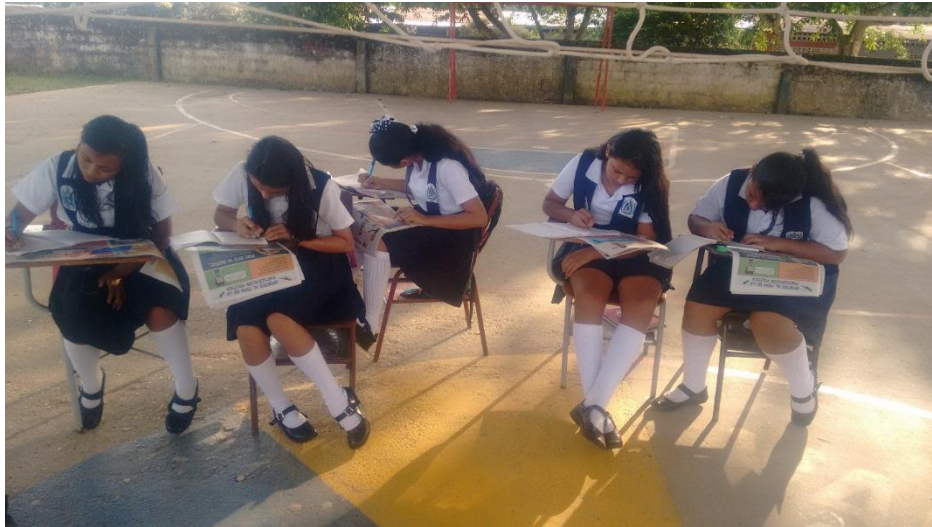
Figura 11- La noticia: una mirada crítica