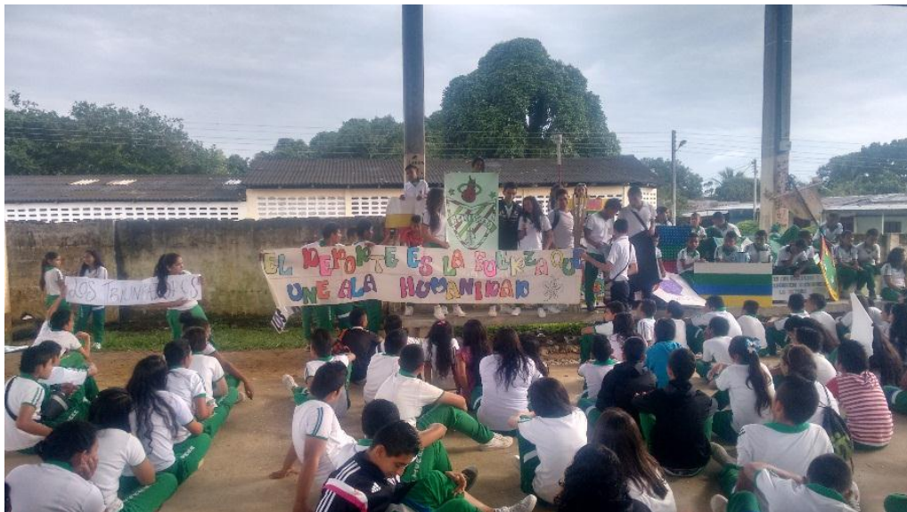
Figura 13- Jornadas culturales y deportivas

La convivencia escolar es “el proceso cotidiano de interrelación que se genera entre los diferentes miembros de una comunidad escolar” (MinEducación, Convivencia escolar y resolución de conflictos, sf). Su mejora inicia con la responsabilidad compartida de todos los miembros de la comunidad educativa, y todos los implicados, directa o indirectamente, en la formación del joven: familia, profesorado, instituciones, agentes sociales, entre otros (Mestres, 2016), esto con el objetivo de enfocar la educación integral del alumnado para la convivencia y la