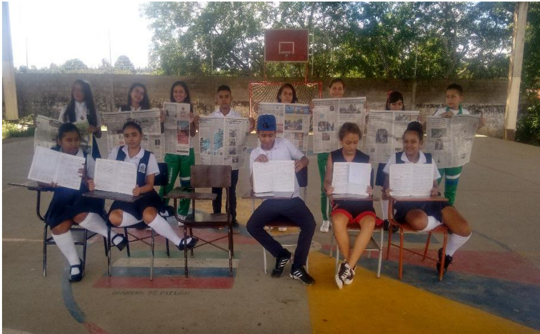
Figura 10- La noticia una mirada crítica del conflicto

Comparte con mis compañeros la experiencia.