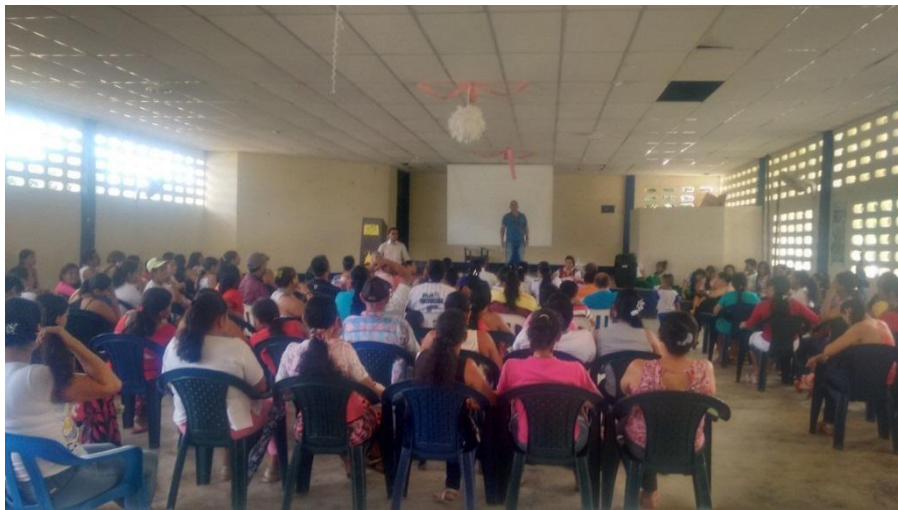
Figura 4. Reunión con padres de familia

El taller inició con el saludo de bienvenida a los padres participantes, la presentación de cada uno de ellos y la entrega de materiales para la actividad (papel periódico, marcadores, temperas). Se presentó la agenda de trabajo y las recomendaciones para el ejercicio.