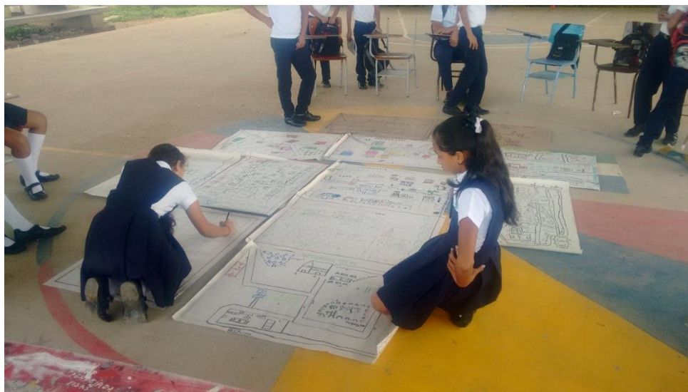
Figura 8- Cartografía la huella del dolor