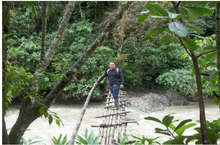
Foto 5, puentes improvisados con troncos de árboles. Tomada septiembre de 2011.

A la vez se presentan otro tipo de problemas alrededor de las condiciones del territorio y del clima, una de ellos es la destrucción de puentes que no vuelven a ser construidos y se convierten en un peligro, porque ante la necesidad los usan en mal estado o los construyen a base de troncos de árboles amarrados con “bejucos” y sinchos”, que provee la misma naturaleza, poniendo en riesgo la vida de los habitantes del sector.