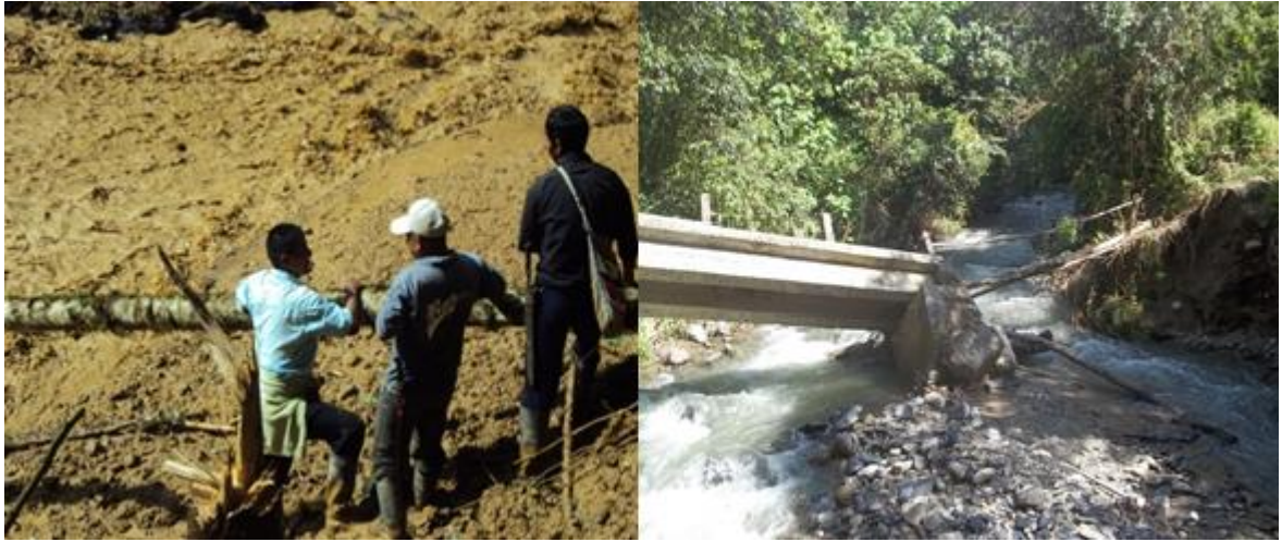
Foto 3 y 4, avalancha y caída del puente sobre el río Ingito. Tomada septiembre de 2011.

A la vez se presentan otro tipo de problemas alrededor de las condiciones del territorio y del clima, una de ellos es la destrucción de puentes que no vuelven a ser construidos y se convierten en un peligro, porque ante la necesidad los usan en mal estado o los construyen a base de troncos de árboles amarrados con “bejucos” y sinchos”, que provee la misma naturaleza, poniendo en riesgo la vida de los habitantes del sector.