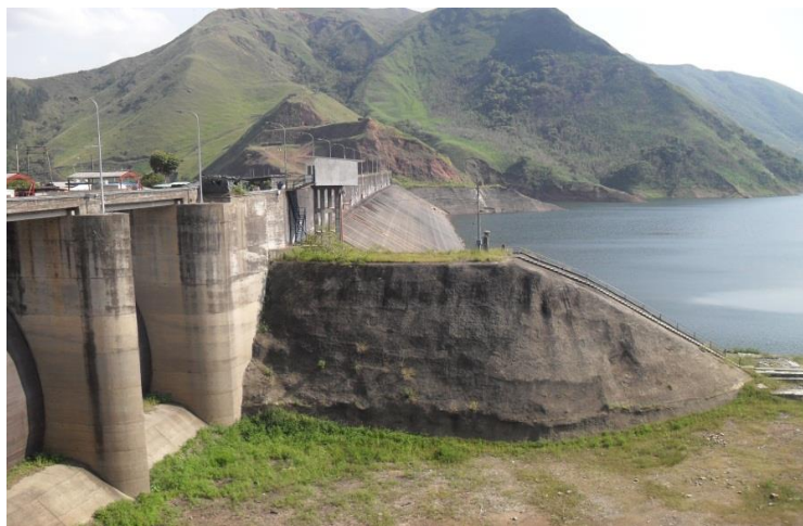
Foto 2, represa de la salvajina en el municipio de Suarez. Tomada junio de 2011.

De otro lado, la Represa de la Salvajina se ubica en inmediaciones de los municipios de Suarez, Morales y Buenos Aires, sobre la cordillera occidental. Dicha represa fue construida en 1985 por la CVC bajo políticas de generación de energía eléctrica y con expectativas de desarrollo para las áreas de influencia. Se proyectó además la construcción de obras de infraestructura en salud y educación, al igual que la construcción de carreteras, puentes, electrificación y un uso potencial del suelo.