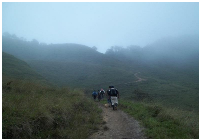
Foto 4, vías de acceso a la zona de resguardo. Tomada septiembre de 2011.

Afirman los comuneros que ante la necesidad de vías de acceso recurren a su propia elaboración donde a pico y pala abren sus propias vías de acceso, las cuales se les considera como “caminos de herradura”, construidos bajo la figura de la minga, concebida por los indígenas como una “junta de trabajo, una manera de solucionar colectivamente problemas prácticos” 70 , es una práctica que además fortalece los lazos de amistad, solidaridad y compañerismo entre los comuneros, en ella trabajan juntos hombres, mujeres, ancianos y niños, donde comparten además la merienda que se prepara para la hora del almuerzo 71 .