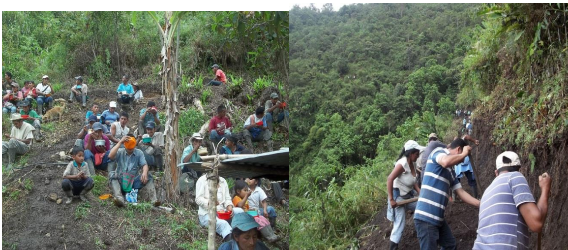
Foto 5 y 6, mingas comunitarias de trabajo y construcción de caminos a pico y pala. Tomadas septiembre de 2011.

Afirman los comuneros que ante la necesidad de vías de acceso recurren a su propia elaboración donde a pico y pala abren sus propias vías de acceso, las cuales se les considera como “caminos de herradura”, construidos bajo la figura de la minga, concebida por los indígenas como una “junta de trabajo, una manera de solucionar colectivamente problemas prácticos” 70 , es una práctica que además fortalece los lazos de amistad, solidaridad y compañerismo entre los comuneros, en ella trabajan juntos hombres, mujeres, ancianos y niños, donde comparten además la merienda que se prepara para la hora del almuerzo 71 .