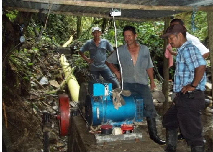
Foto 4, planta de acueducto improvisado en el resguardo de Honduras. Tomada septiembre de 2011.

Afirman los comuneros del resguardo que ante la necesidad del servicio de acueducto en sus hogares decidieron unir esfuerzos y con algunas colaboraciones técnicas crear su propio acueducto, que aunque abastece del preciado líquido a las comunidades, no cumple con las expectativas de salubridad requeridas, enfrentando a las comunidades a un nuevo problema, su salud. No obstante, esto se convierte en una nueva obligación para el gobierno que ahora tendrá que atender un nuevo problema, el de salud pública.