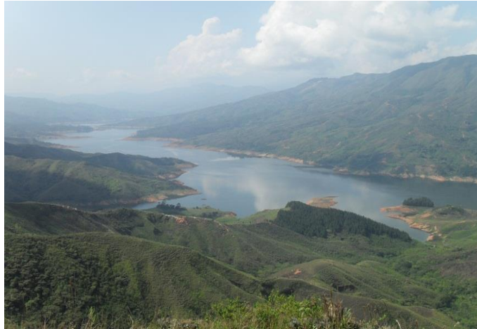
Foto 1, vista panorámica de la cordillera occidental en el municipio de Morales. Tomada junio de 2011

De otro lado, la Represa de la Salvajina se ubica en inmediaciones de los municipios de Suarez, Morales y Buenos Aires, sobre la cordillera occidental. Dicha represa fue construida en 1985 por la CVC bajo políticas de generación de energía eléctrica y con expectativas de desarrollo para las áreas de influencia. Se proyectó además la construcción de obras de infraestructura en salud y educación, al igual que la construcción de carreteras, puentes, electrificación y un uso potencial del suelo.