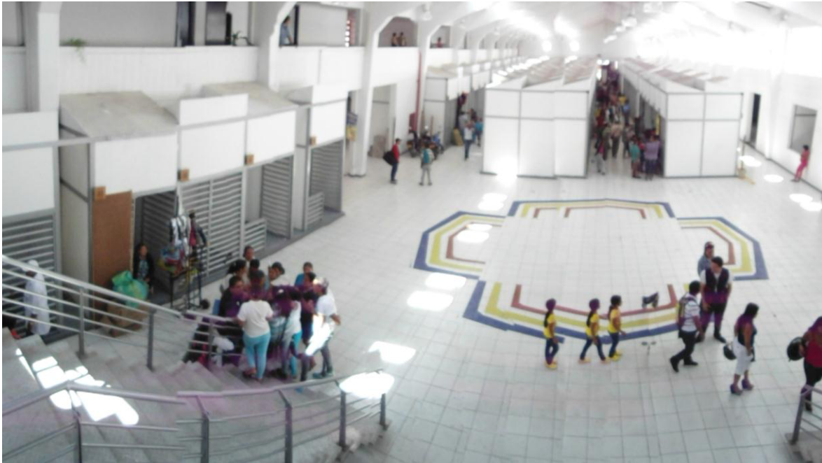
Centro Comercial el Empedrado 16 de Enero de 2013

Pero la tarea no puede quedarse ahí, y nos referimos a que no se puede dejar ocupar nuevamente los espacios recuperados con esta reubicación, es necesario buscar soluciones de fondo, por que como muchos sabemos quedaron por fuera personas que ejercen el comercio informal, puesto que no hacen parte de el fallo del tribunal, y que desean y les toca trabajar por sus familias en la calle, personas desplazadas que no encuentran en la ciudad una mejor estabilidad económica y laboral que esa.