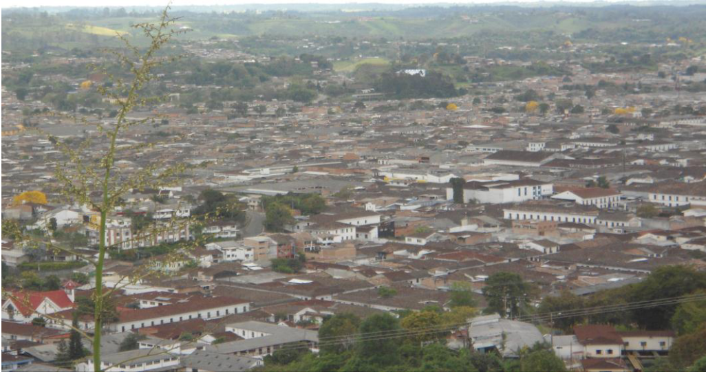
Popayán 20 de Octubre de 2012

Es por eso que el espacio público de ser visto como un escenario desde el cual la administración municipal, conjuntamente con la comunidad construya la nueva ciudad. En el que se inviertan recursos para reducir las desigualdades sociales y económicas que permitan mejorar la calidad de vida de los habitantes de la Ciudad Blanca. Es necesario darnos a la tarea de crear una política de cultura ciudadana que parta de quienes tienen el deber de proteger el Espacio Público, que en su mayoría no manejan el concepto en su integralidad. Para lograr crearlo con la ciudadanía y así permitirnos encontrar no solo pronta, si no eficaz respuesta a la problemática dando así