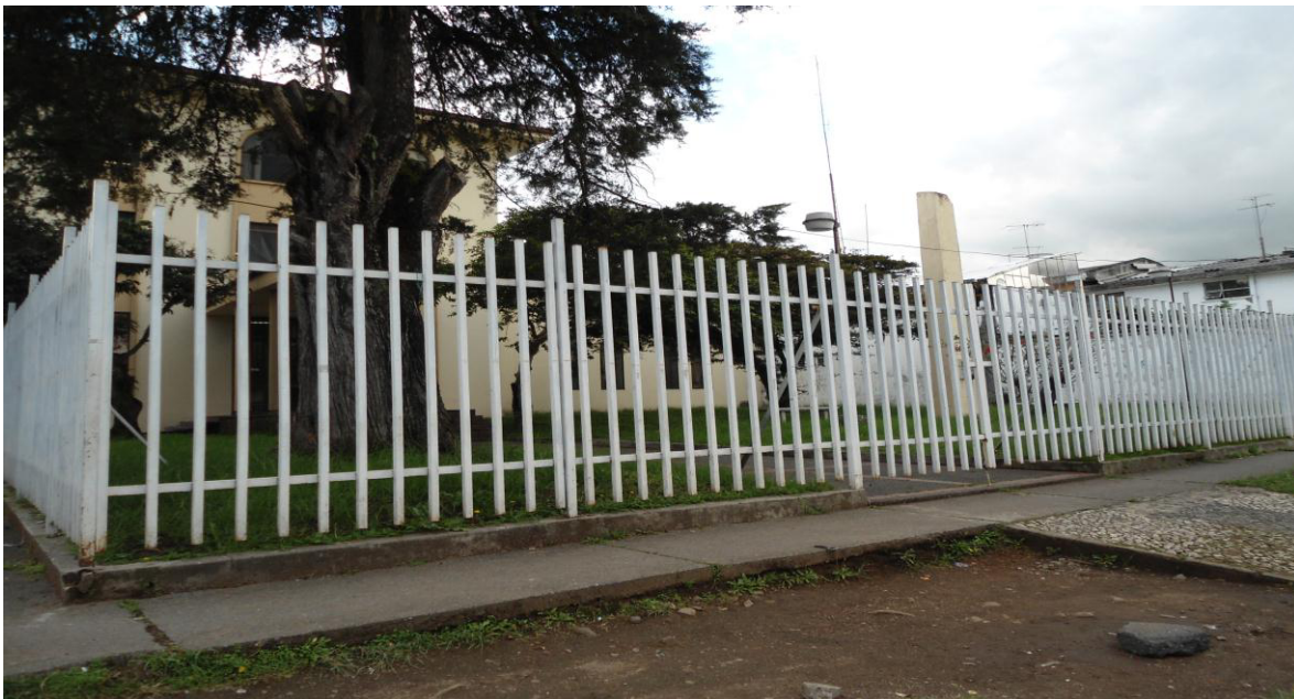
Parque El Eléctrico Octubre 20 de 2012