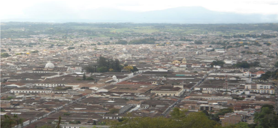
Foto tomada desde EL Cerro de las Tres Cruces. 10 de Enero de 2013