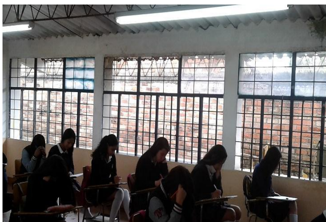
Ilustración 2: Observación directa, salón de clase.

Es así como el aula del grado decimo A de la Institución Educativa Julumito conserva ciertas características que evoca esos lugares penitenciarios, donde lo que menos se tiene en cuenta es la comodidad.