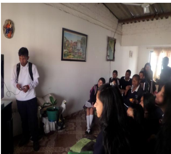
Ilustración 10: Actividad de clase donde se propicia la creación

Para efectos de conocerlos y saber más sobre sus percepciones de la vida, sueños y anhelos, se han hecho Komitivas, Konvivencias, consejos de clase. Quedando por hacer más clases amenas, kaminatas recreativas, y demás actividades con k (la idea de escribirlo diferente es por ke será escrito y propuesto desde el estudiante, quitándole un poco de protagonismo al docente) que nos permitan un mejor relacionamiento.