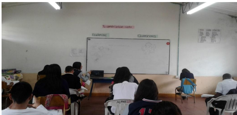
Ilustración 7: demostración de pacto de aula para permitir la participación.

De esta manera se concibe la frase: “tu opinión también cuenta”, la cual en momentos de adecuación y embellecimiento del salón fue colocada encima del tablero y dibujada en una de las paredes. Y es importante mencionar que en los momentos de necesaria participación esta idea servía para detenerse e insistir sobre la importancia de la opinión del otro y de cómo había que entornizarse, es decir sentirse parte de, dispuesto para, donde además con seguridad iba encontrar respeto y libertad de opinión.