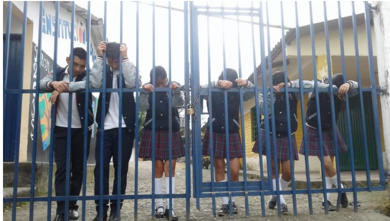
Ilustración 13: Necesitados de libertad.

Es necesario reflexionar sobre los diferentes simbolismos de control utilizados durante décadas en las escuelas, no con el ánimo de desaparecer lo que ha funcionado del modelo tradicional y que ha ayudado a dinamizar procesos de aprendizaje, sino para replantear acciones como: el juzgamiento del comportamiento y el desempeño de los estudiantes, relacionándolo directamente con una calificación numérica que nada tiene que ver con la integralidad del ser humano en cuestión; la dicotomía entre la autonomía del estudiante y lo que permiten los planes de asignatura, lo cual no permite se salgan de los esquemas establecidos, limitando con esto la creatividad; el escaso relacionamiento que se dan entre docente y estudiante debido a lo mitológico del asunto, creyendo que entre más lejanos este el uno del otro más respeto y entendimiento hay.