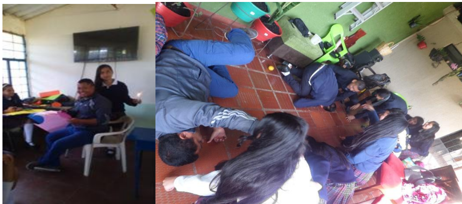
Ilustración 6: actividades lúdicas en clase, donde se privilegia la recreación.

Respetémonos y escuchémonos: en principio fue necesario determinar unos pactos de aula donde se predominará el respeto entre compañeros, ya que las intenciones eran de escuchar al otro y de tenerlo en cuenta, así no se opinará en ningún momento. Con esto, surgió entre ellos la necesidad de saber que opinaban los demás en las en ciertas temáticas o propuestas de momento. Algunos insisten en darle espacio a sus compañeros para que puedan hablar, muchas veces los intentos fueron fallidos. Es de aclarar que los que motivaban en el aula para estos momentos eran en su mayoría chicos con los cuales ya se había hecho un trabajo personalizado de atención y donde el proceso de autoconocimiento había sido eficaz, pues empezaron a mostrar cierto liderazgo en clase.