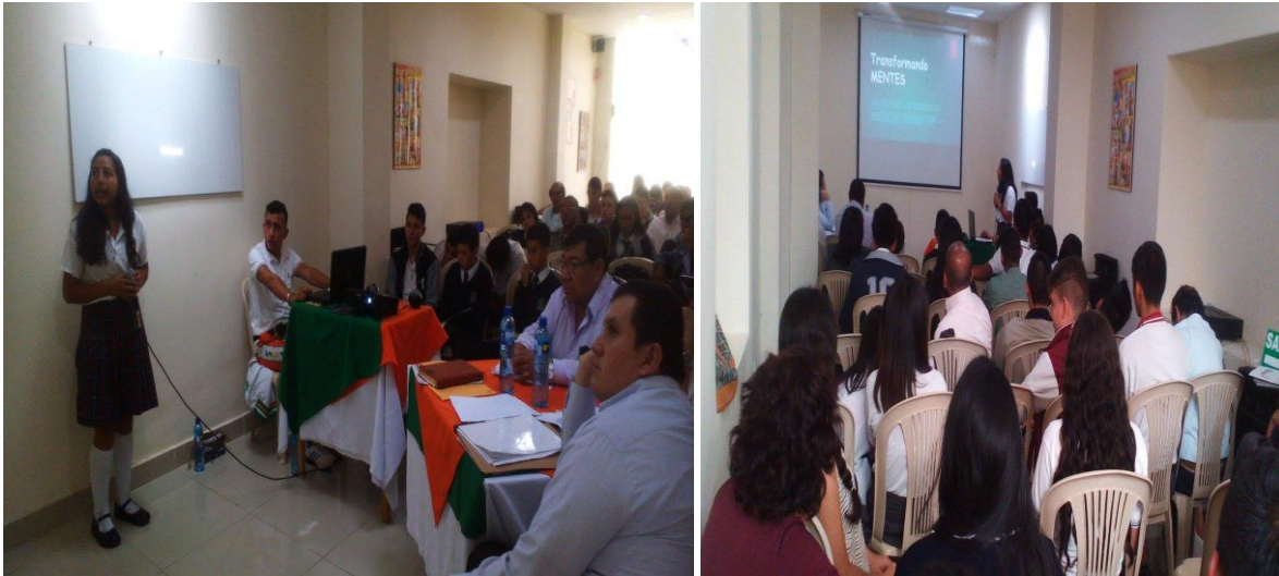
Ilustración 12: participación de estudiante de décimo grado en foro de ciencias políticas UTRAHUILCA 2016.

Como educadores, somos responsables del desarrollo de la dimensión cognitiva de nuestros estudiantes; pero tenemos igual responsabilidades en la formación de un individuo ético que se indigne ante los atropellos, se sensibilice socialmente y se sienta responsable de su proyecto de vida individual y social. No se trata de simplemente de transmitir conocimientos, como supuso equivocadamente la escuela tradicional, sino de formar individuos más inteligentes a nivel cognitivo, afectivo y práctico (de Zubiría, 2006).