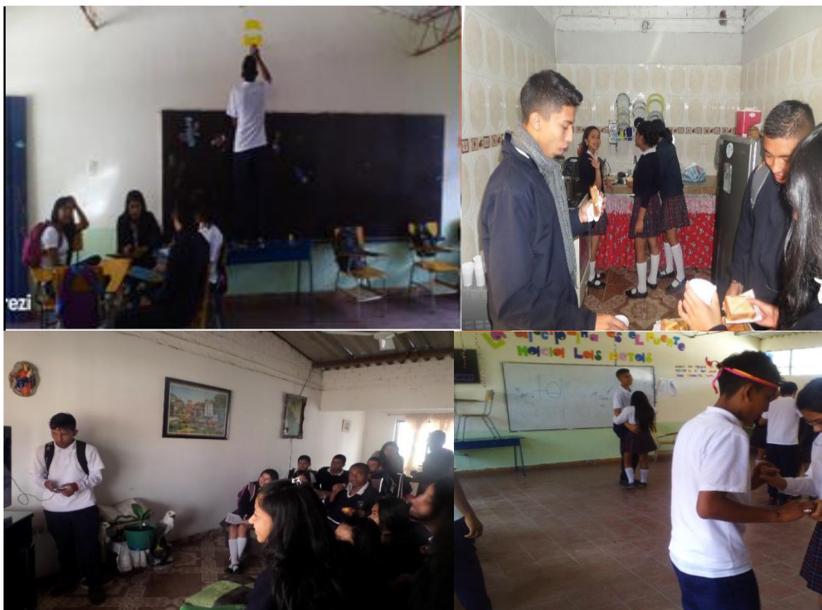
Ilustración 8: dinámica de clases donde la iniciativa la tiene el estudiante.

Es de mencionar que siempre se trató de desaparecer la imagen de profesor del frente para que sintieran más confianza de ser como ellos son, pues al saber que están con el profesor les limitaba su actuar.