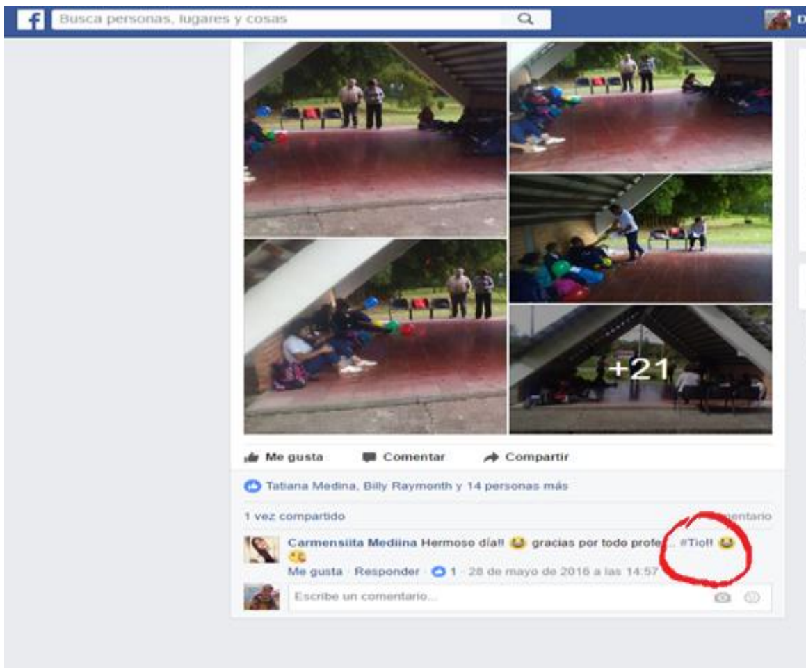
Ilustración 9: expresiones emotivas de estudiante después de taller.

El compartir con ellos momentos, emociones, preguntándole como están, escuchándolos, e implementando un saludo especial de abrazo. Permitió la entrada y aceptación a su clan. Se comprendió y se comprobó que el profesor limita o dinamiza el aprendizaje y el bienestar del estudiante y su actitud es factor clave para estas intenciones. Dice Céspedes (2009):