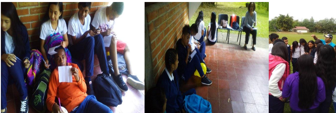
Ilustración 3: autorreflexión y fortalecimiento de relaciones interpersonales e intrapersonales.

sus hábitos. A esto se refiere Casassus afirmando que “Somos prisioneros de las emociones que emanan de nuestros contextos...cuando tomamos conciencia de ello, esta prisión se transforma en un espacio de posibilidades y de acción” (2015, p. 114)