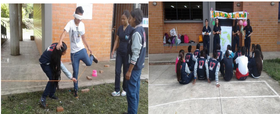
Ilustración 5: autoconfianza y autorreflexión

Esta propuesta de taller compagino directamente con las intenciones del proyecto de intervención debido a que en muchas actividades ejecutadas se fortaleció la confianza que se tenían entre compañeros, además de continuar con el objetivo del primer taller implementado