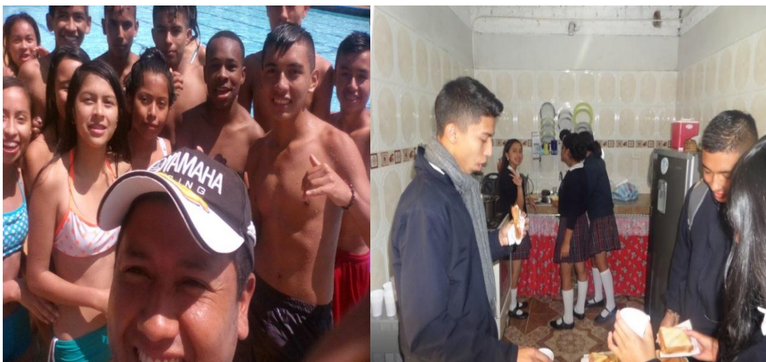
Ilustración 16: relacionamiento dentro y fuera del aula.

Los estudiantes en estos espacios dentro o fuera del aula han presentado una mejor disposición para interactuar y opinar sobre situaciones del contexto (esto ya en clase de Ciencias Sociales).