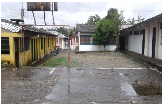
Ilustración 15: Sede Institución Educativa y salón Comunal, Julumito.

Ante esto el Rector de la Institución Educativa ha intentado mejorar un poco las condiciones de la infraestructura, pero con el gravante de que la parte donde pudiera invertir no tiene escrituras, por lo cual no habría justificación legal para poder hacerlo (dc1spdt35:En diálogos con el rector comenta su desanimo de invertir en esta sede, pues en los momentos que lo ha hecho las organizaciones comunitarias se han disgustado, pues gran parte de este espacio es compartido con la comunidad y además no se tiene escrituras de parte de la sede para justificar legalmente la inversión.)