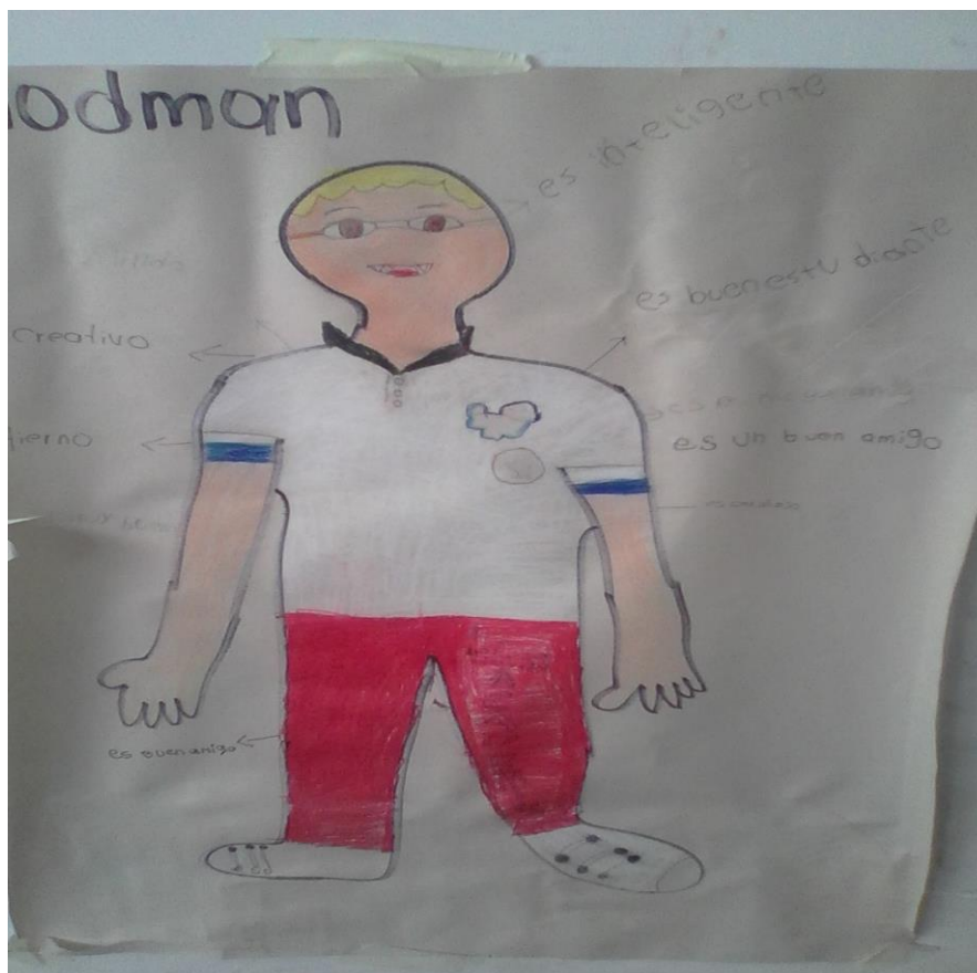
Dibujo realizado por Hodman Rivera

“Me quiero como soy” es la manera que tienen los niños para expresar el cambio frente a su autoimagen y autoconcepto y se ven representadas en los siguientes relatos: “Me siento bien conmigo misma” (SD3, T1, G2, E26, G: F). Aquí podemos apreciar cómo ellos se aceptan tal como son y logran alcanzar ese bienestar que a veces lo veían perdido. La estima que un individuo siente hacia su persona es importante para su desarrollo vital, su salud psicológica y su actitud ante sí mismo y ante los demás. “El concepto de sí mismo influye en la forma de apreciar los sucesos, los objetos y las personas del entorno” Roa García (2013, p. 142).