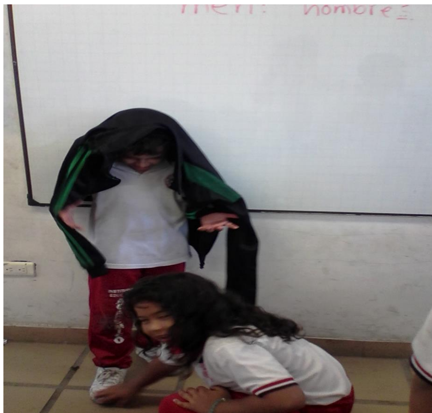
En una clase de Lengua Castellana, dramatizando la poesía “A mi burro”