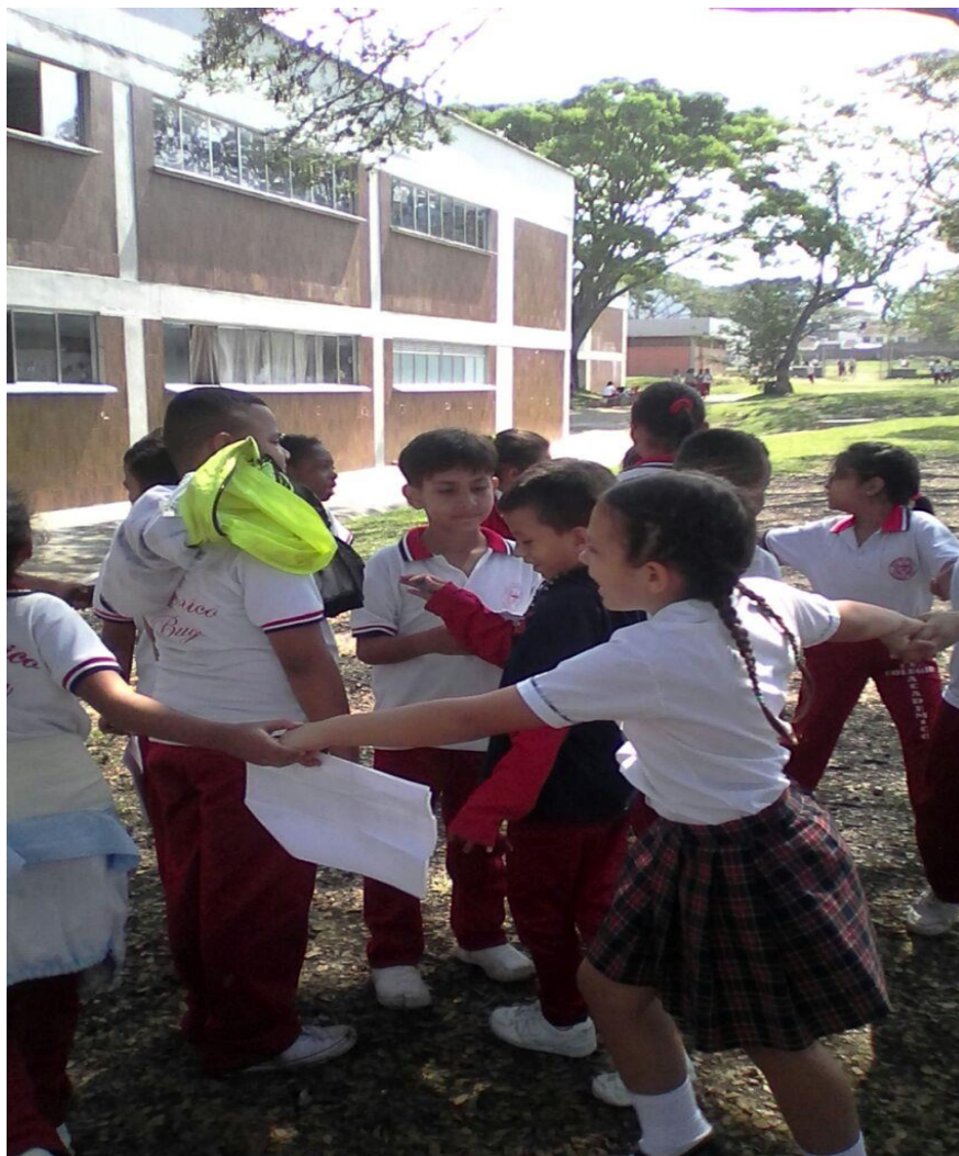
Durante la preparación del dramatizado: El Secreto.

“Me emociono”, es una forma de manifestar las participaciones en las diferentes obras de teatro, el entusiasmo, la entrega y la responsabilidad asumida por cada uno en los diferentes papeles y el siguiente es un manifiesto: “Yo profesora!...quiero ser el señor maíz” (SD3, DC11, E20, G: M), “Yo quiero ser el señor yuca, ya no me da pena” y sonrío (SD3, DC11, E18, G: M),