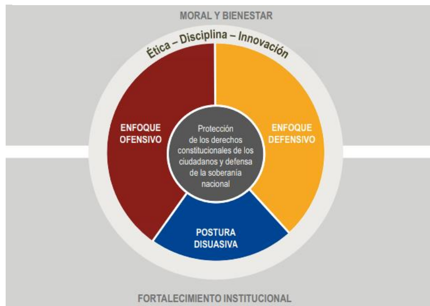
Ilustración 1. Hacia el fortalecimiento institucional