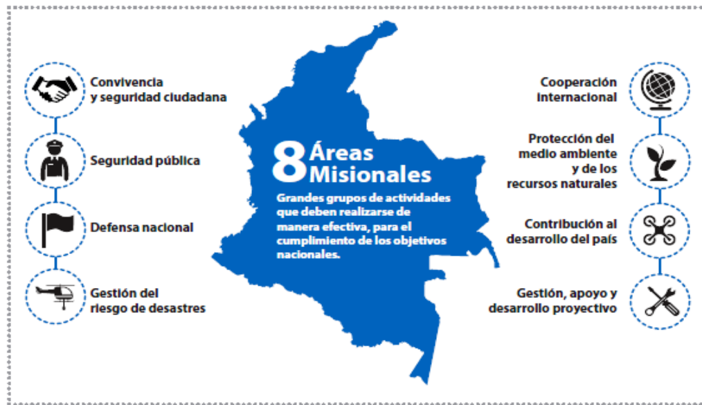
Ilustración 3. Áreas misionales del Ministerio de Defensa en Colombia.