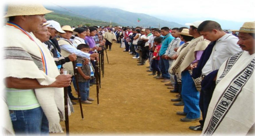
Foto 3: Posesión de las autoridades tradicionales "Nejwe'sx", Vereda Loma Gorda, Jambaló.

Durante el día 21 junio se hace el primer acto de posesión de los Nejwe'sx y Khabuwe'sx, es decir, las nuevas autoridades tradicionales del resguardo, periodo 2011 - 2013 oficializando el sistema de gobierno propio "Nejwe'sx" en el territorio de Jambaló.