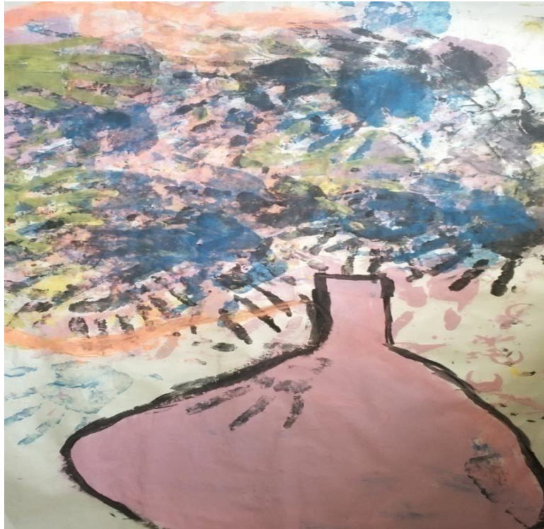
El florero - Foto tomada por Cristian Gabriel Bambague, 22 de octubre 2015.

A la espera de la temática específica a realizar todos se sentaron en circulo como símbolo de unión escucharon atentamente que el tema a tratar se basa en un dibujo libre con la técnica de las manos pintadas. Todos se alegraron, se escucharon gritos porque parte de su corporalidad iba a ser parte de la creación artística. En ese instante se organizaron, se puso papel bond en la superficie y prepararon los materiales a su gusto.