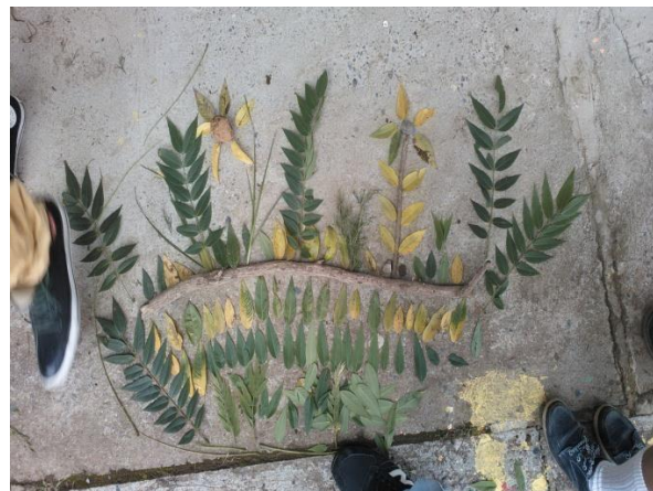
Paisaje de hojas 31