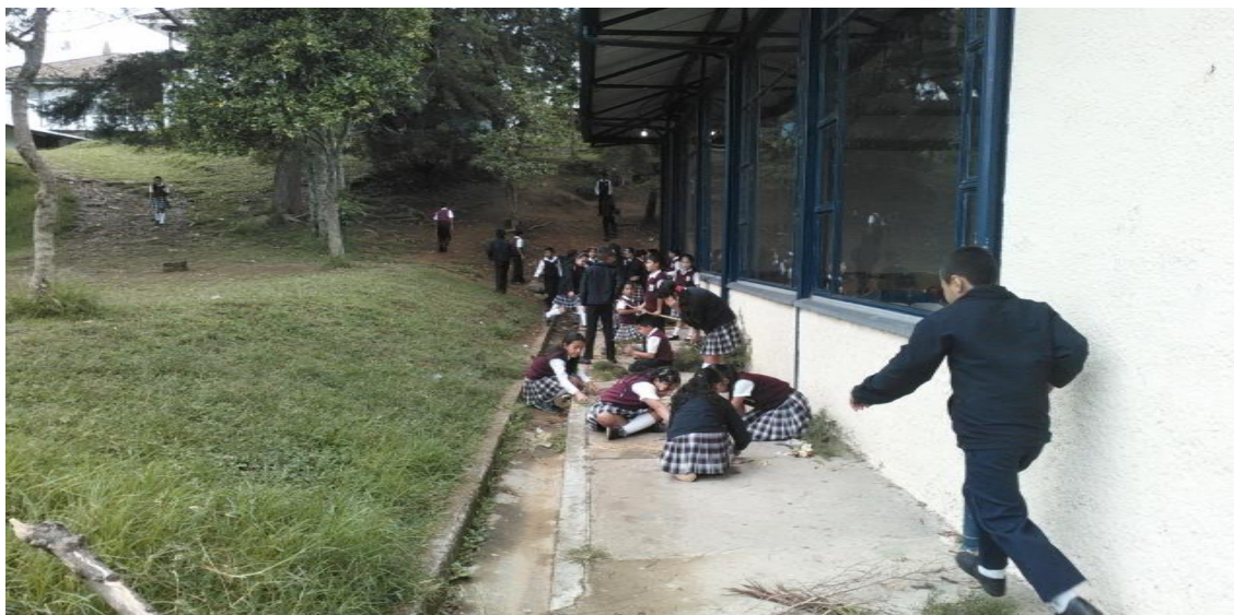
Collage en la naturaleza 37

En esta medida si es posible la convivencia porque existen modos donde se expresa el amor en el educando de manera natural 38 , para que las acciones que se imparten a partir del amor ligen esquemáticamente al yo con el otro, es decir mediante esta emoción se enlaza un buen vivir pedagógico, donde se entra en continua confianza el uno con el otro. Similar a como se pegan las partes de un collage, el amor simboliza el aglutinante donde todos logran conectar. Entendido que el amor es una expresión que se da en lo más mínimo del ser humano como en una sonrisa, una caricia, en la contemplación de sus mismas creaciones artísticas dentro de la práctica pedagógica, en definitiva, gracias al amor se puede establecer relaciones humanas comprensibles.