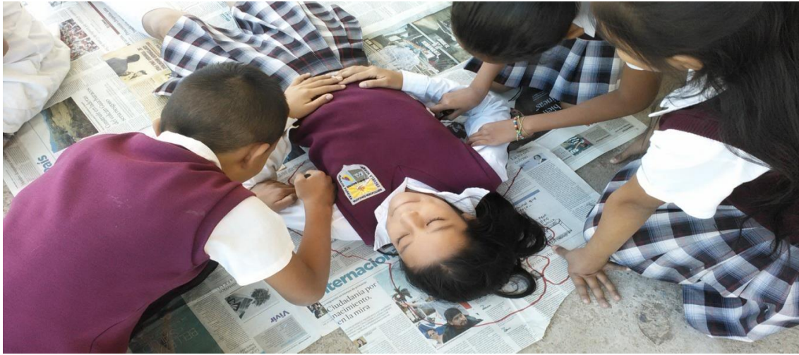
Mi silueta - Foto tomada por Cristian Gabriel Bambague el 2 de Noviembre del 2015

del vigilar que se tienen en la institución. En la siguiente pintura el florero se expresa una forma de realizar flores a través de las manos, con sus respectivos colores vivos, giran alrededor del florero. Esta técnica visibiliza la fragmentación a través de las manos y así poder expresar división de la imagen como división de las relaciones humanas que se unen a través del collage.