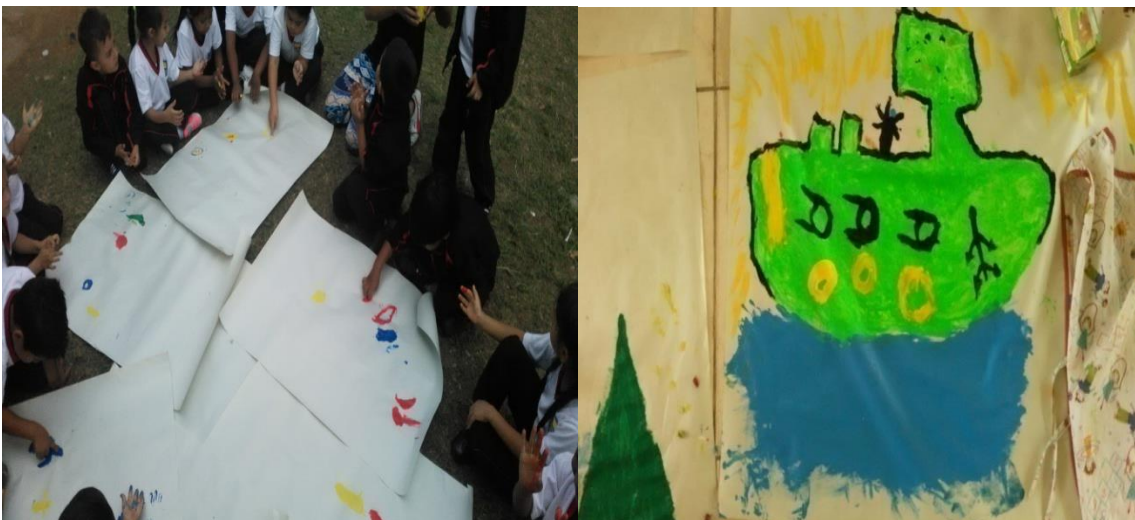
Barquito de papel - Foto tomada por Cristian Gabriel Bambague el 9 de Noviembre del 2015