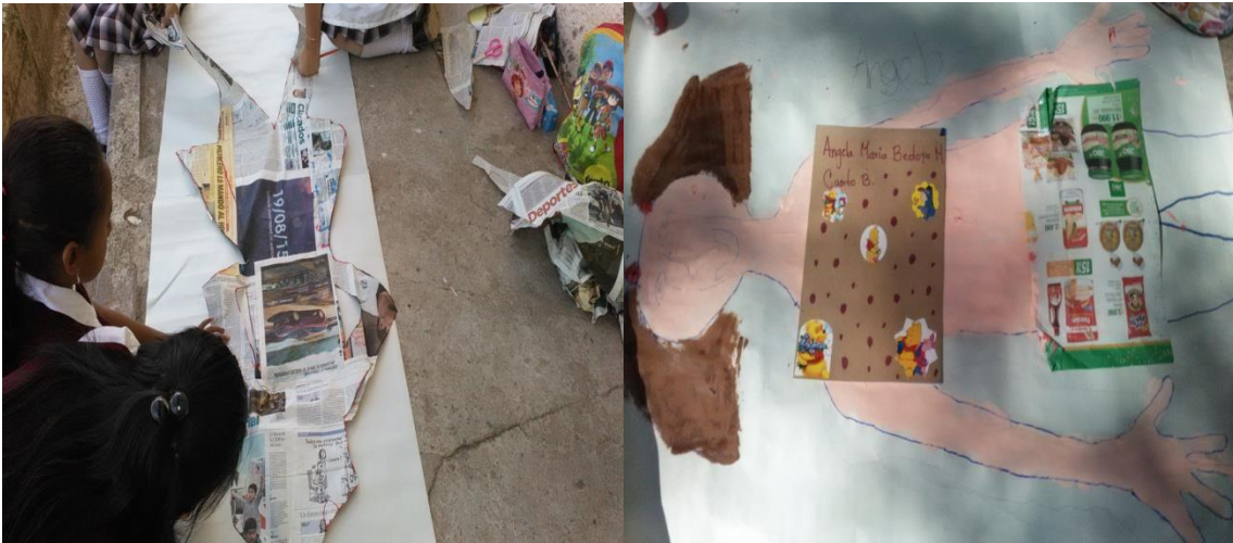
Mi cuerpo - Foto tomada por Cristian Gabriel Bambague el 2 de Noviembre del 2015