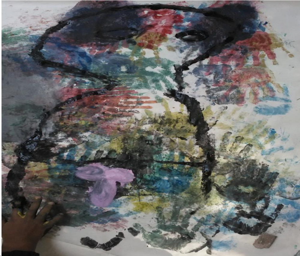
Lo prohibido en la escuela

Lo prohibido en la escuela es un collage sobre manos, éste tiene como finalidad expresar libremente la corporalidad, la imagen asimétrica, el desorden del color con los claros oscuros. La actividad tuvo lugar en la institución educativa Normal Superior, la temática fue dibujo libre, pero la técnica es sobre manos que consiste en seleccionar colores, hacer una mezcla de ellos en la palma de la mano e imprimir en la superficie alrededor de la silueta. Durante la realización del trabajo artístico se dio vía libre a la conformación de los grupos de trabajo, los estudiantes empatizaron por preferencias de género en su mayoría, y algunos por afinidades intelectuales, empezaron a conformar los grupos y de inmediato nos dirigimos hacia la acera del kiosco. En ese mismo instante compartían los vinilos entre los grupos que habían conformado, se cruzaba diálogos, se miraban entre sí para compartir colbón, recortes de periódico y revistas.