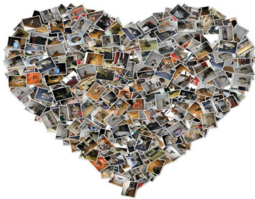
El señor llene... https://www.google.com.co/search

Se ha determinado que la emoción vital para que haya conexión, relaciones humanas dentro de un grupo social es el amor, es una emoción que quizá romántica pero absolutamente vital para la creación de una red social que se teje a partir de elementos como lo es el dialogo. Para reafirmar esta definición Maturana expresa: “el amor es, hablando biológicamente, la disposición corporal para la acción bajo la cual uno realiza las acciones que constituyen al otro como un legítimo otro en coexistencia con uno. Cuando no nos conducimos de esta manera en nuestras interacciones con el otro no hay fenómeno social” 30 , es decir lo que el autor mantiene es que gracias a la presencia de la emoción del amor podemos crear sociedad, y a pequeña escala podemos crear relaciones de grupo.