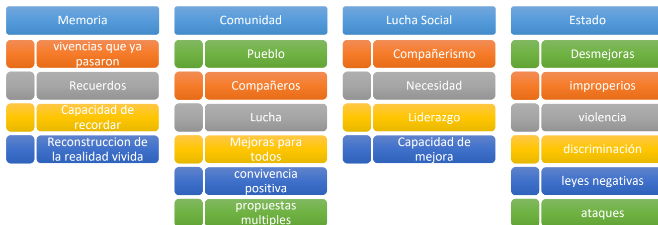
Figura 1 Sistematización diario de Campo

Este es un esquema en el que se expone una categoría de análisis de acuerdo con las necesidades del proyecto investigativo, y los conceptos que más refieren a los mismos durante la investigación, cabe anotar que por la metodología planteada desde la conversación y el diálogo de saberes, se dejan los elementos esenciales en cada temática abordada.