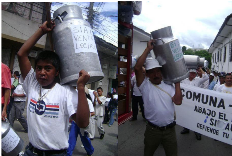
Foto de archivo: La ASEXLECP está conformada en su mayoría por adultos y algunos jóvenes provenientes del sector rural y de barrios populares del municipio de Popayán

La población que compone de manera generalizada la Asociación no son personas que cuentan con amplios estudios o que son grandes ganaderos o empresarios, por el contrario, son personas que subsisten a partir de su oficio, entienden su lugar en la sociedad y la importancia que ellos tienen para la comunidad, son arte y parte de las decisiones que se toman con respecto a producción, transporte, consumo y precio de la leche y fundamentan su vida a partir de este producto. La mayoría de ellos no se ve practicando otro oficio por que el tiempo que llevan en el mismo es bastante y se han acoplado de tal manera a este que la realización del mismo se conjuga en el entorno de manera natural. Y es que no se trata de entes individuales, la producción de leche tiene un impacto en el entorno familiar, el oficio en múltiples ocasiones es heredado en conjunto con las rutas de comercialización.