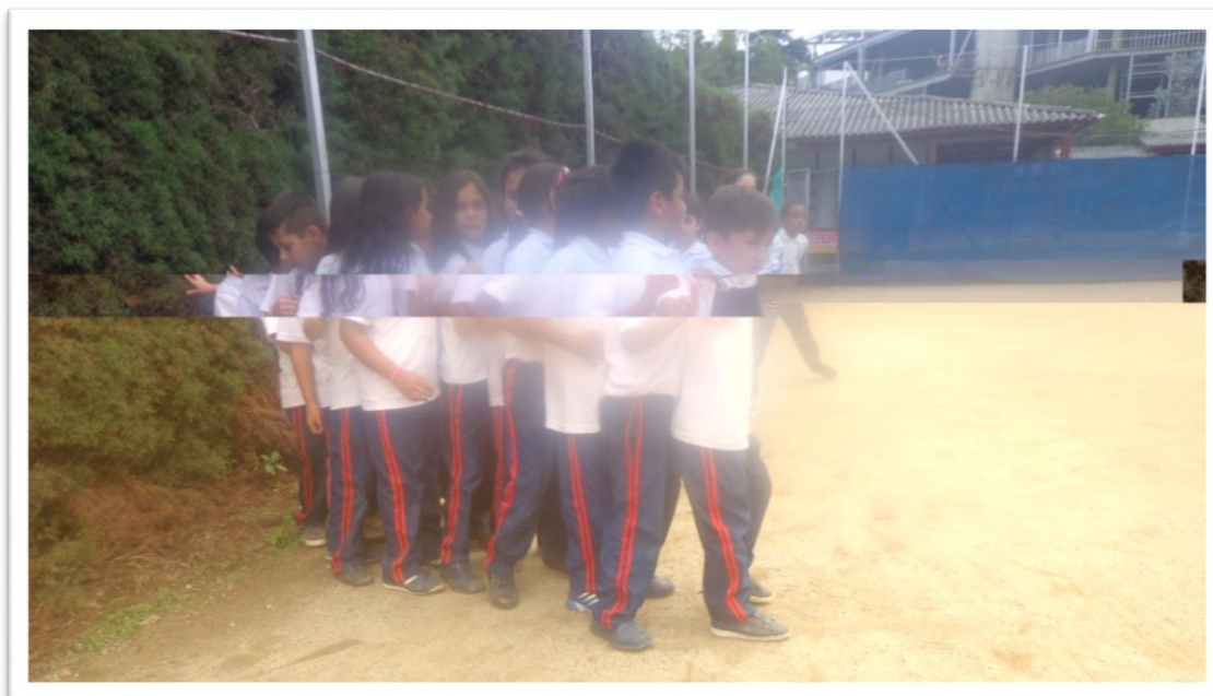
Figura 9. Turnándose para jugar