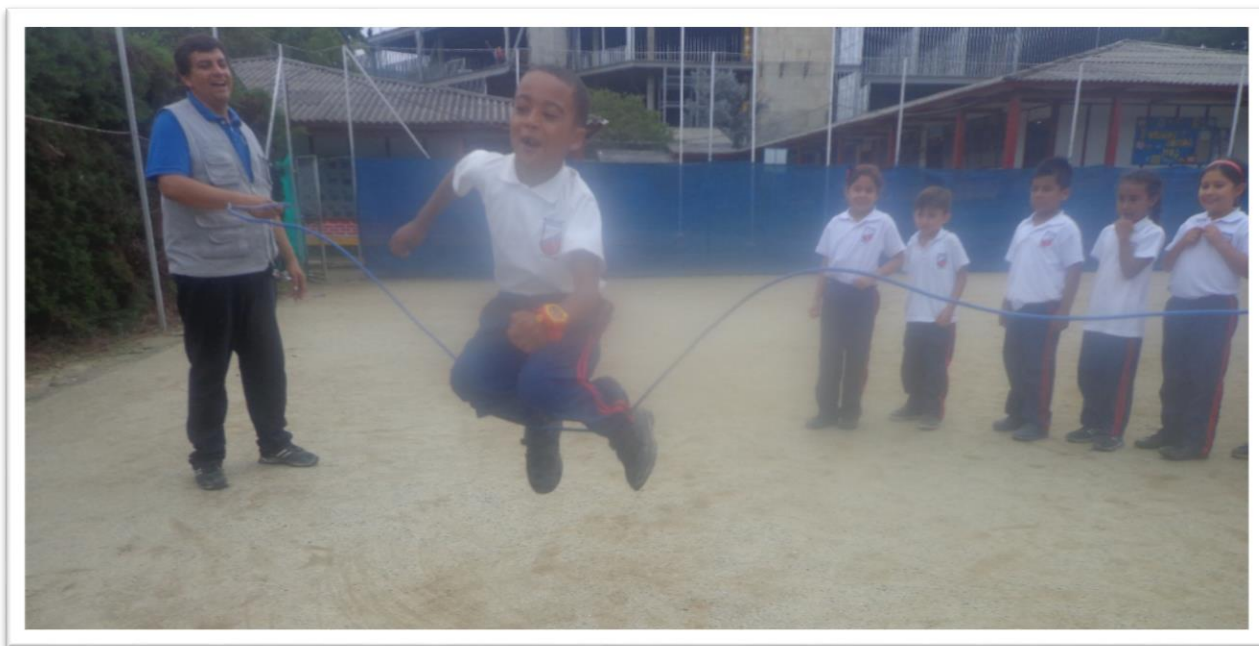
Figura 7. Saltemos el laso