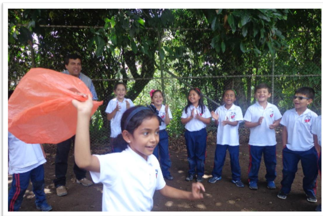
Figura 3. Juego la chuspa de aire