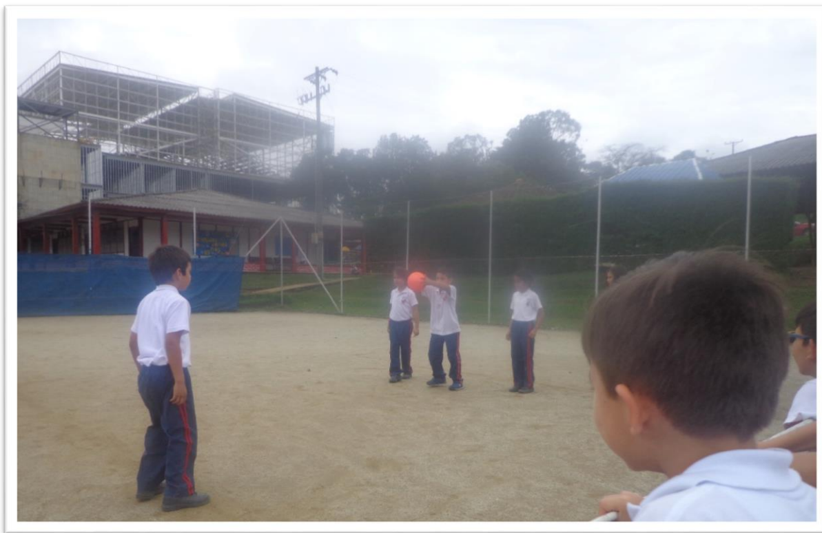
Figura 5. El ponchado