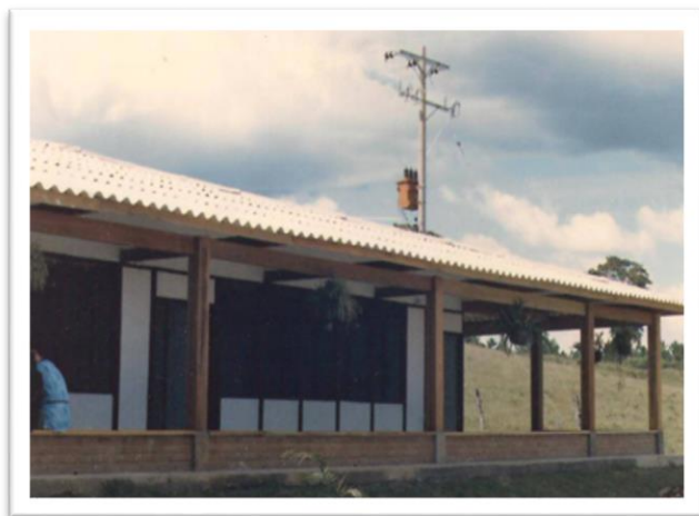
Figura 1. Aulas colegio los andes