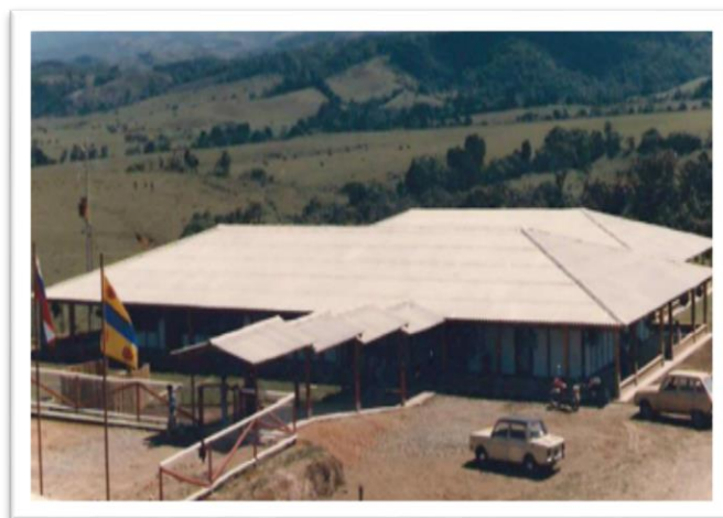
Figura 2. Panorámica colegio los andes