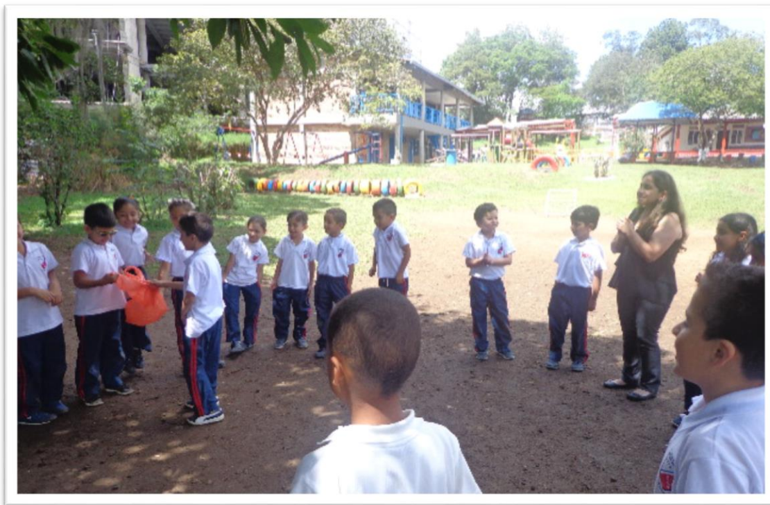
Figura 4. Juego la chuspa de aire

Las expresiones artísticas en los juegos tradicionales nos han permitido visualizar, que un niño se divierte, aprende, expresa sus emociones mediante el juego.