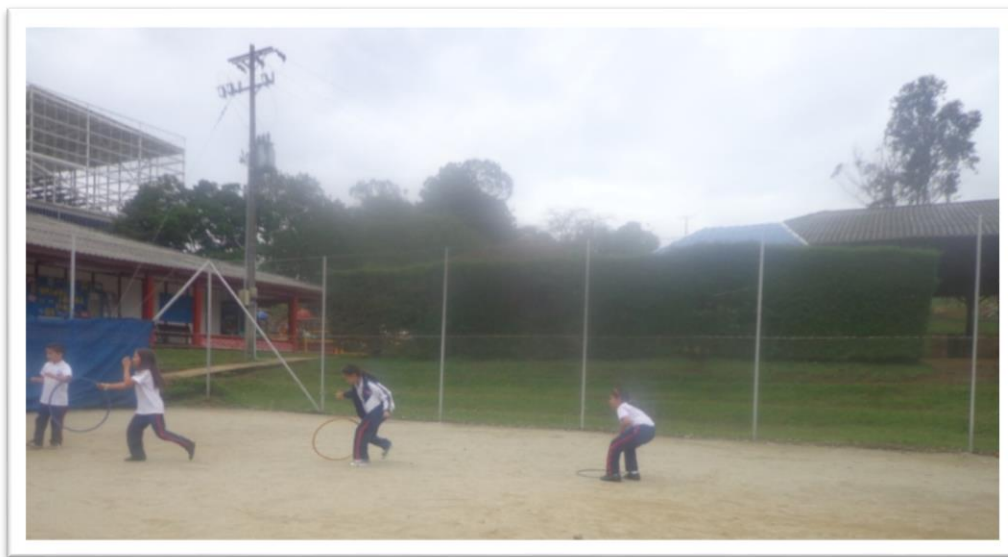
Figura 11. Equilibrio con la rueda