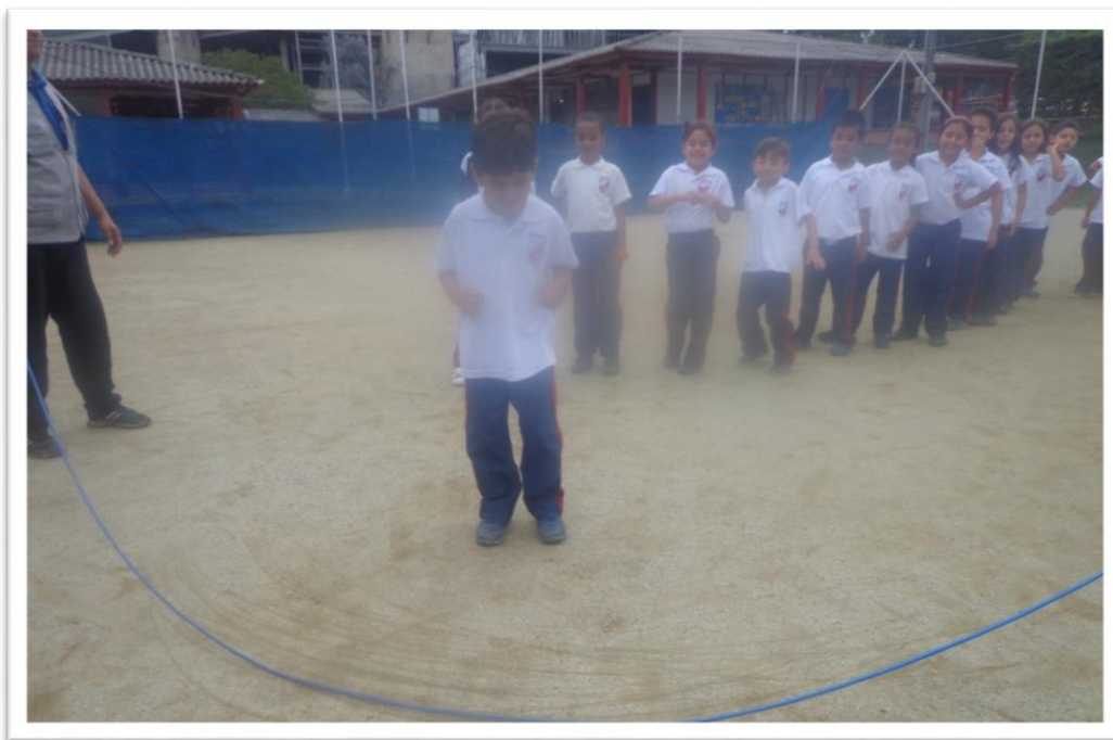
Figura 8. Saltanto, saltando