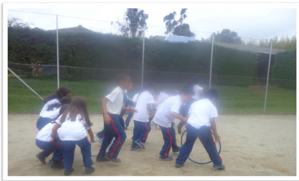
Figura 12. Carreras con la rueda