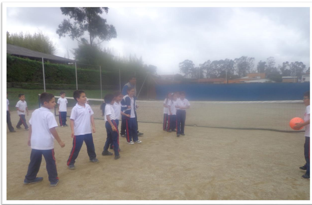
Figura 6. El ponchado