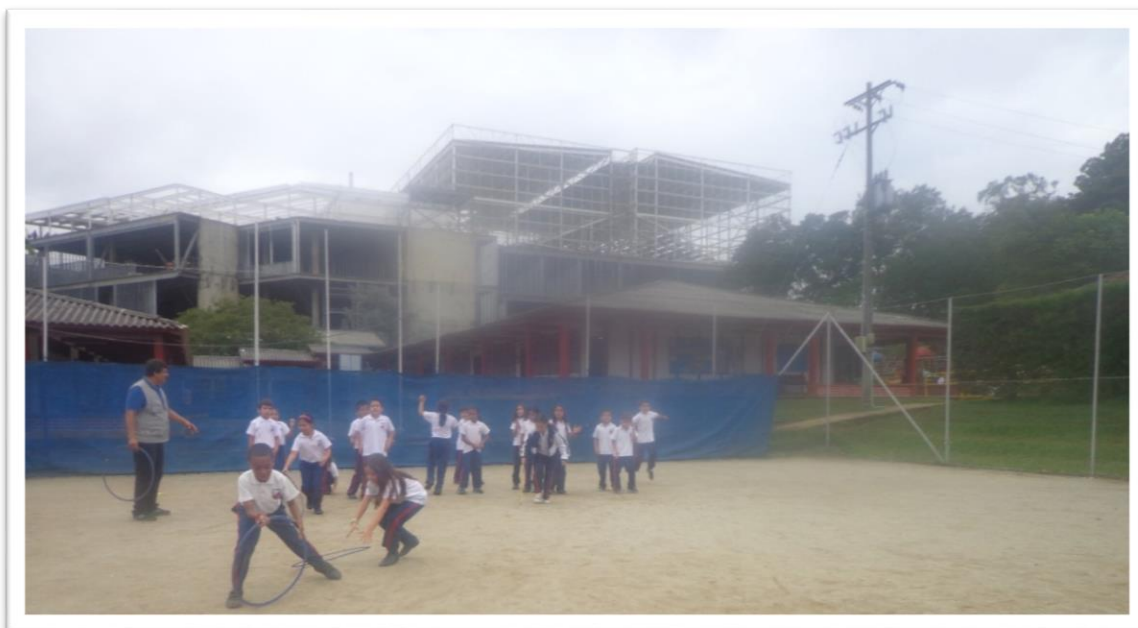
Figura 10. A la rueda, rueda