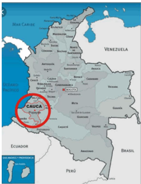
Figura 1. Ubicación geográfica del Colegio en Cauca - Colombia