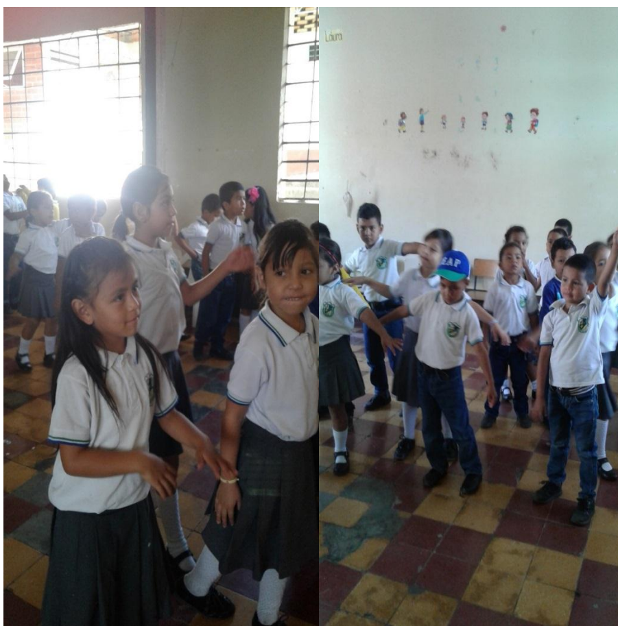
Ilustración 11 Actividades entre niños y niñas

Al iniciar la propuesta pedagógica, en algunas actividades rítmicas se pudo evidenciar que uno de los elementos que determinaron estas prácticas fue sin duda la asimilación de las actividades y la diferencia entre los niños y las niñas al