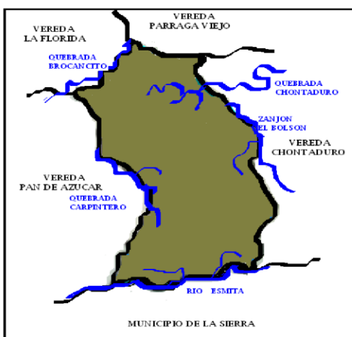
Ilustración 2 Mapa Municipio de Rosas Cauca