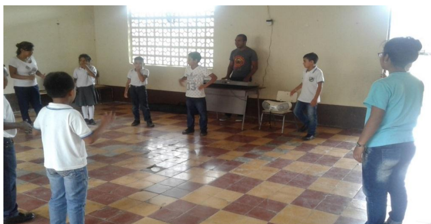
Ilustración 12 Ejercicios Rítmicos

La creatividad permite que las personas en su mayoría puedan expresar de manera libre y abierta sus emociones, más aun en el caso de los niños quienes teniendo presente su corta edad no están aún cohibidos por las influencias que ya de adultos hace que las personas sean menos expresivas, ahora bien al dar inicio a las actividades a desarrollar en esta propuesta se pudo notar que algunos niños y niñas presentaban ciertas dificultades para expresarse, bien fuera de manera individual o grupal y que les era difícil por muchas situaciones ser libres y espontáneos para ciertas situaciones.