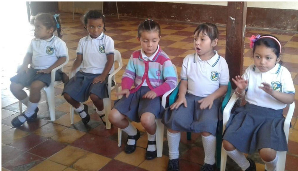
Ilustración 3 Niñas Grado Primero

Es también pertinente resaltar que en algunas ocasiones una dificultad fue el transporte de algunos instrumentos necesarios para el desarrollo de las actividades como el piano y algunos elementos de percusión, pero estas se resolvieron de manera oportuna para no frenar el desarrollo de las prácticas planteadas.