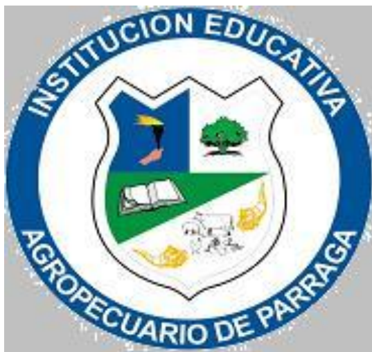
Ilustración 1 Escudo Institución Educativa Agropecuaria De Parraga.

Nombre: Institución Educativa Agropecuario de Párraga. Principal Colegio Mixto Agropecuario de Párraga. Sede: Escuela Rural Mixta Pan de Azúcar. Dirección: Párraga Municipio: Rosas Departamento: Cauca. Código DANE: 219622000042. NIT 8170063-3 Modalidad: Técnica Agropecuaria. Población atendida: Mestiza, Afrocolombiano.