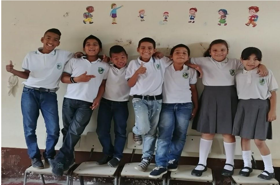
Ilustración 5 Estudiantes Grado Cuarto

realiza inicialmente con todos los estudiantes y luego se van organizando subgrupos que darán ciertos movimientos característicos, donde la regla es no repetir ninguno de los movimientos realizados por los demás, así se van distribuyendo en grupos más pequeños hasta llegar a que de manera individual cada estudiante sea capaz de representar un movimiento único acompañándolo con lo que el considere de percusión corporal.