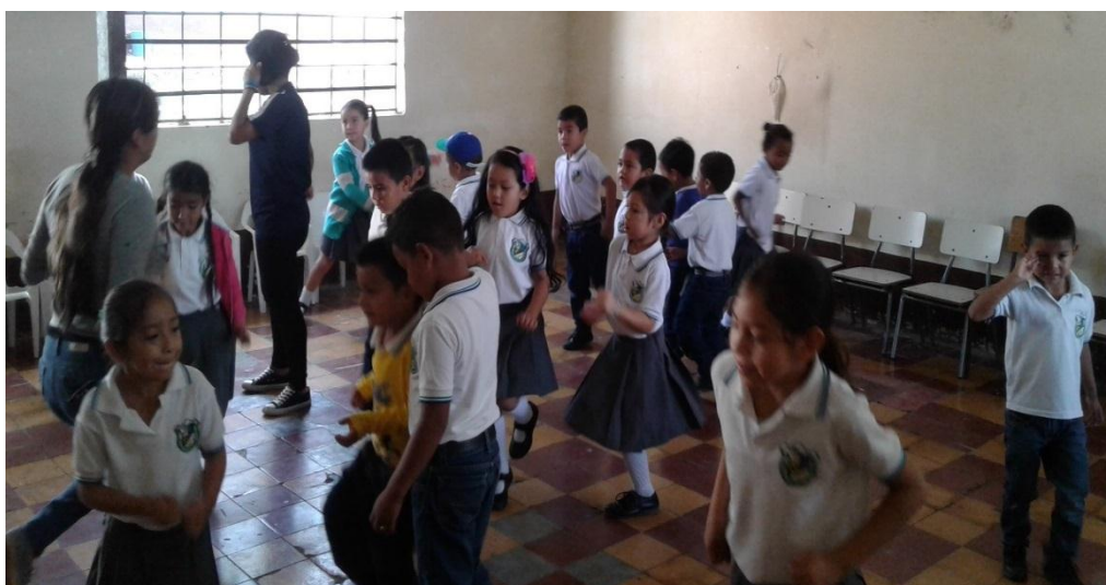
Ilustración 14 Actividades de Movimiento y Expresión

Es importante resaltar que cualquiera de las actividades que los niños y niñas realizan dentro de los espacios escolares tienen una gran influencia en los demás espacios cotidianos en los que se desenvuelven sus vidas, por ello a partir de la escuela, el hogar es un espacio fundamental en el que ellos y ellas determinan sus acciones y en donde se coloca también de manifiesto la manera como se establecen las relaciones de convivencia con las demás personas. Por ello se debe tener en cuenta que estas relaciones están supeditadas a los entornos particulares sobre los