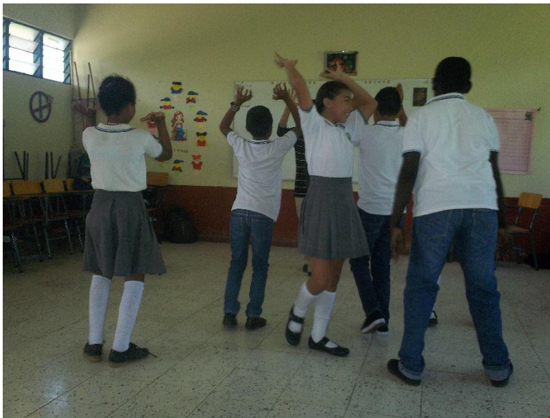
Ilustración 4 Estudiantes Grado Quinto

Ya al término del paseo comentan la experiencia donde los estudiantes expresan su reacción frente a la práctica, que fue lo que más les llamo la atención, que fue lo que menos les gusto y el porqué.