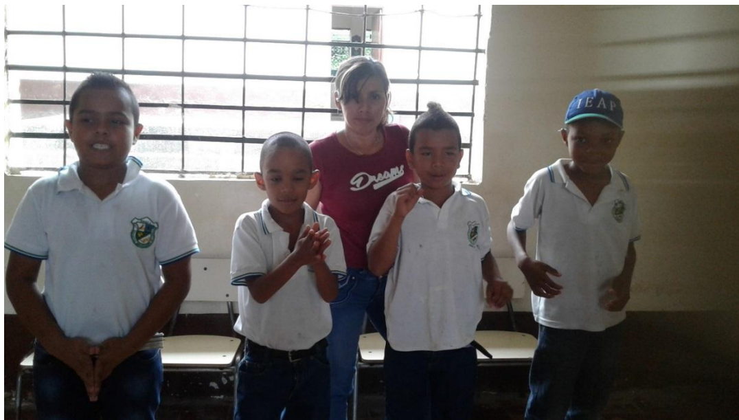
Ilustración 9 Estudiantes Grado Tercero