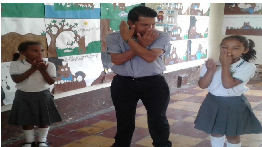
Ilustración 10 Prácticas Rítmicas de Coordinación