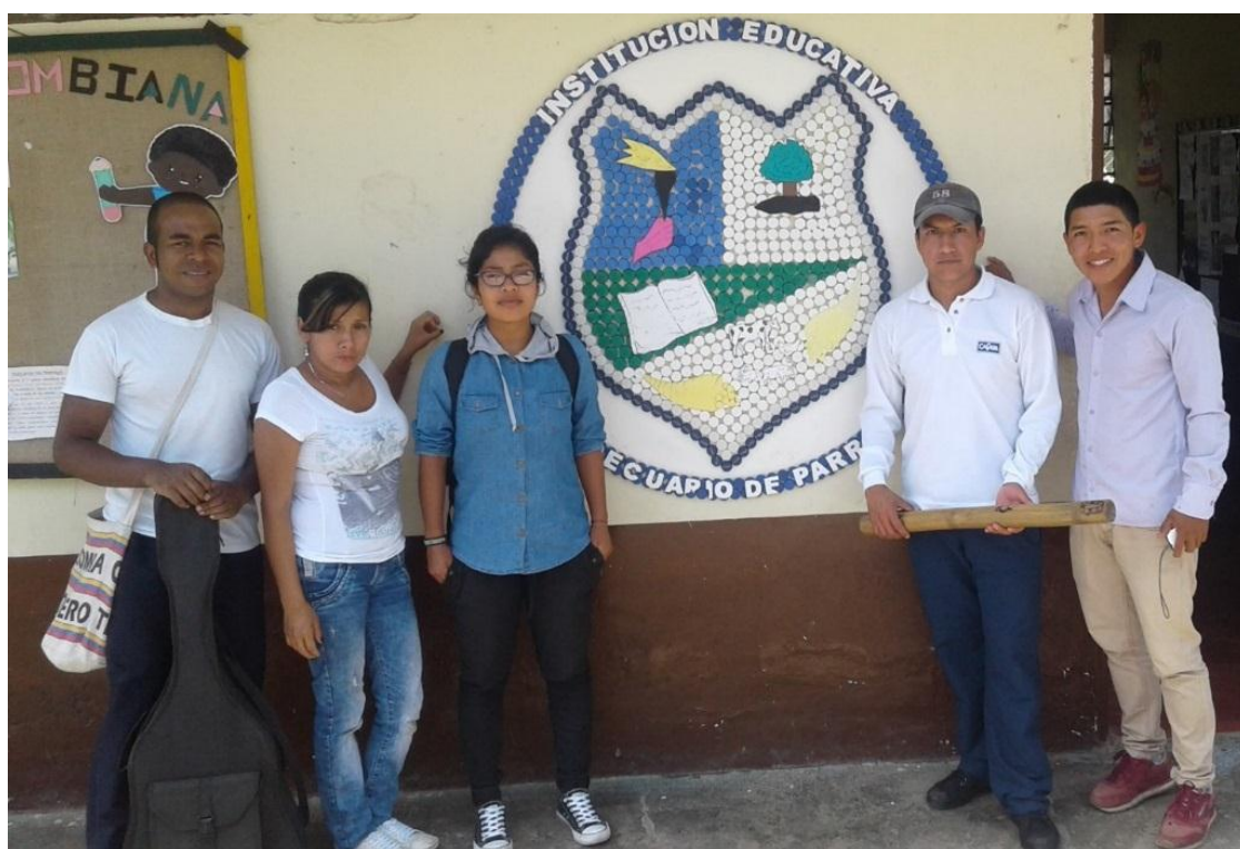
Ilustración 16 Estudiantes Practicantes Universidad del Cauca

padres, con sus hermanos (as) y demás familiares puesto que ello le va a permitir crear un ambiente de tranquilidad orientado a una sana convivencia familiar. Ahora bien, aunque es claro que la mayoría de los hogares no funcionan de la misma manera y que los miembros de los mismos manejan diferentes tipos de temperamentos que influyen positiva o negativamente en las conductas posteriores de los niños y niñas en otros contextos es preciso que la habilidad creativa pueda ser un factor positivo determinante a la hora de la resolución de algún tipo de conflicto, de alguna situación en la que los niños y niñas se vean confrontados y se requiera una respuesta ágil y acertada.