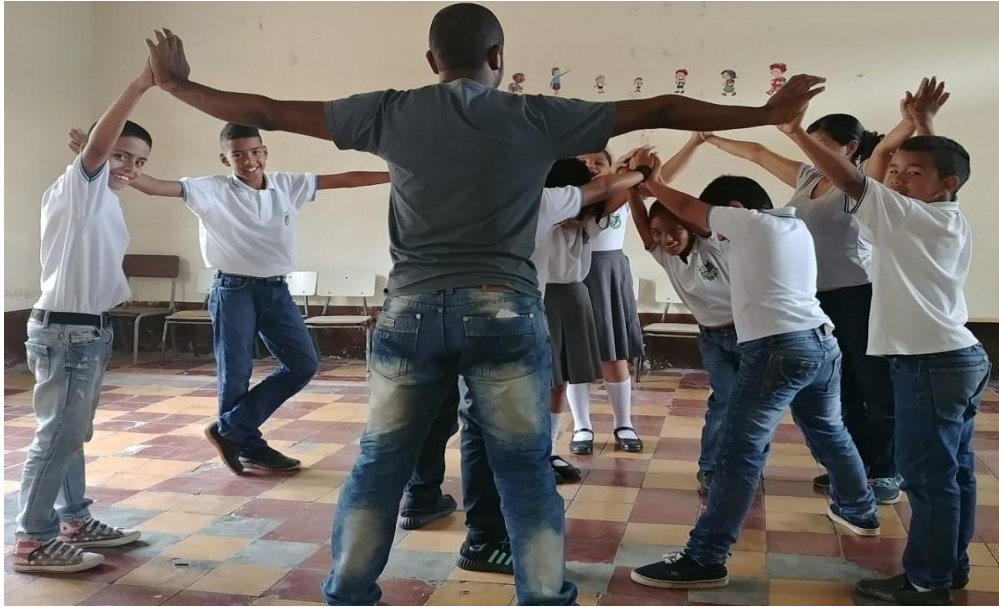
Ilustración 8 Estudiantes Grado Cuarto