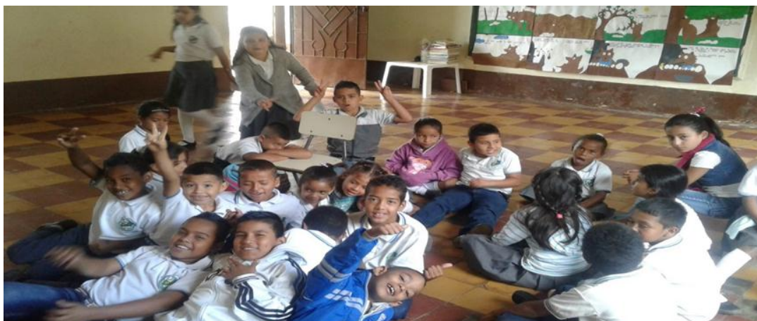
Ilustración 15 Actividades musicales de relajación

relacionar con otros compañeros y compañeras es muy distinto a las relaciones dentro del hogar con los familiares o fuera de la escuela y del hogar cuando hacen y establecen relaciones en sociedad o comunidad. Ser creativos para expresarse, para comunicarse, para cohabitar y para convivir, de igual manera que para aprender y conocer.