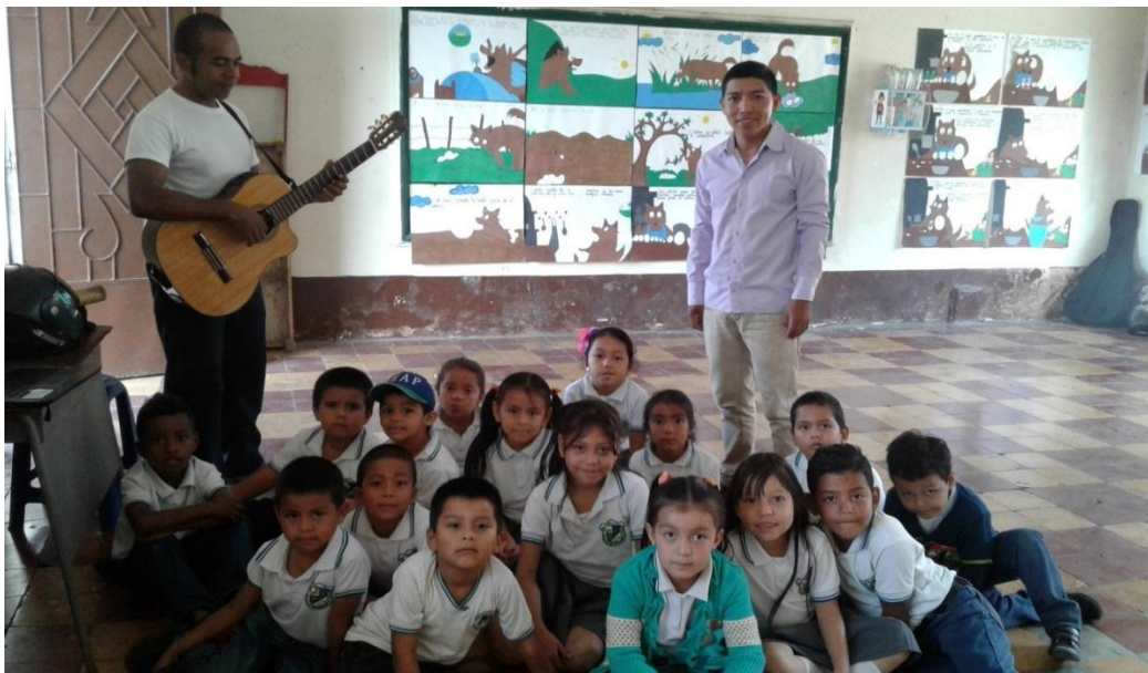
Ilustración 6 Estudiantes Grados Primero y Segundo

Se organizan a los estudiantes en grupos, a cada grupo se le asigna su respectivo director y luego se les distribuye una tarjeta conteniendo el dibujo de un instrumento musical. Al sonar la música, los integrantes del equipo deben ejecutar imaginariamente el instrumento presentado utilizando para ello su cuerpo a través de movimiento. A la indicación del docente, los directores intercambian grupo y los integrantes ejecutan el nuevo instrumento. Se solicita utilizar todo el cuerpo para una mejor “ejecución” del instrumento.