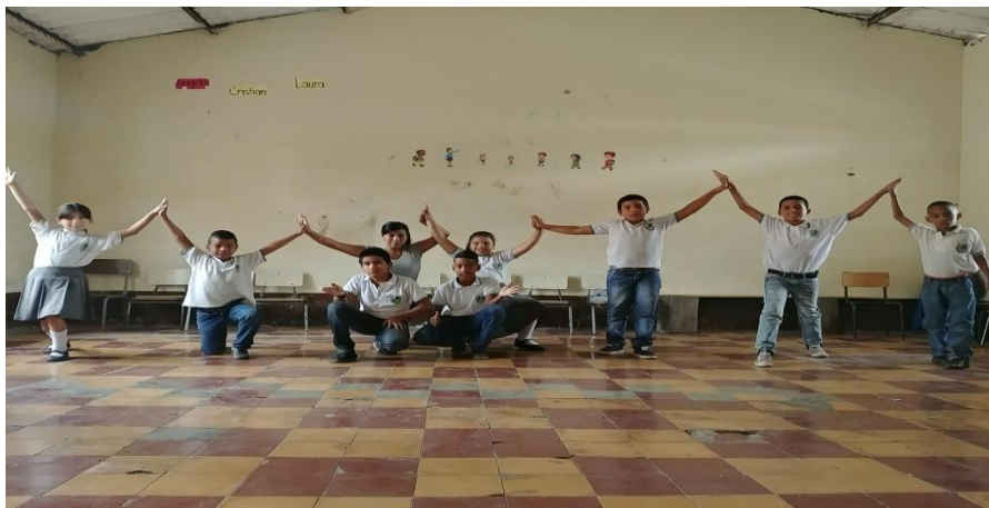
Ilustración 13 Actividades de Coordinación y Concentración

Todas estas apreciaciones durante el proceso práctico evidencian que la creatividad juega un papel muy importante en el desarrollo de la personalidad de los estudiantes en su manera de afrontar y aprender las diversas disciplinas escolares.