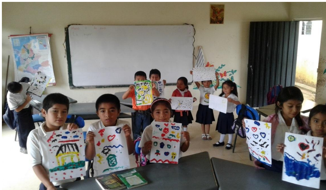
Ilustración 7 Estudiantes Grado Segundo

Cabe resaltar que en este caso la actividad se orienta hacia la manera como cada estudiante escucha y su capacidad para expresar esos sonidos a través de la pintura desde una perspectiva particular.