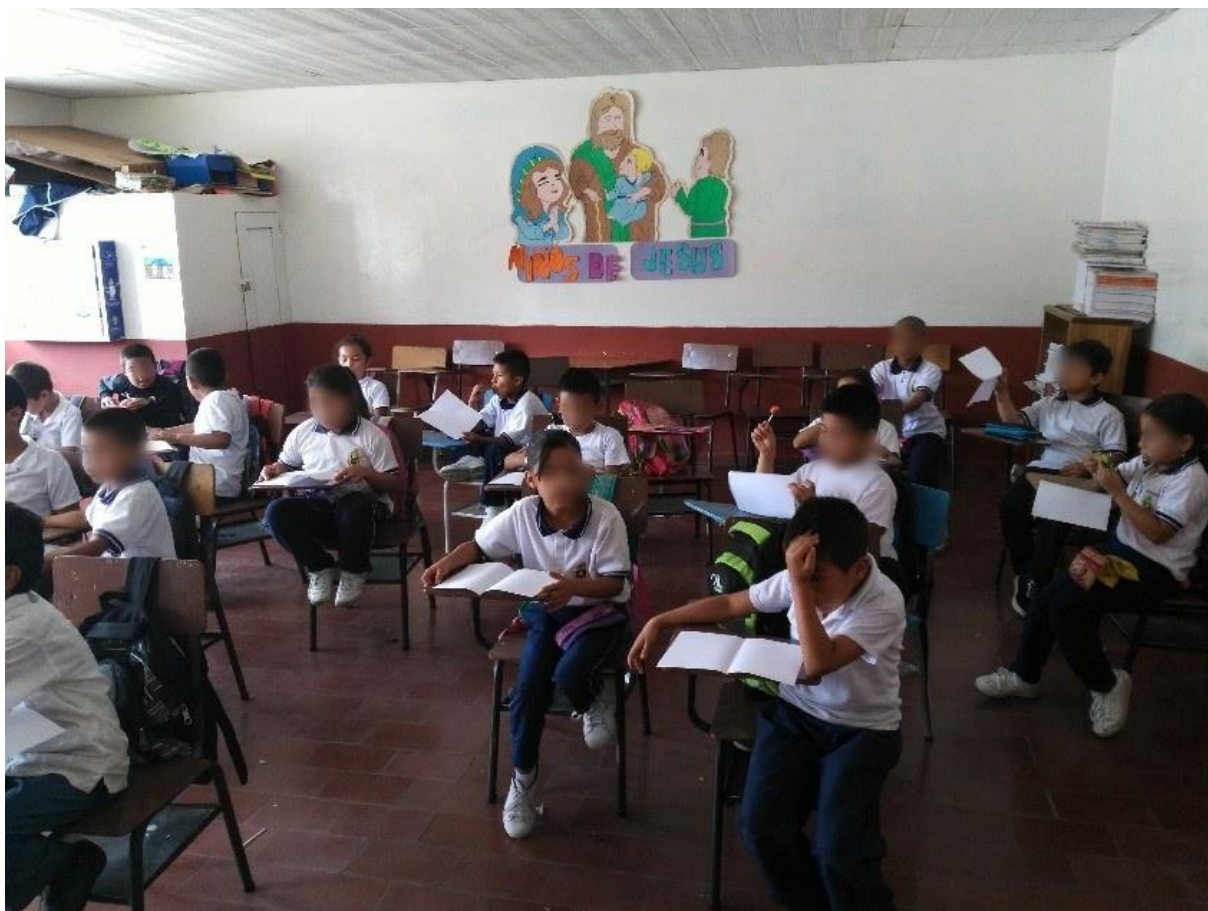
Imagen 2: Educación tradicional reflejada en los cuadernos, posturas y gestos de los niños.

La educación en la escuela ha manejado erróneamente la idea de formar con disciplina para exigir orden y respeto, esto se puede evidenciar desde la educación que recibieron nuestros abuelos y padres en la cual el docente imponía disciplina a través de los castigos que se aplicaban cuando no se acataban correctamente las indicaciones, los castigos más comunes eran: arrodillarse en maíz durante largas horas, sostener ladrillos y recibir golpes en la palma de sus manos e impedirles salir al descanso, lamentablemente en la actualidad aunque no se hace uso de los castigos severos se observa que muchos docentes utilizan diferentes maneras de intimidación frente a los comportamientos de los niños, por ejemplo: los gritos, regaños y amenazas, sin importar los problemas que se encuentran en cada uno de los estudiantes por diferentes aspectos de su vida