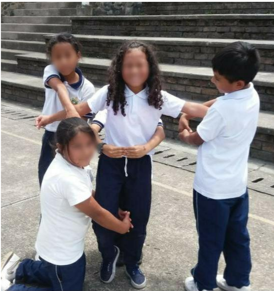
Imagen 10: Demostración de la actividad realizada para incentivar la comunicación, la imaginación y el trabajo en equipo.

Por otra parte, se analiza que aplicar la dimensión de la imaginación implica fomentar la capacidad creadora a partir de las experiencias propias que suscitaron emociones y que fueron expresadas en todo el proceso a pesar de las dificultades que al inicio se presentaron pero que al final dieron fruto a través del proceso de transformación del cuerpo como lenguaje fundamental del ser humano.