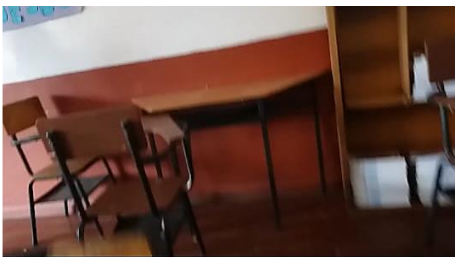
Imagen 1: Pupitre que simboliza individualidad y orden dentro del aula de clases.

y socializar libremente. El pupitre personal se convierte en artífice y promotor simbólico del individualismo, ya que el cuerpo del niño se siente cohibido al permanecer sentado en un espacio cerrado recibiendo órdenes durante una larga jornada, esto lleva a la ansiedad, cansancio y desesperación, ya que el deseo por liberarse lleva a tener actitudes de resistencia que muchas veces se traduce en problemas de atención y convivencia en la comunidad educativa, “[...] la escuela [...] se dedica a aquietar los cuerpos, en lugar de pensar en las potencialidades de su movimiento.” (Cabra y Escobar, 2014, p.154), es decir, solo se concibe al cuerpo para realizar actividades básicas ignorando sus habilidades como el desarrollo de la imaginación, la creatividad, espontaneidad, conciencia y comunicación corporal.