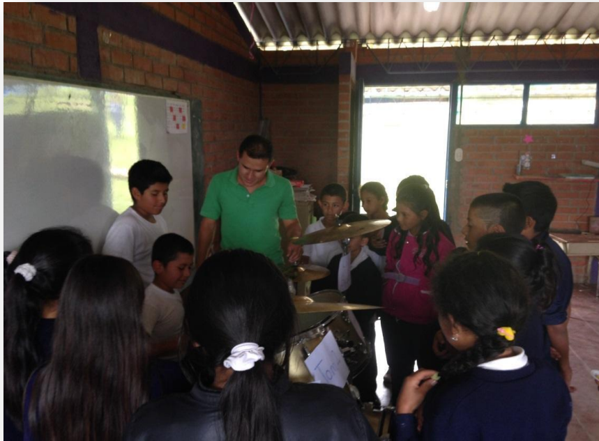
CLASE DE ARTÍSTICA: LA MÚSICA. (USO DE INSTRUMENTOS)