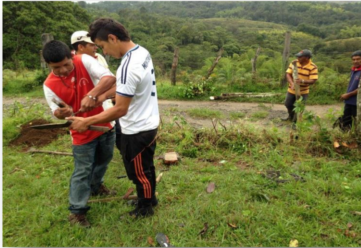
MINGA CON PADRES DE FAMILIA