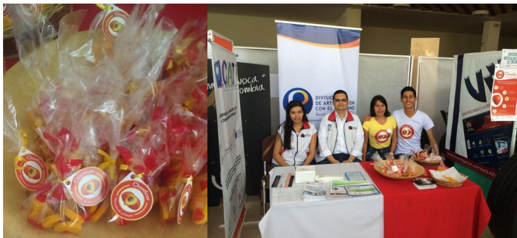
Ilustración 9. Socialización de temas de Liderazgo y Emprendimiento en la XIV Feria Empresarial.