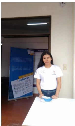
Ilustración 10. Entrega de publicidad y socialización de temas relacionados con METANOIA.