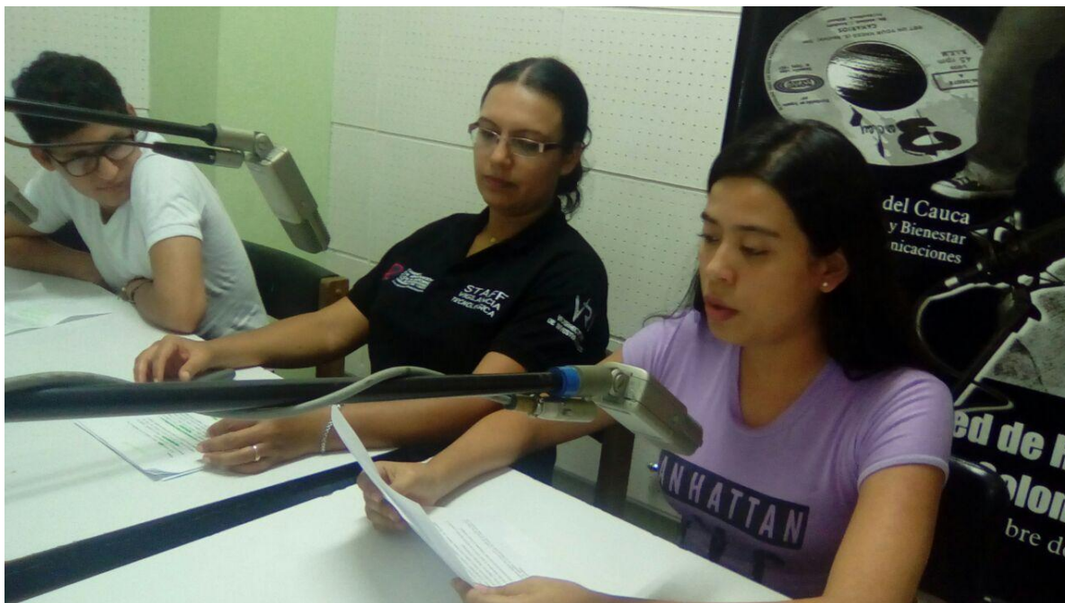
Ilustración 5. Participación Programa de radio “SABERES”, con el tema de producción de alimentos y seguridad alimentaria.