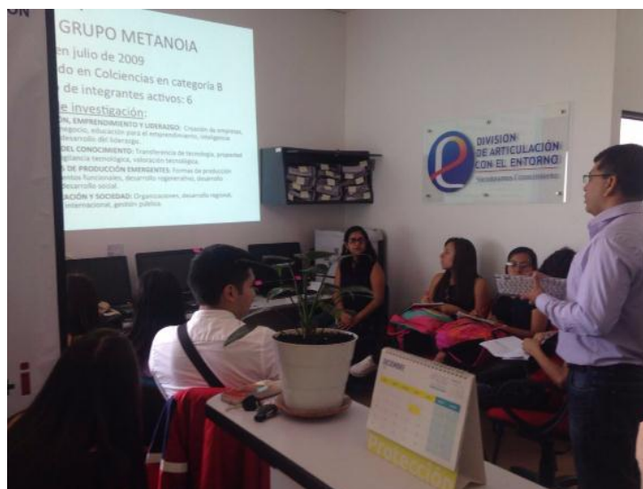
Ilustración 8. Socialización de temas Centro de Liderazgo.