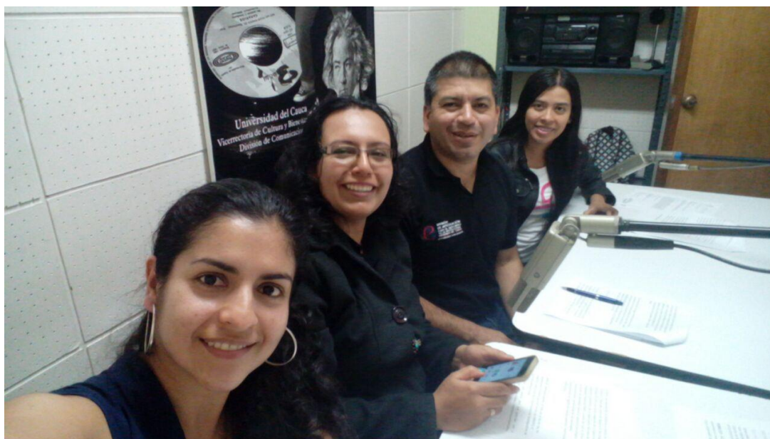
Ilustración 6. Participación Programa “SABERES”, con el tema de Pensamiento Complejo.