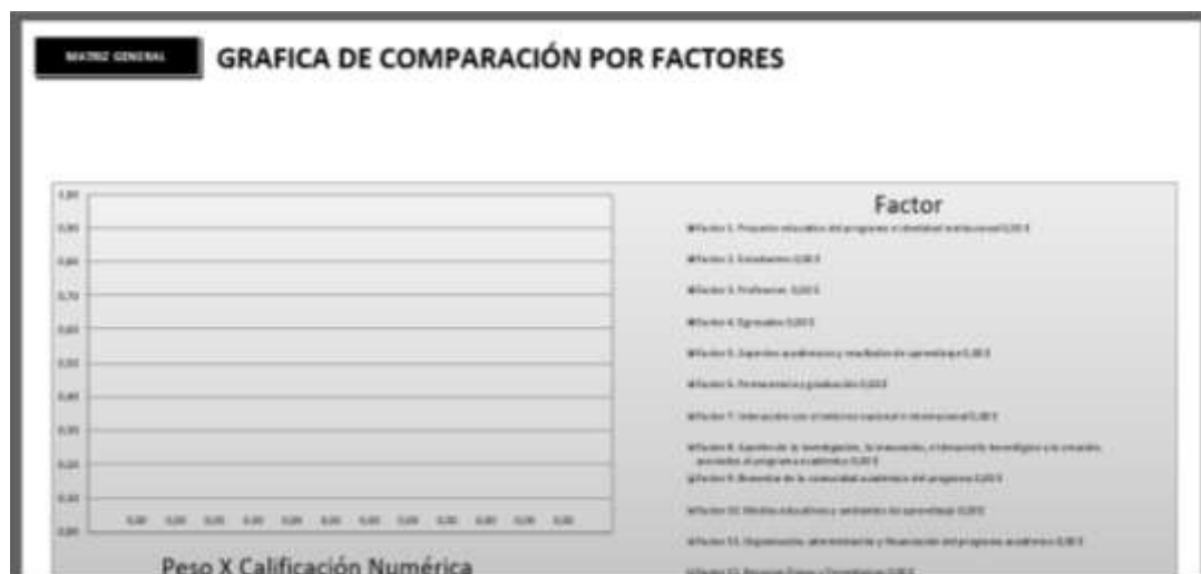
Tabla 10 Bitacora. Gráfico comparación de factores